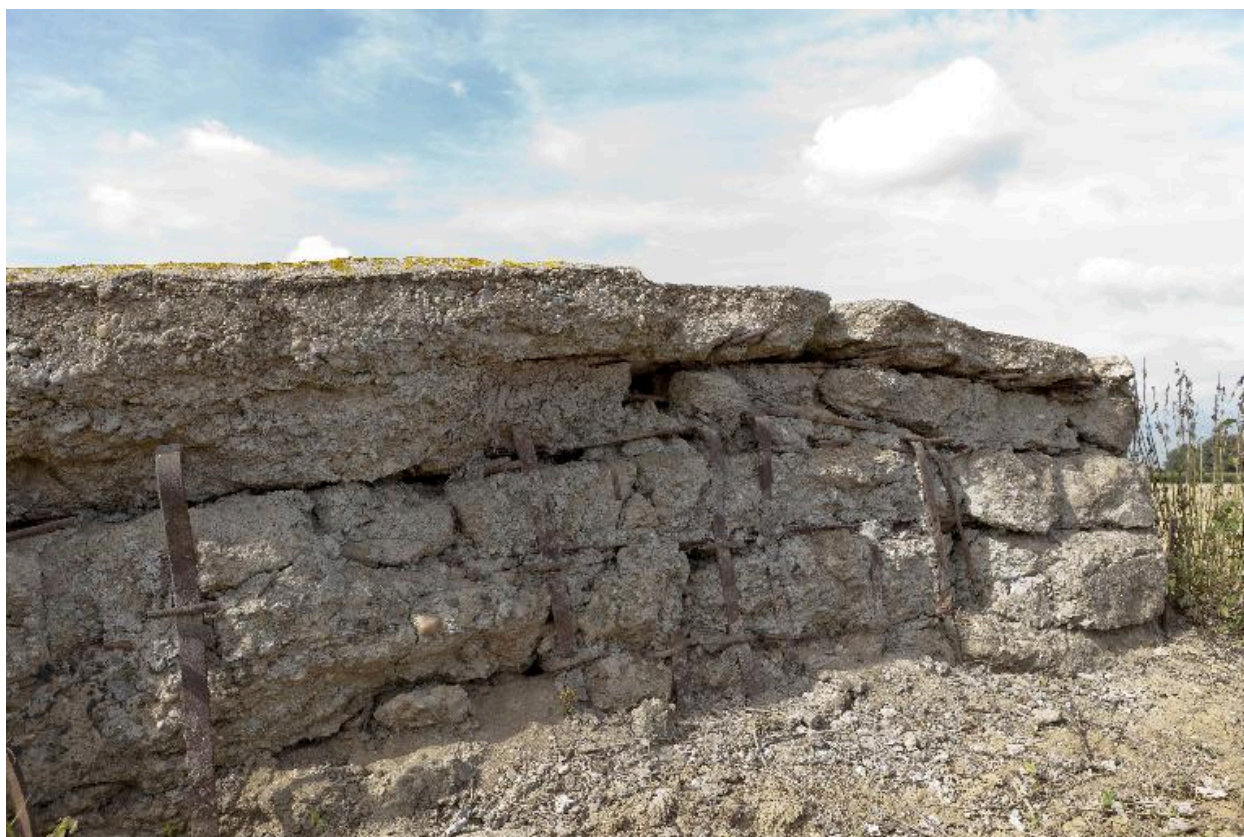
Elévation est, détail