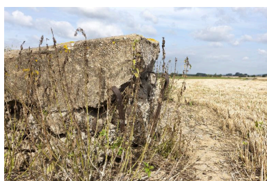
Angle sud-est. Détail IVR31_20145904595NUCA