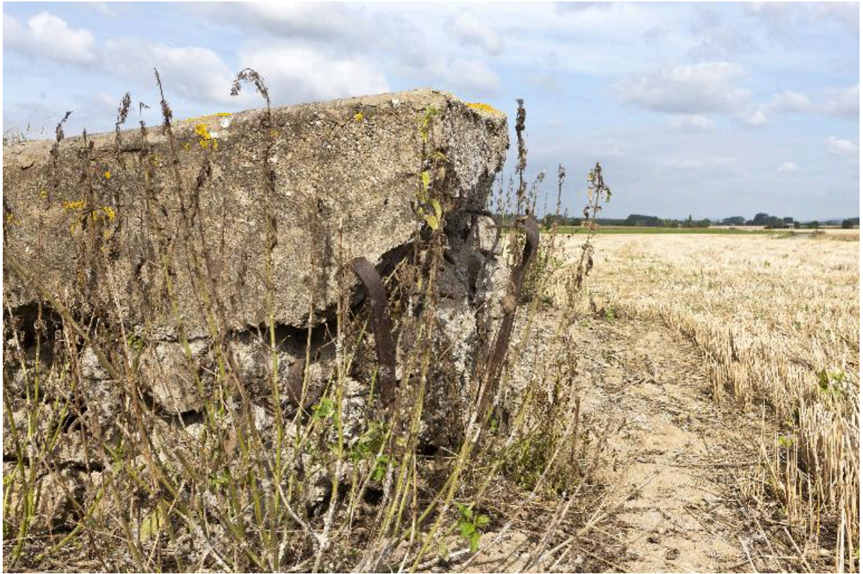
Angle sud-est. Détail