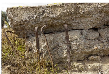
Elévation est, détail IVR31_20145904592NUCA