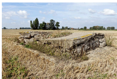
Vue vers le nord-ouest IVR31_20145904589NUCA