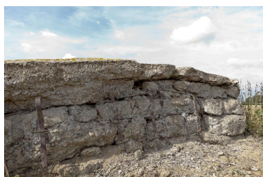
Elévation est, détail IVR31_20145904593NUCA