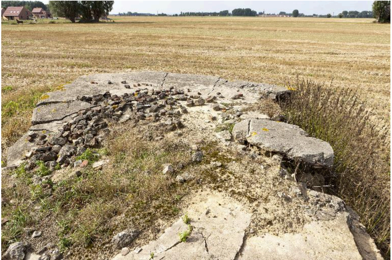
Vue du couvrement, vers l'ouest