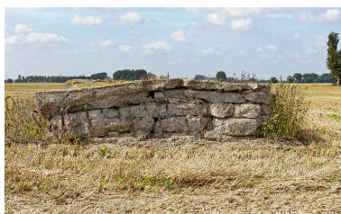
Elévation est IVR31_20145904588NUCA