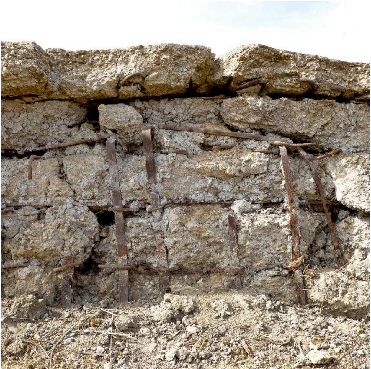
Elévation est, détail