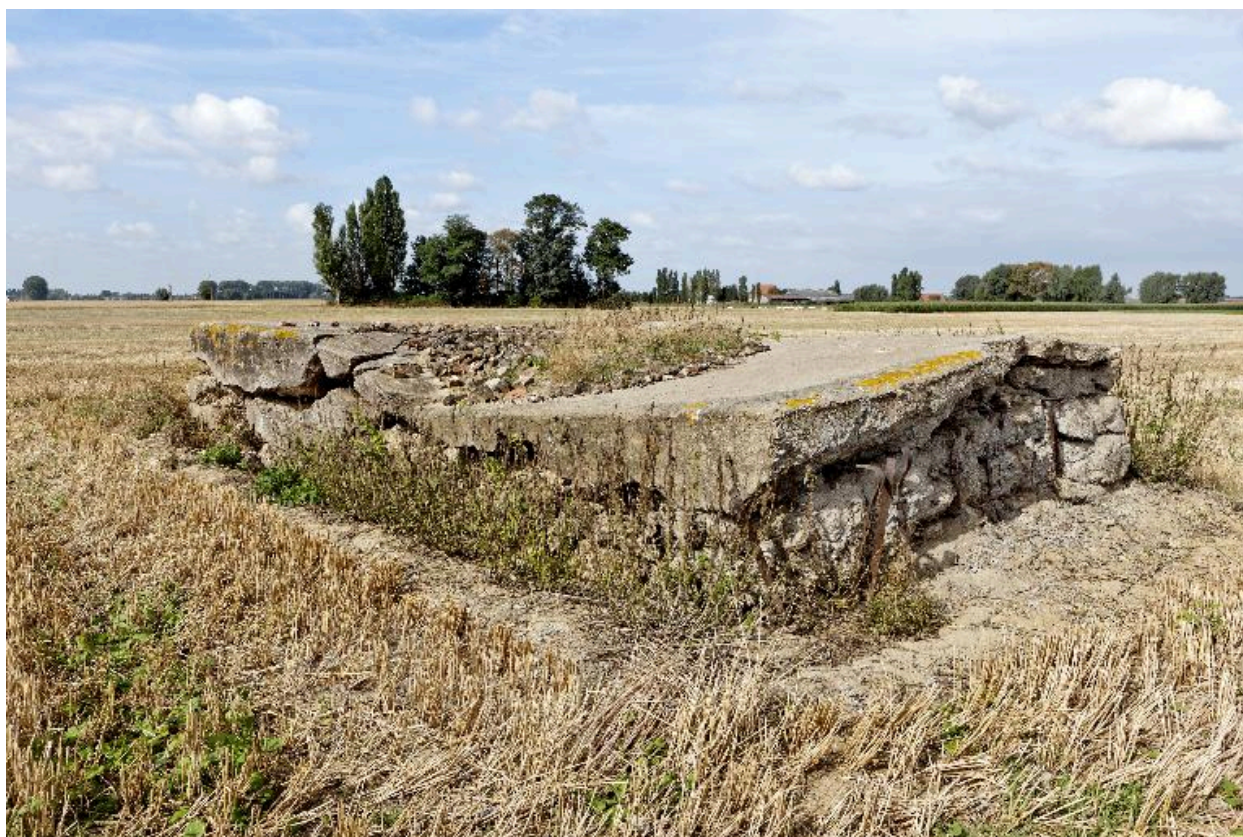
Vue vers le nord-ouest