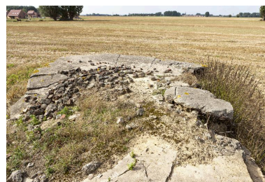
Vue du couvrement, vers l'ouest IVR31_20145904594NUCA