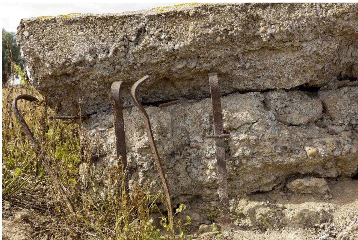
Elévation est, détail