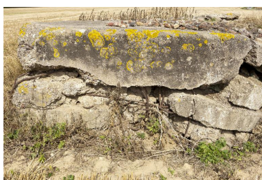
Elévation sud, détail IVR31_20145904590NUCA