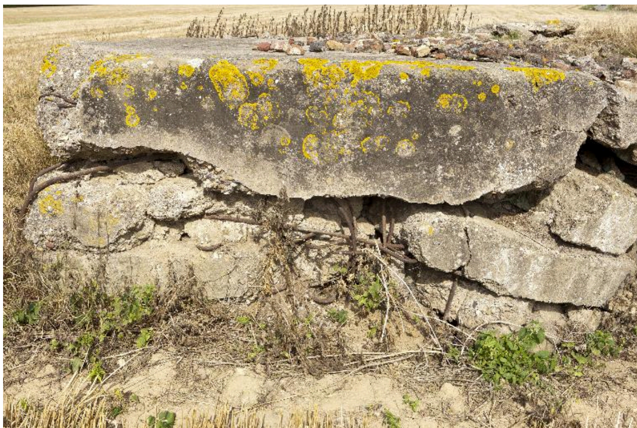
Elévation sud, détail