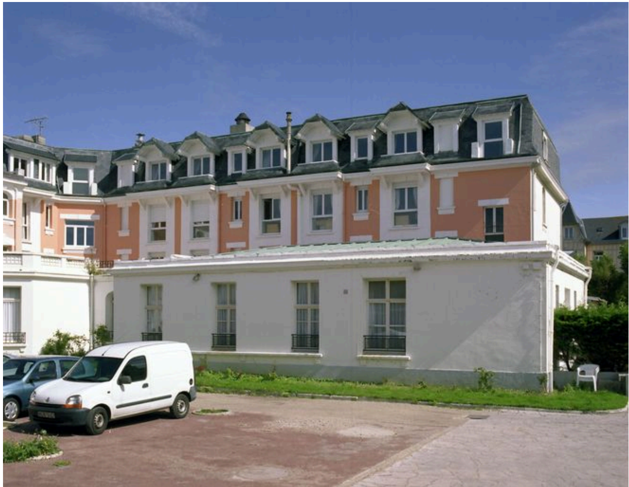
Corps de logis donnant sur la rue Eugène-Trigoulet, élévation postérieure.