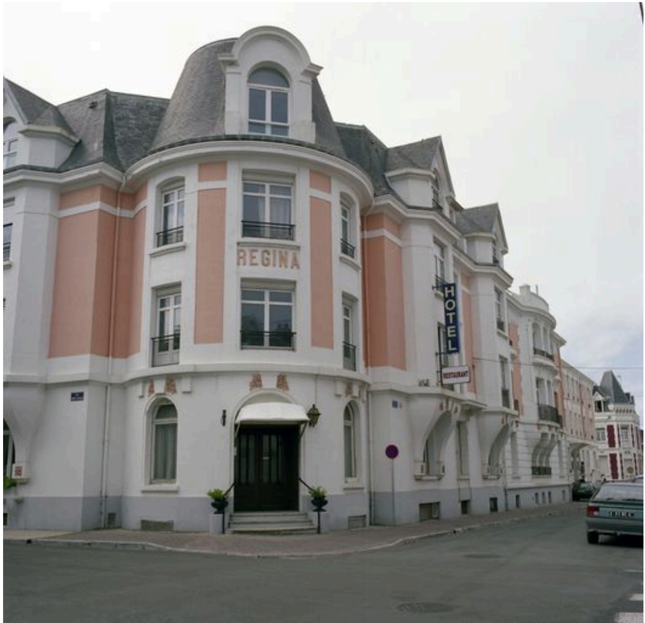
Elévations sur les rues de Lhomel et Eugène-Trigoulet, vue angulaire montrant l'enfilade des façades donnant sur la rue de Lhomel.