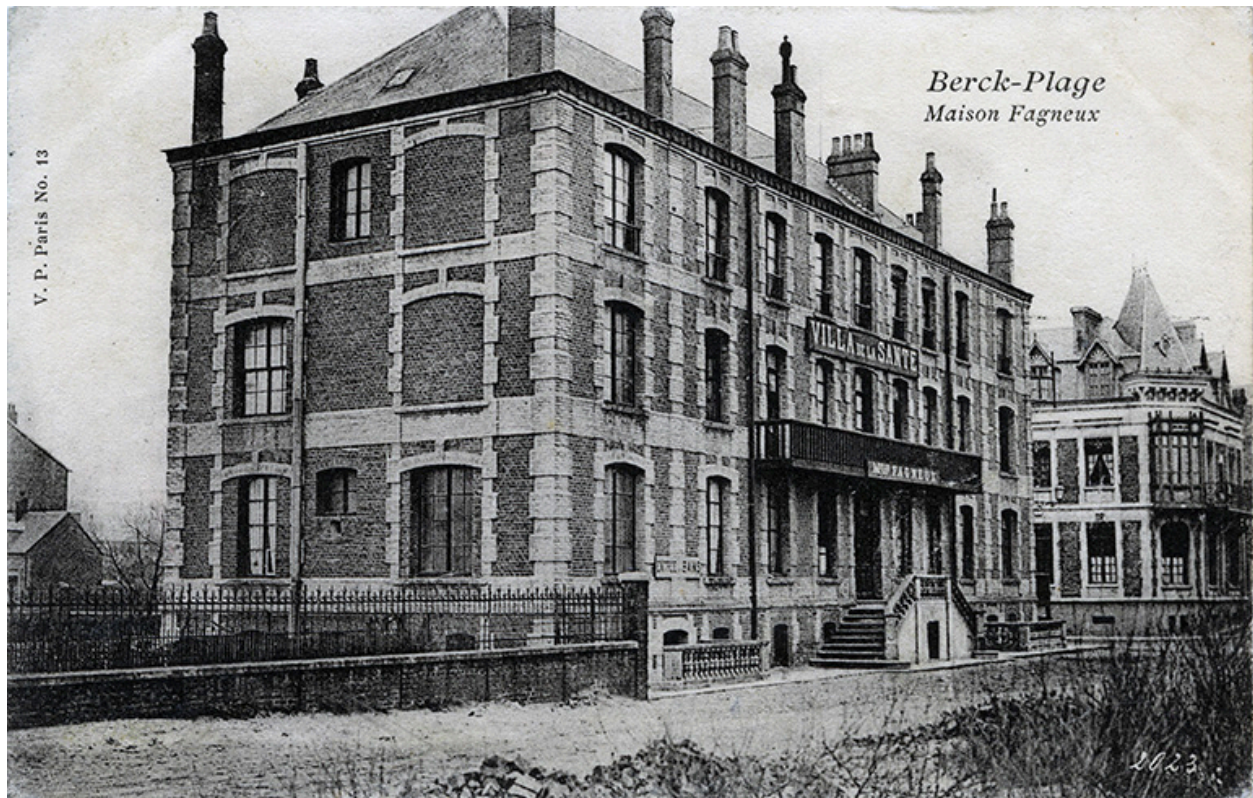
Elévation antérieure donnant sur la rue de Lhomel avant adjonction d'un nouveau corps de logis destiné à abriter l'hôtel Régina, vue générale prise de trois-quarts gauche.