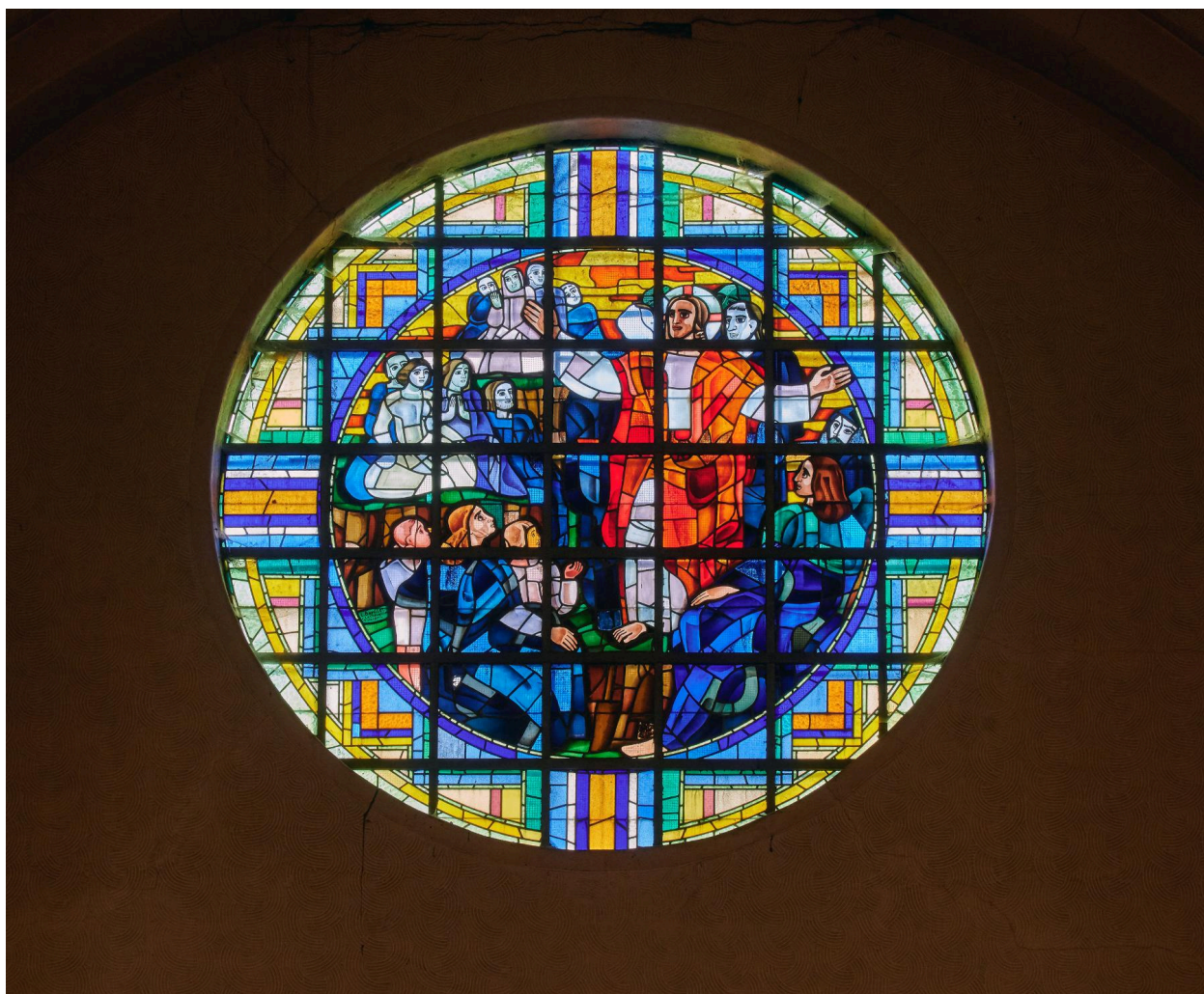
Baie 105 : verrière figurée. Jésus et les enfants.