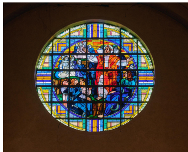
Baie 105 : verrière figurée. Jésus et les enfants. IVR32_20226200211NUCA