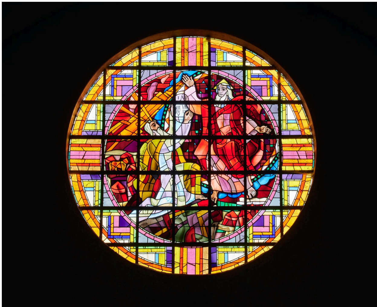
Baie 106 : verrière figurée. Moïse.