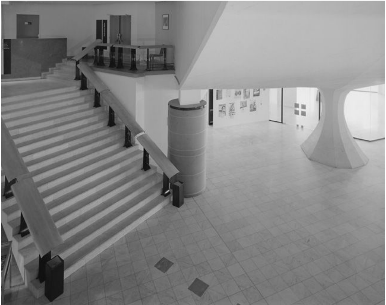
Vue du hall du rez-de-chaussée et du grand escalier.