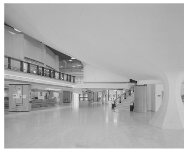
Vue du hall du rez-de-chaussée.