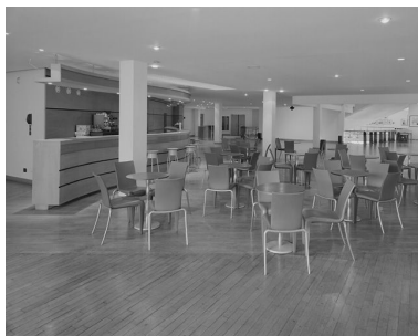
Vue de la cafétéria et du hall du premier étage. IVR22_19978000831V