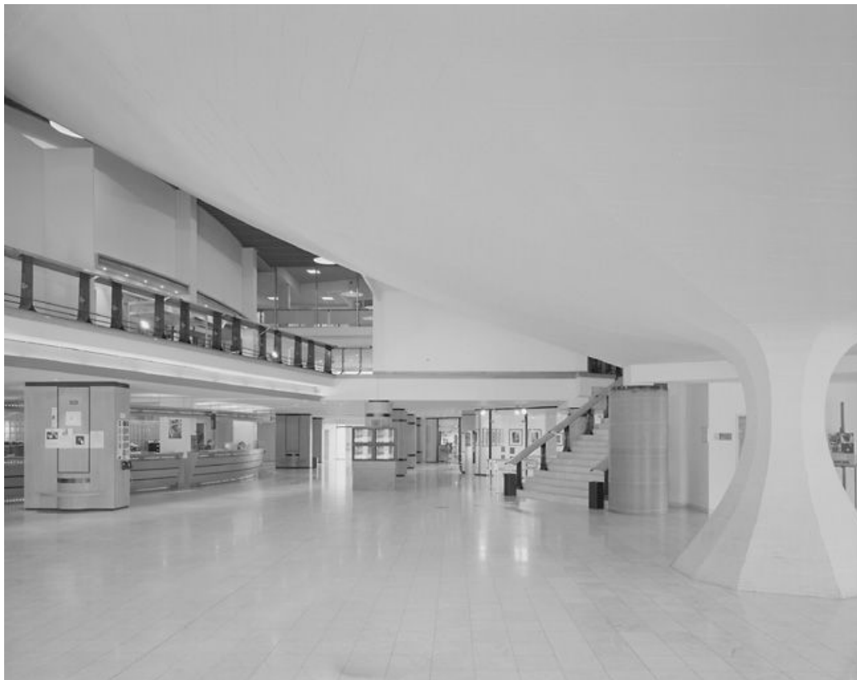
Vue du hall du rez-de-chaussée.