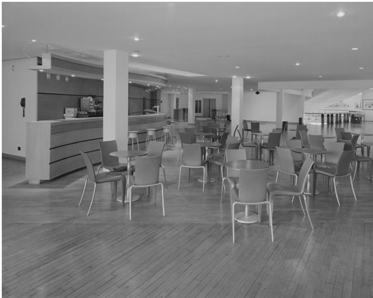
Vue de la cafétéria et du hall du premier étage.