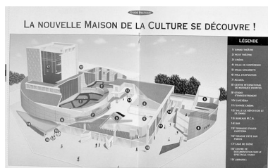
Vue axonométrique.