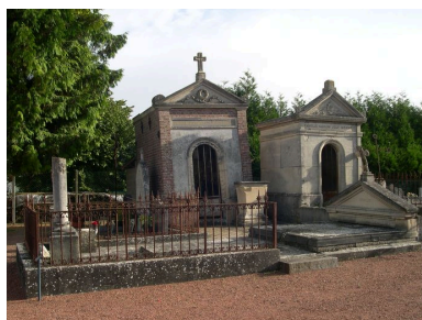
Vue générale depuis le sud-ouest, à droite le fronton du tombeau de la famille Boulenger-Bralant-Lefèvre.