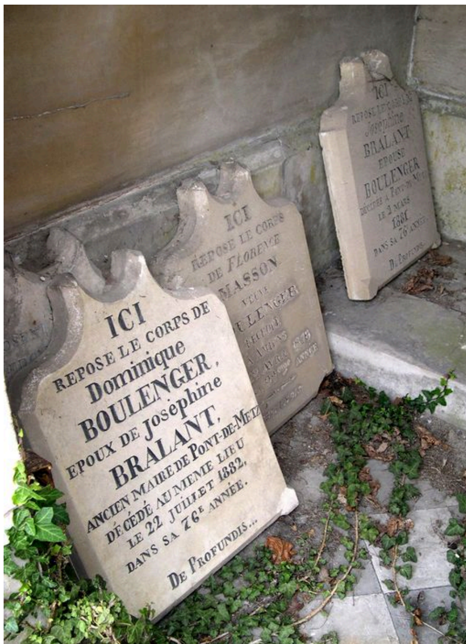
Plaques à épitaphes de l'ancien tombeau de la famille Boulenger-Bralant-Lefèvre, déposées dans le tombeau voisin.