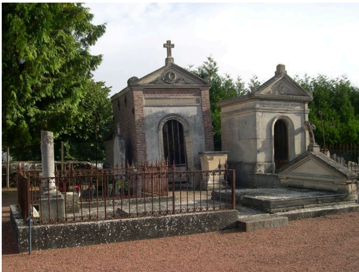
Vue générale depuis le sud-ouest, à droite le fronton du tombeau de la famille Boulenger-Bralant-Lefèvre.