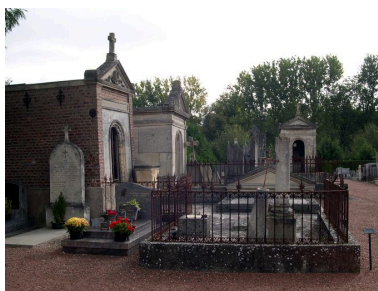
Vue générale depuis l'ouest.