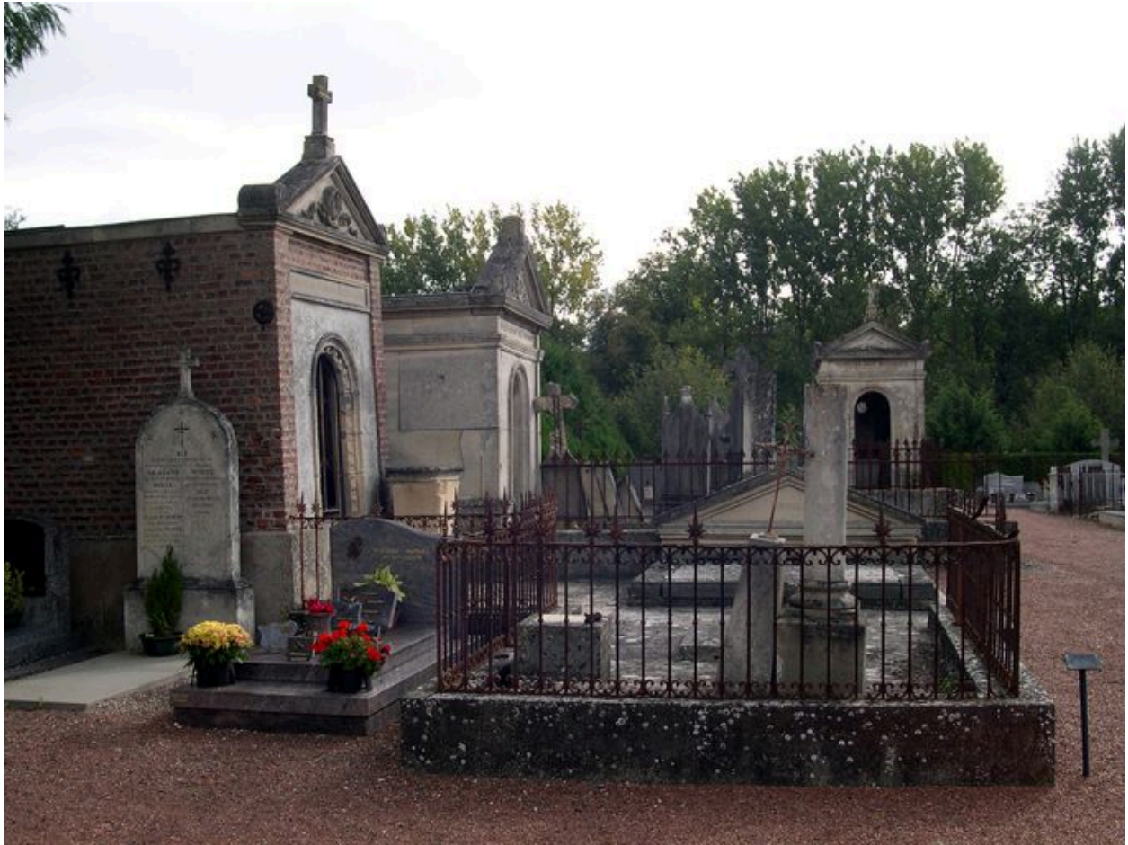
Vue générale depuis l'ouest.