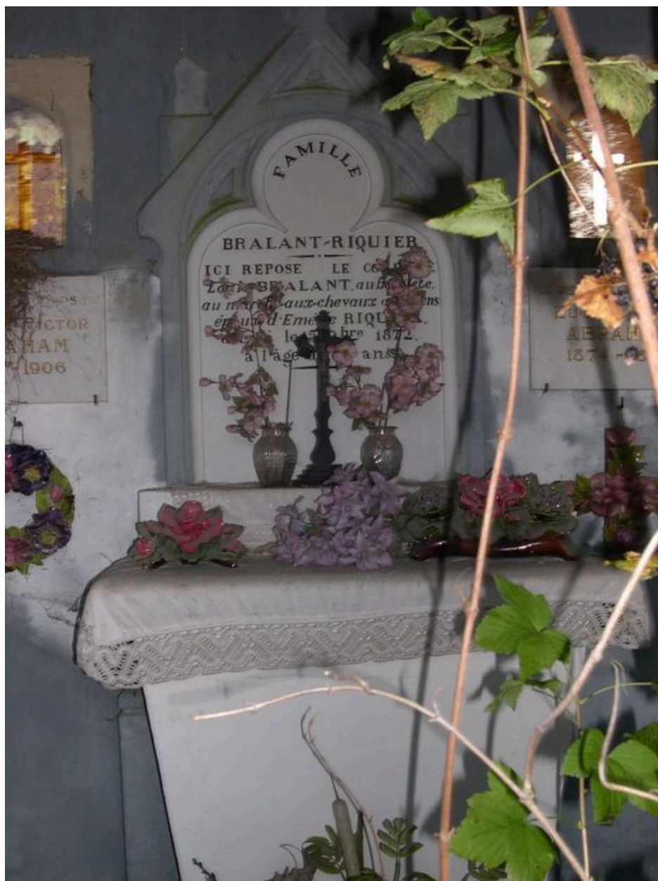
Vue de l'autel de la chapelle Bralant-Riquier.