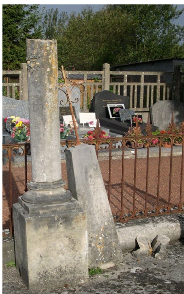
Colonne funéraire Joly, vers 1879 et stèle.