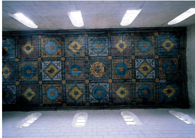
Vue générale. IVR22_19990201750PA