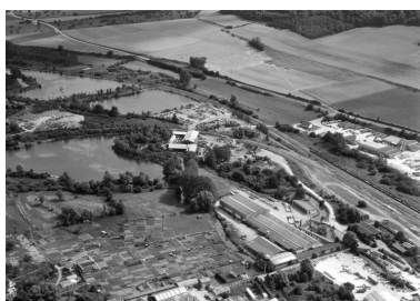
Vue aérienne, flanc ouest.