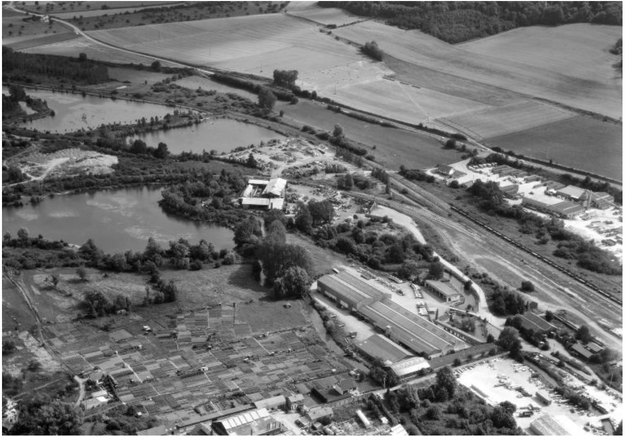
Vue aérienne, flanc ouest.