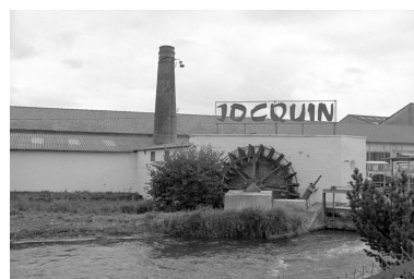
Vue partielle.