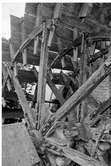
Roue hydraulique.