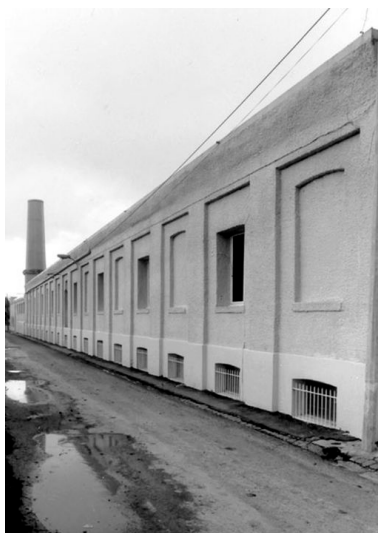
Vue partielle, élévation ouest.