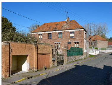
Vue de l'élévation sud. IVR32_20236200321NUCA

IVR32_20236200415NUCA