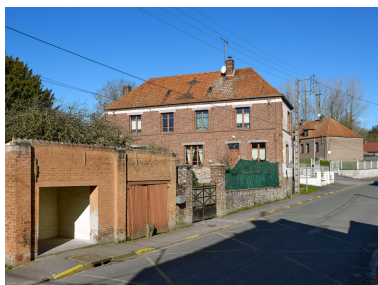
Vue de l'élévation sud.