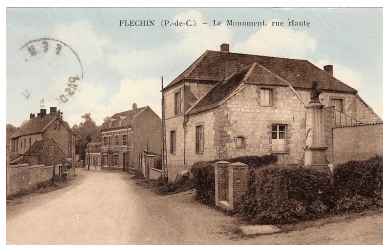
Fléchin (Pas-de-Calais) : le monument aux morts et le presbytère. Carte postale, photographe inconnu, [s.ed.], [ca 1930] (coll. part.).

Repro. Sophie Léger IVR32_20236200415NUCA