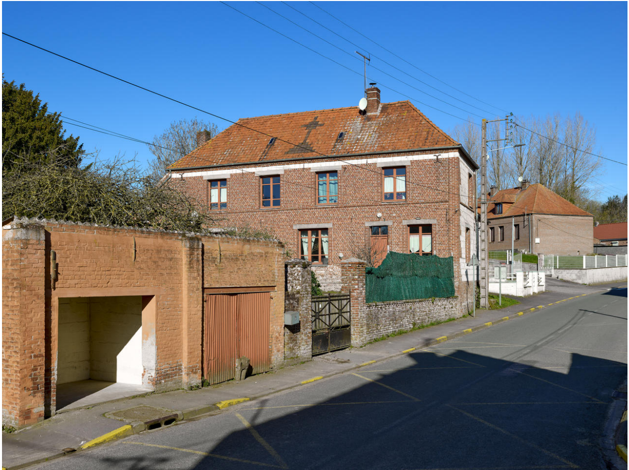
Vue de l'élévation sud.