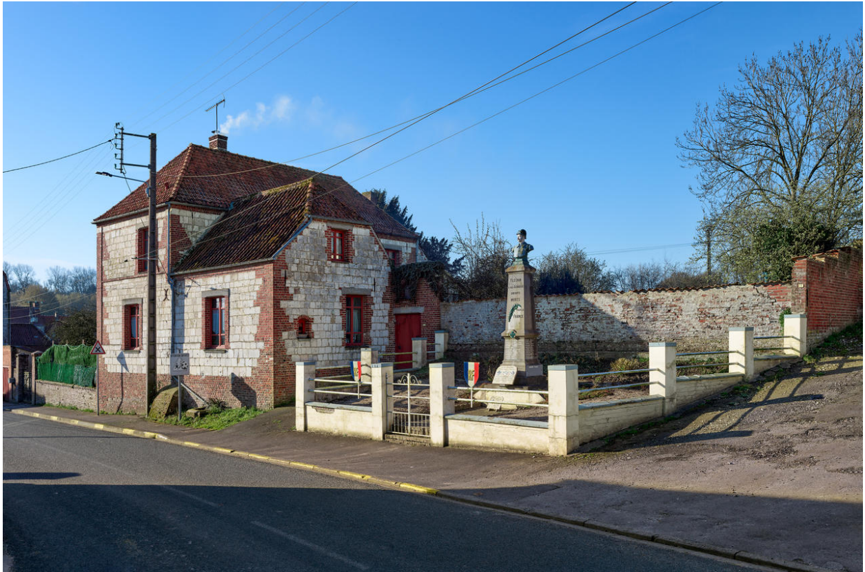
Vue de l'élévation nord.