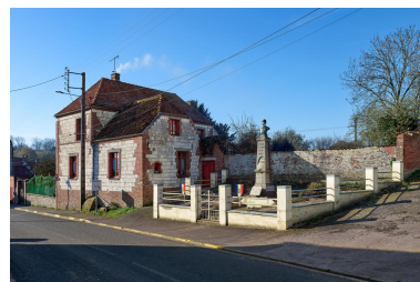
Vue de l'élévation nord. IVR32_20236200322NUCA