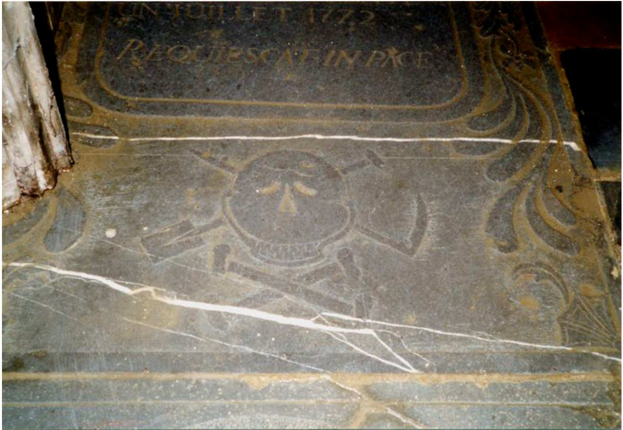
Partie inférieure de la dalle.