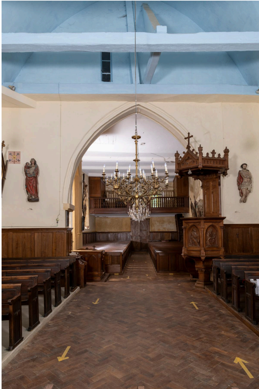
Vue intérieure vers la nef.