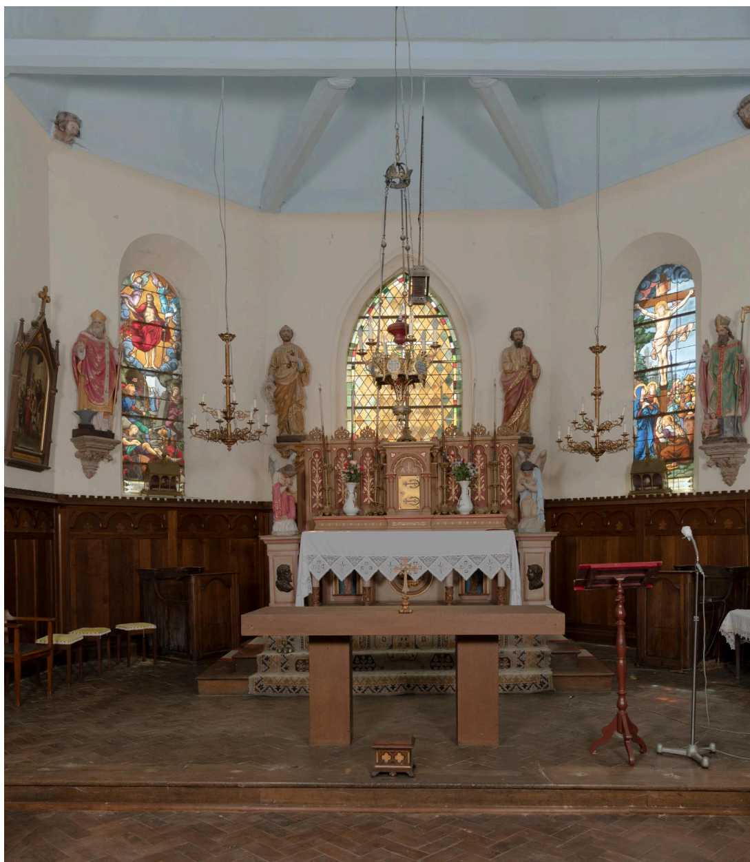
Vue générale du sanctuaire.