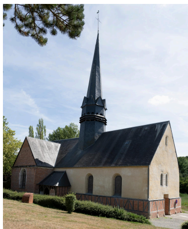
Vue depuis le nord-ouest. IVR32_20226000793NUCA