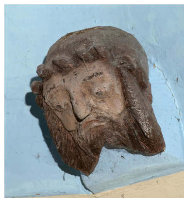
Blochet sculpté de la charpente : tête d'homme. IVR32_20226000773NUCA