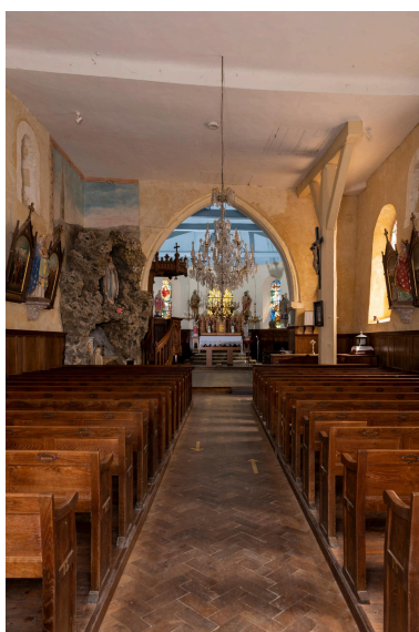
Vue intérieure vers le chœur. IVR32_20226000789NUCA