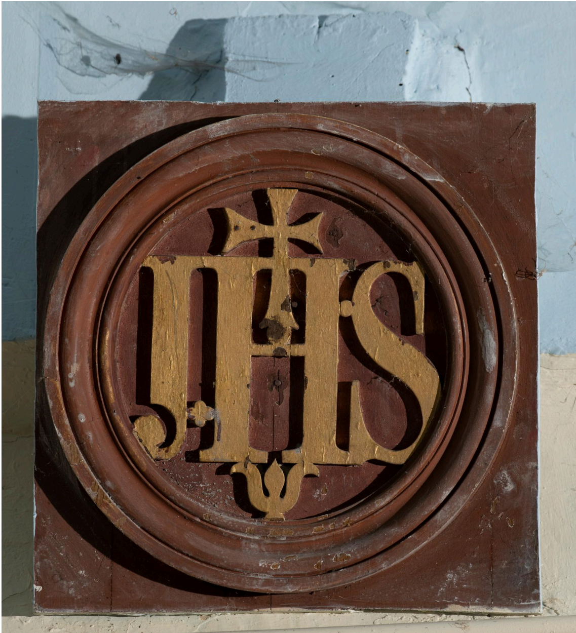
Blochet sculpté : abréviation "IHS" (du nom de Jésus en grec ancien).