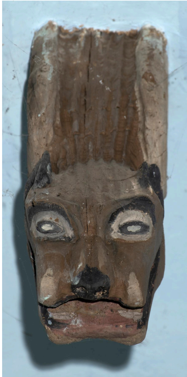
Blochet sculpté de la charpente : monstre.