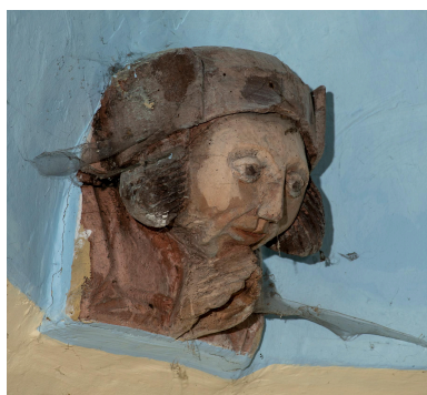
Blochet sculpté de la charpente : tête d'homme. IVR32_20226000771NUCA