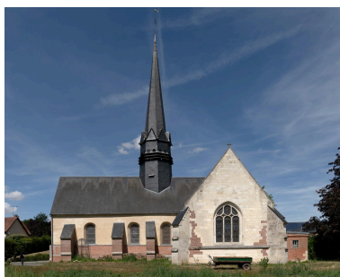
Élévation sud. IVR32_20226000792NUCA