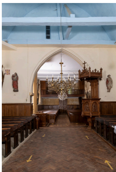
Vue intérieure vers la nef. IVR32_20226000790NUCA