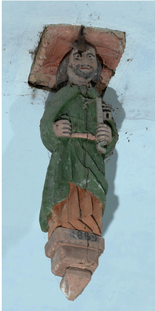
Blochets sculptés de la charpente : figure en pied avec date "1889".