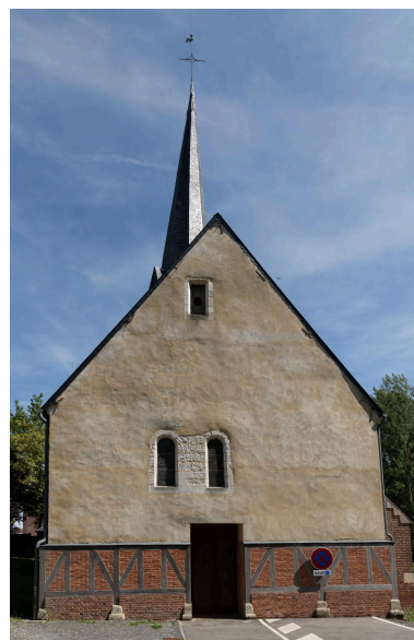
Façade occidentale. IVR32_20226000791NUCA