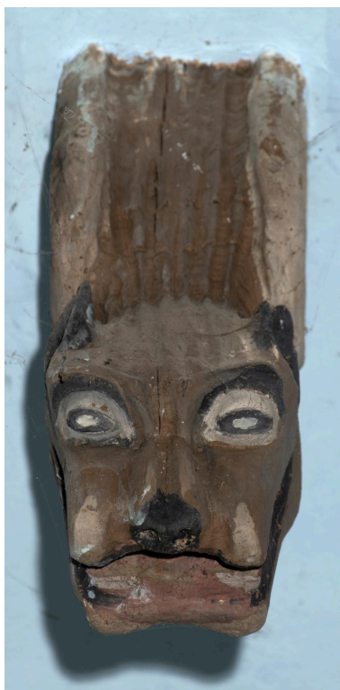
Blochet sculpté de la charpente : monstre.