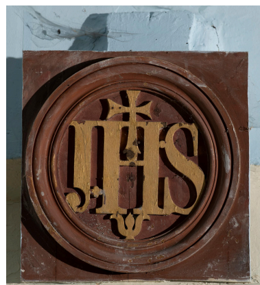
Blochet sculpté : abréviation "IHS" (du nom de Jésus en grec ancien). IVR32_20226000777NUCA