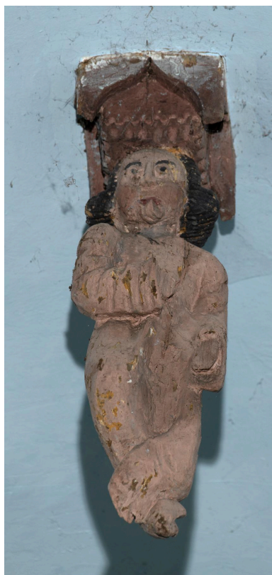
Blochet sculpté de la charpente : figure en pied.