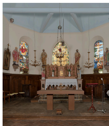
Vue générale du sanctuaire.