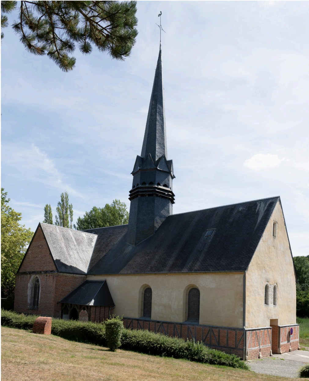
Vue depuis le nord-ouest.