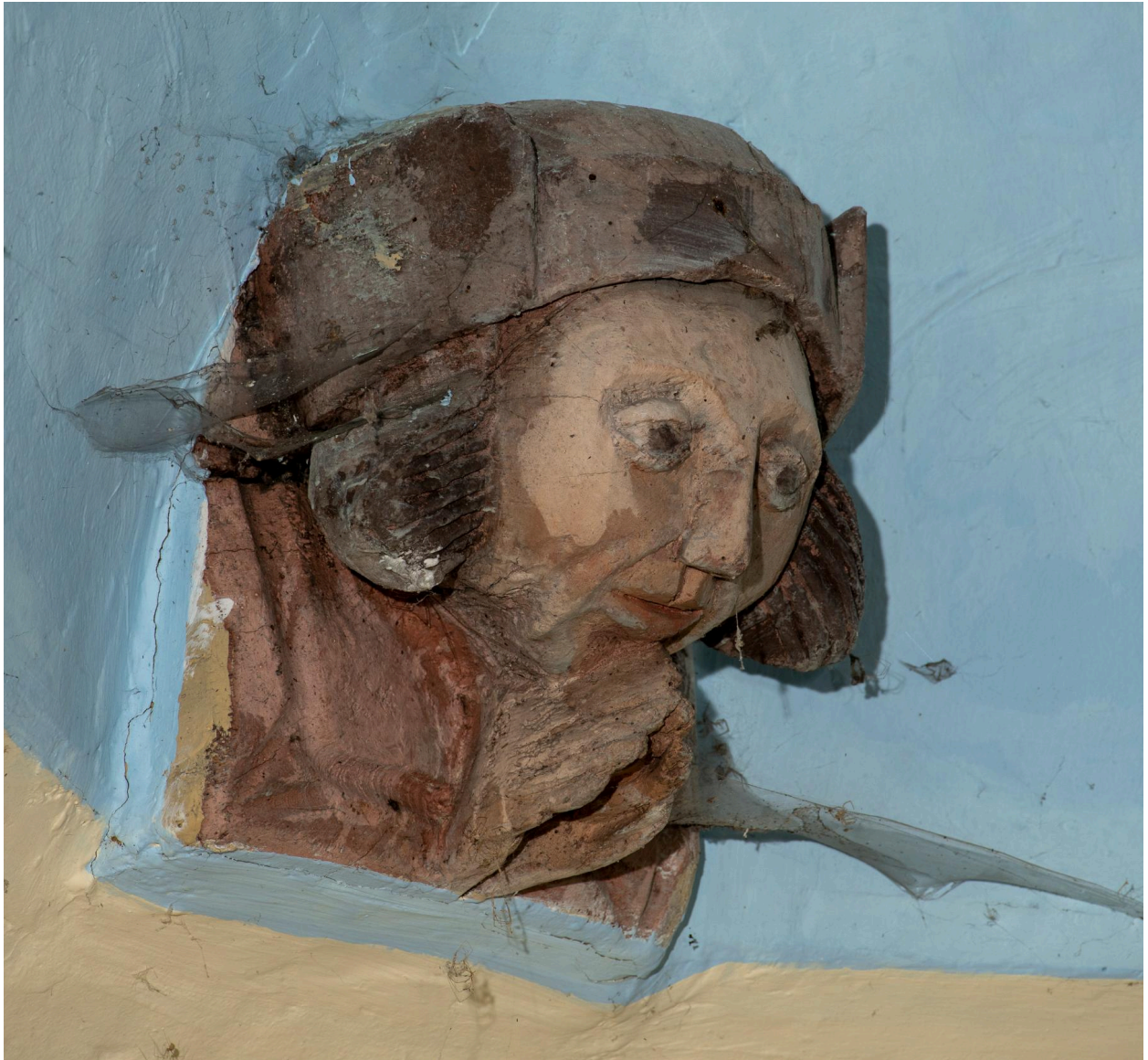
Blochet sculpté de la charpente : tête d'homme.