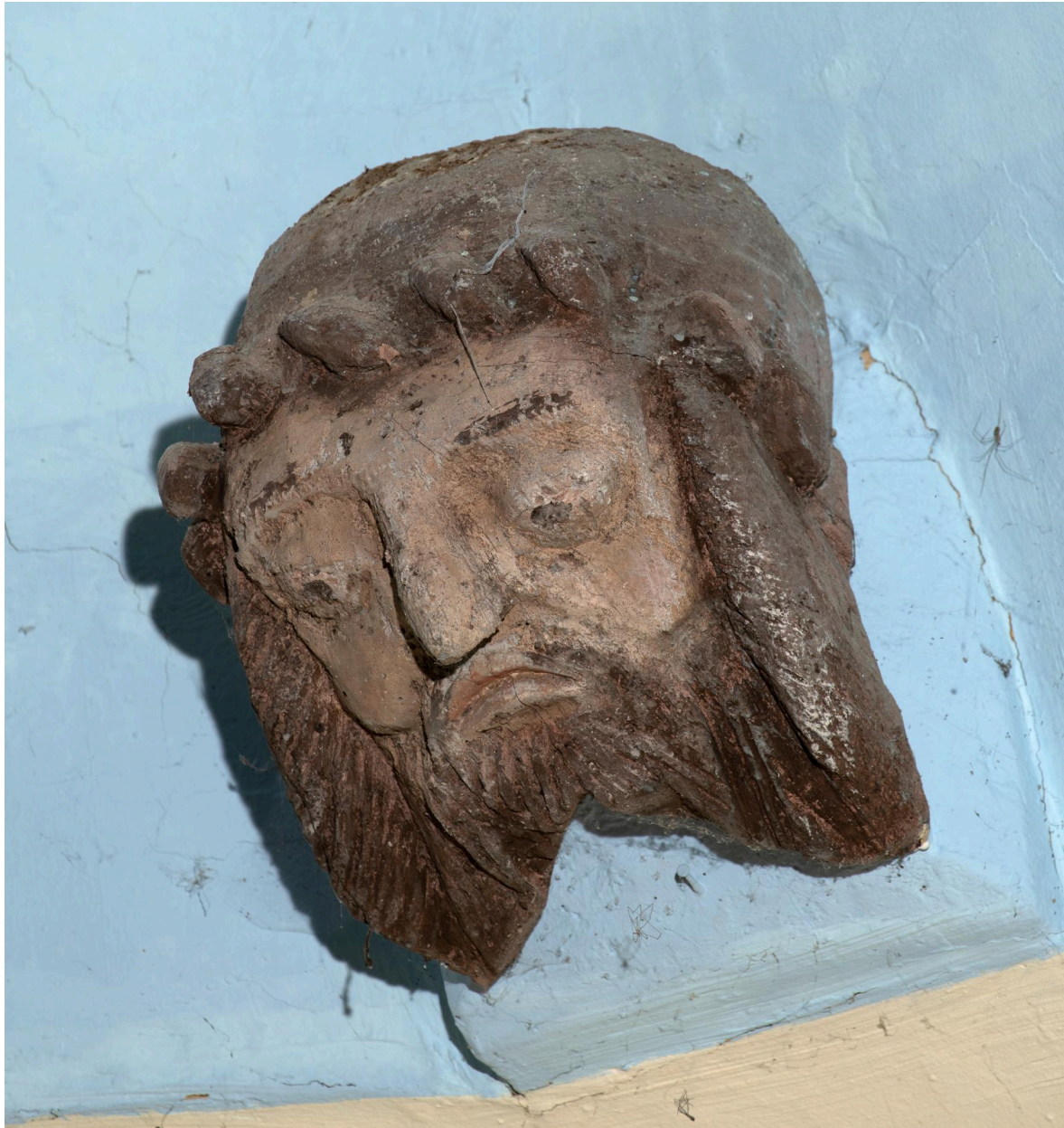
Blochet sculpté de la charpente : tête d'homme.