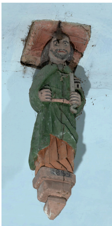
Blochet sculpté de la charpente : figure en pied avec date "1889".