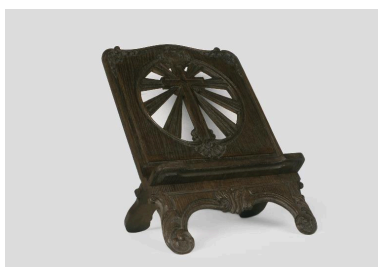
Vue du pupitre d'autel.