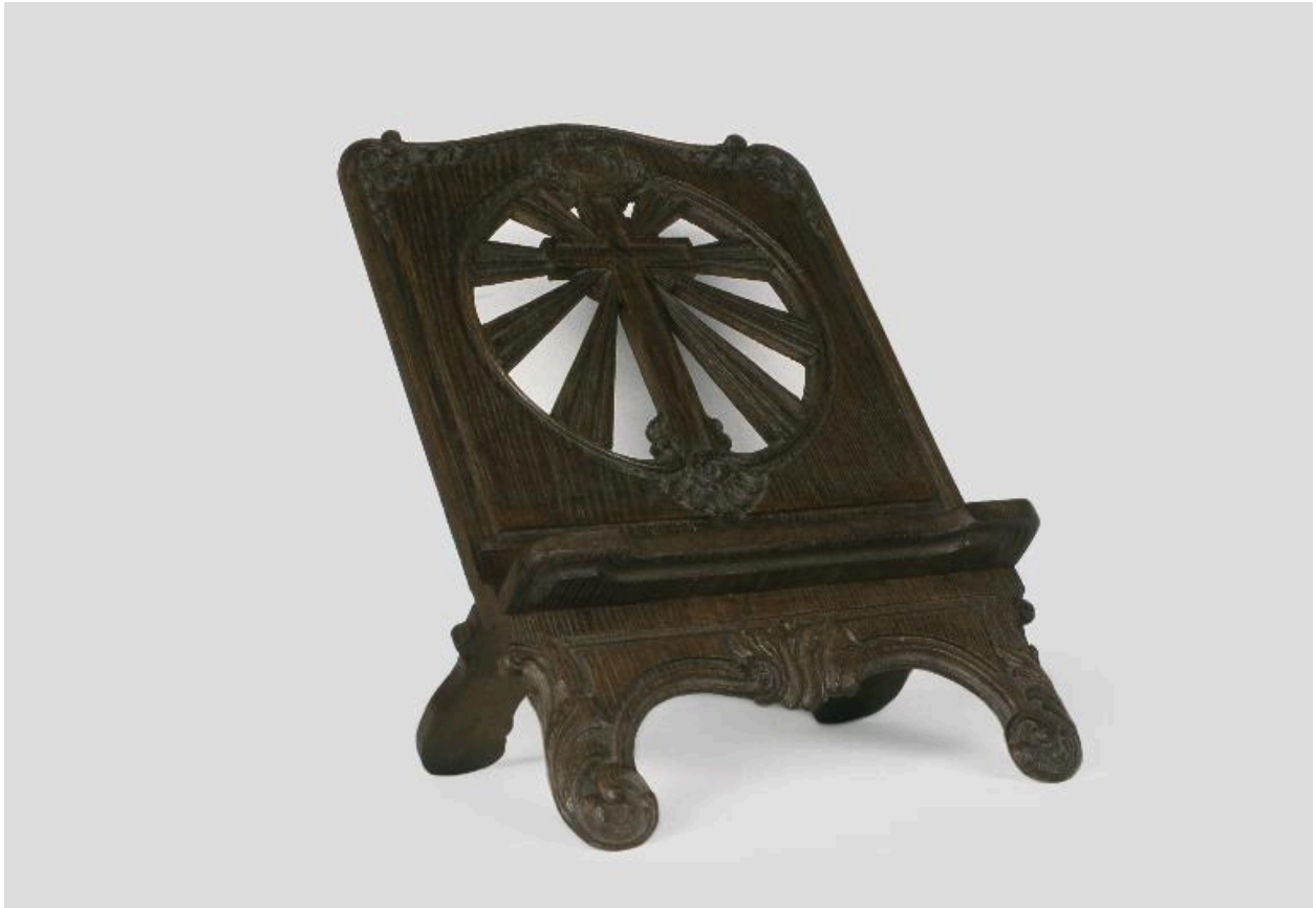
Vue du pupitre d'autel.