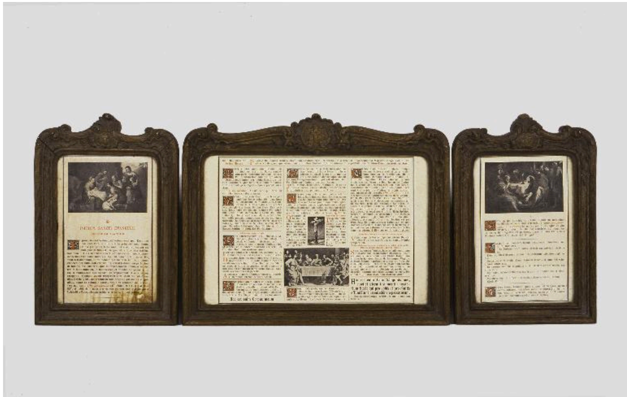
Vue des canons d'autel.