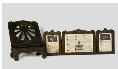
Vue de l'ensemble. IVR22_20010202303ZA