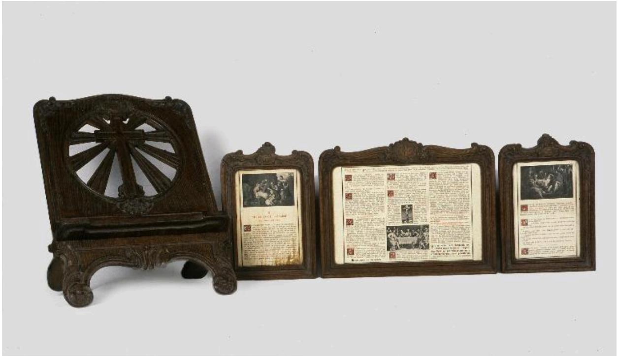
Vue de l'ensemble.