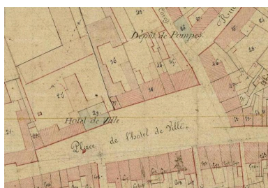
Extrait du cadastre de 1826 (AD Somme ; 3 P 2011/3).

IVR22_20158006207NUCA