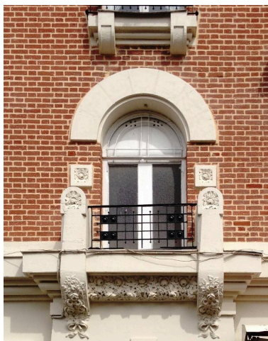
Détail d'une baie de la façade sur rue.

IVR22_20158000619NUC2A