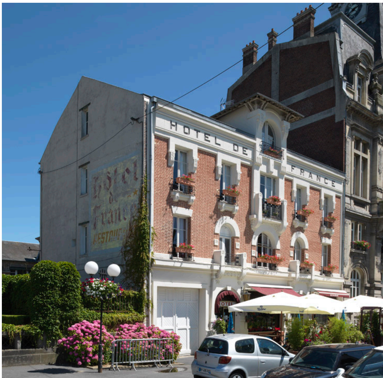
Vue de situation depuis le sud.