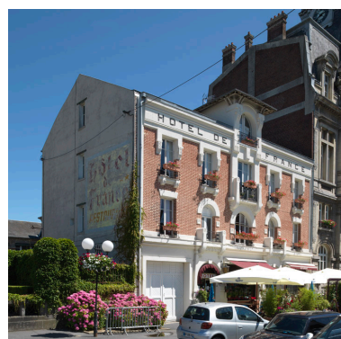
Vue de situation depuis le sud.