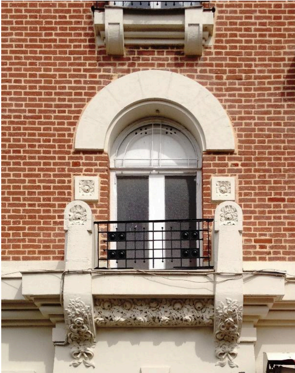
Détail d'une baie de la façade sur rue.