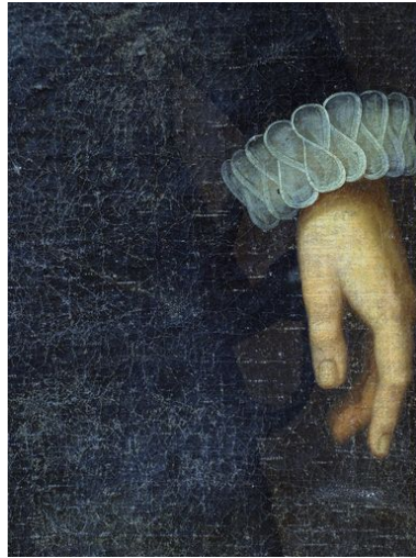
Vue de détail, bras gauche IVR31_20106201733NUCA