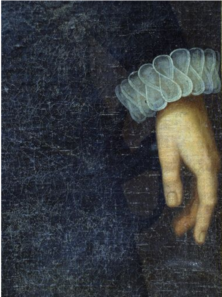
Vue de détail, bras gauche