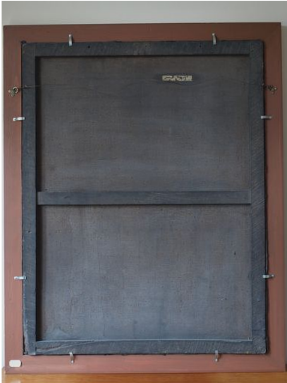
Revers du tableau