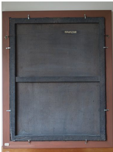
Revers du tableau