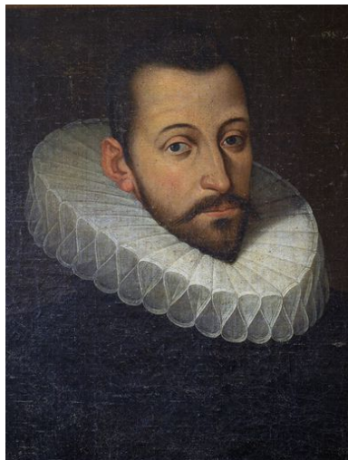
Vue partielle IVR31_20106201732NUCA