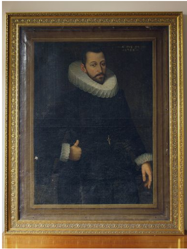
Vue générale IVR31_20106201731NUCA