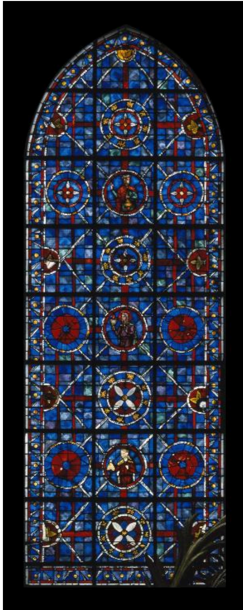
Vue générale de la verrière.