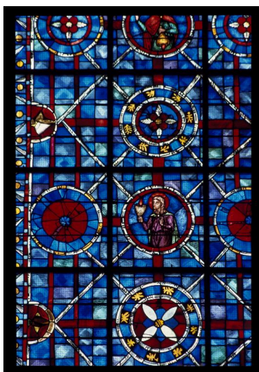
Détail de la verrière : une vierge sage (19e siècle).