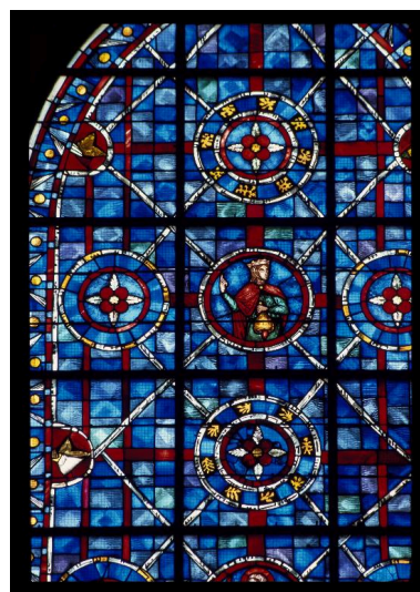
Détail de la verrière : une vierge folle (19e siècle). IVR22_20050200026ZA