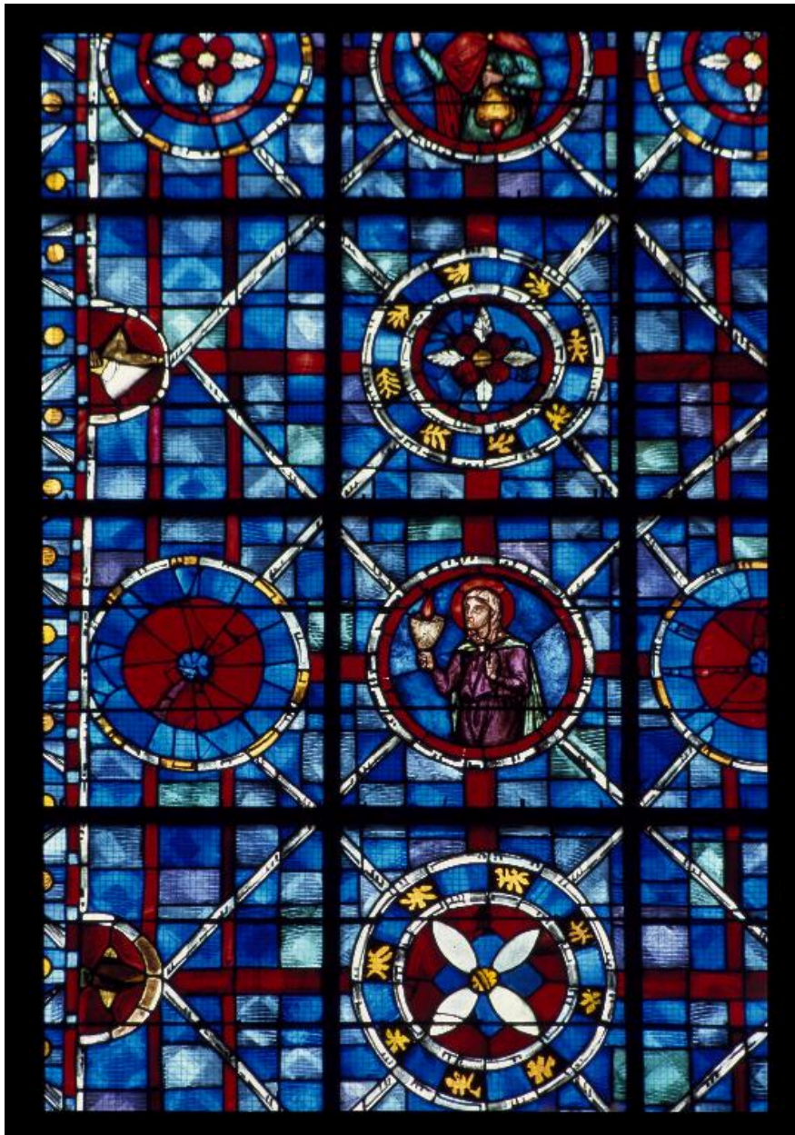
Détail de la verrière : une vierge sage (19e siècle).