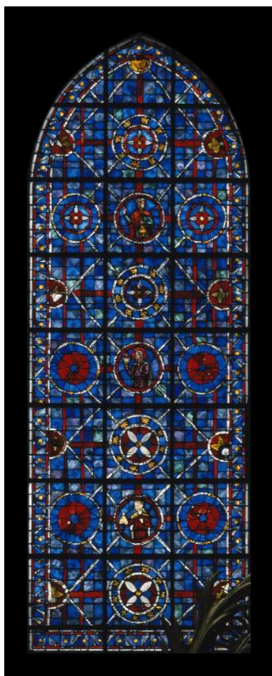
Vue générale de la verrière.