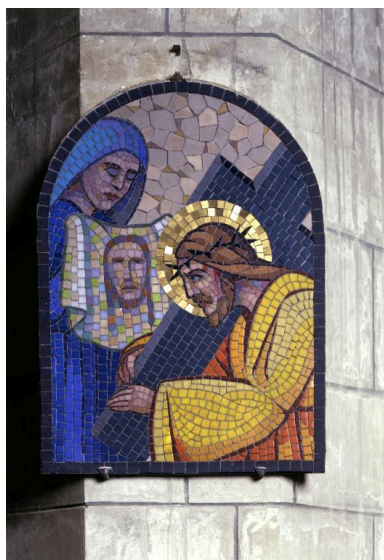
Vue de la sixième station : sainte Véronique essuie le visage de Jésus.