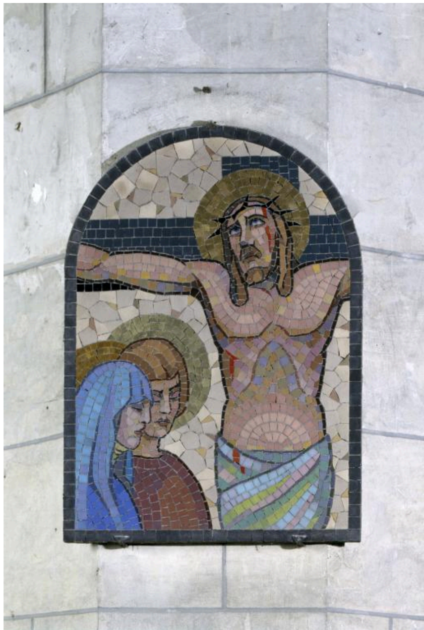
Vue de la douzième station : Jésus meurt sur la croix.