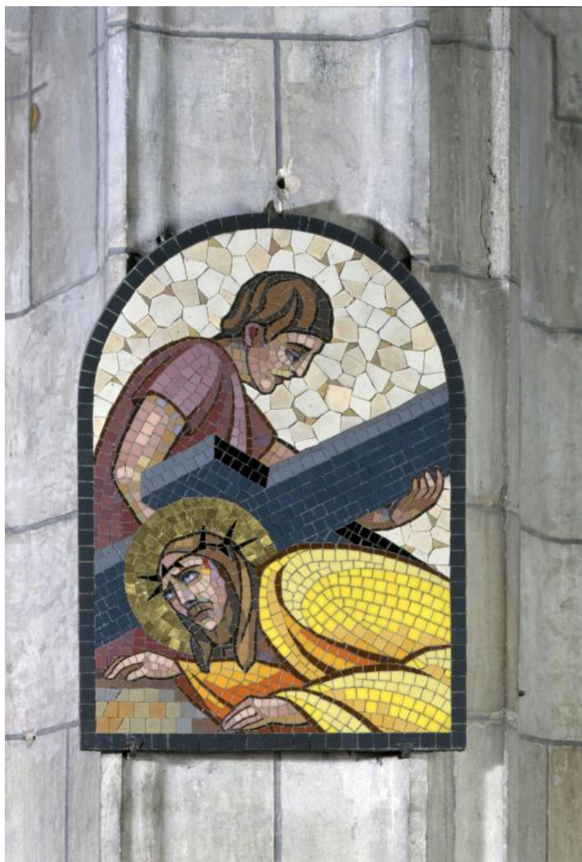
Vue de la septième station : Jésus tombe pour la deuxième fois.