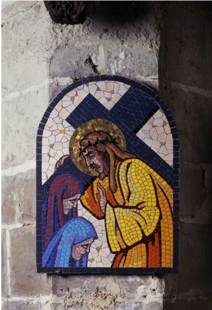
Vue de la huitième station : Jésus console les femmes de Jérusalem.