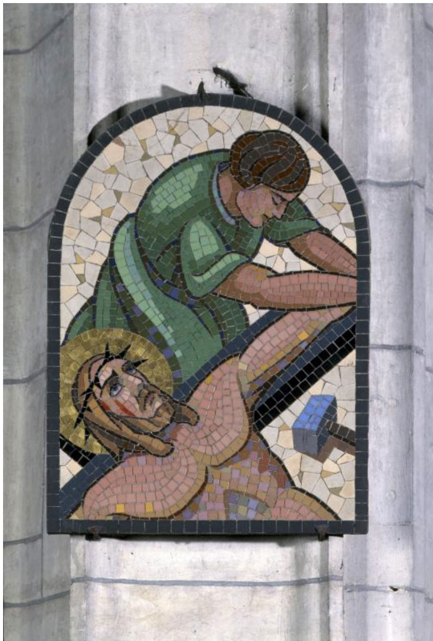
Vue de la onzième station : Jésus est cloué sur la croix.