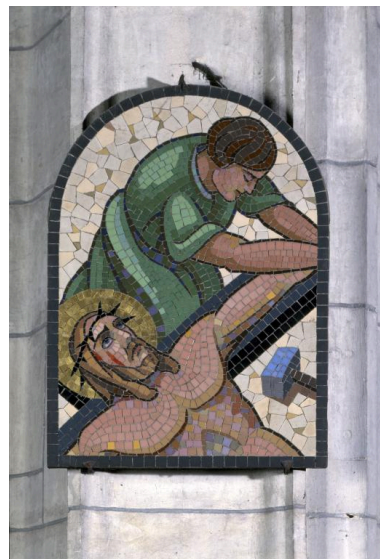
Vue de la onzième station : Jésus est cloué sur la croix.