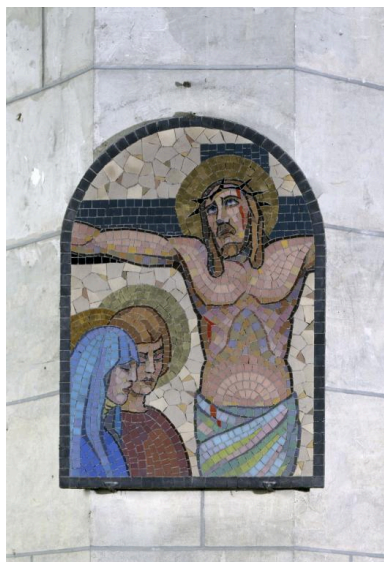
Vue de la douzième station : Jésus meurt sur la croix.