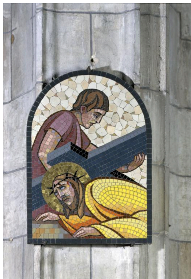
Vue de la septième station : Jésus tombe pour la deuxième fois. IVR22_19990200642XA