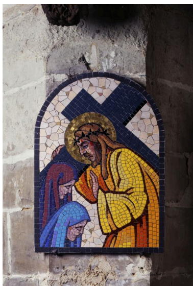
Vue de la huitième station : Jésus console les femmes de Jérusalem.