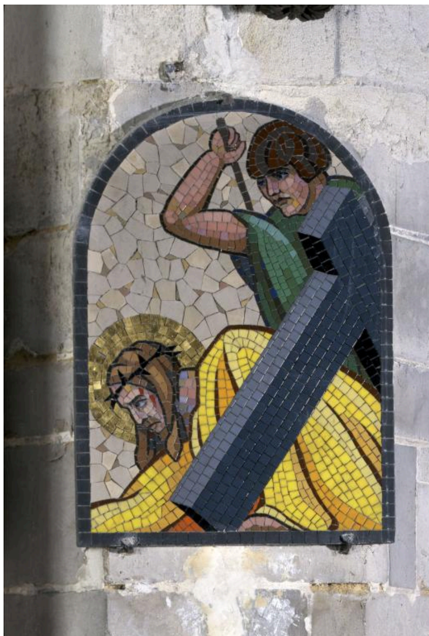
Vue de la neuvième station : Jésus tombe pour la troisième fois.