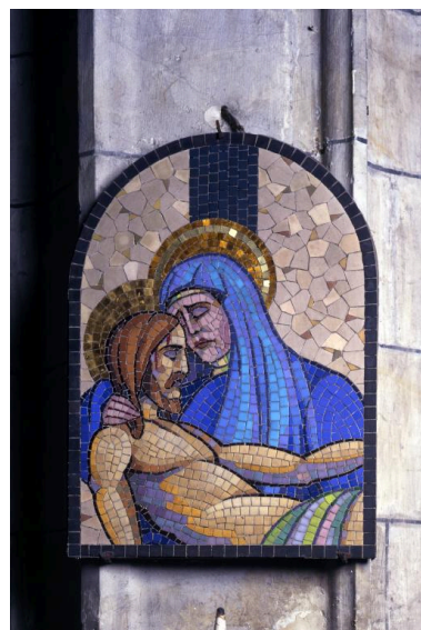
Vue de la quatorzième station : Marie pleure son fils mort.