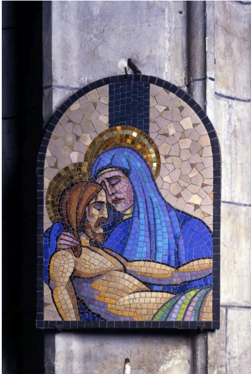
Vue de la quatorzième station : Marie pleure son fils mort.