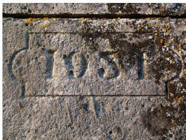
Détail d'une date gravée sur le portail : 1931.