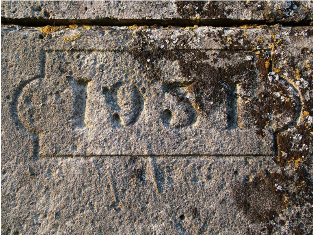
Détail d'une date gravée sur le portail : 1931.