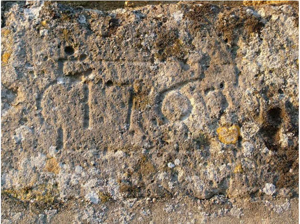
Détail d'une date gravée sur le portail : 1762.