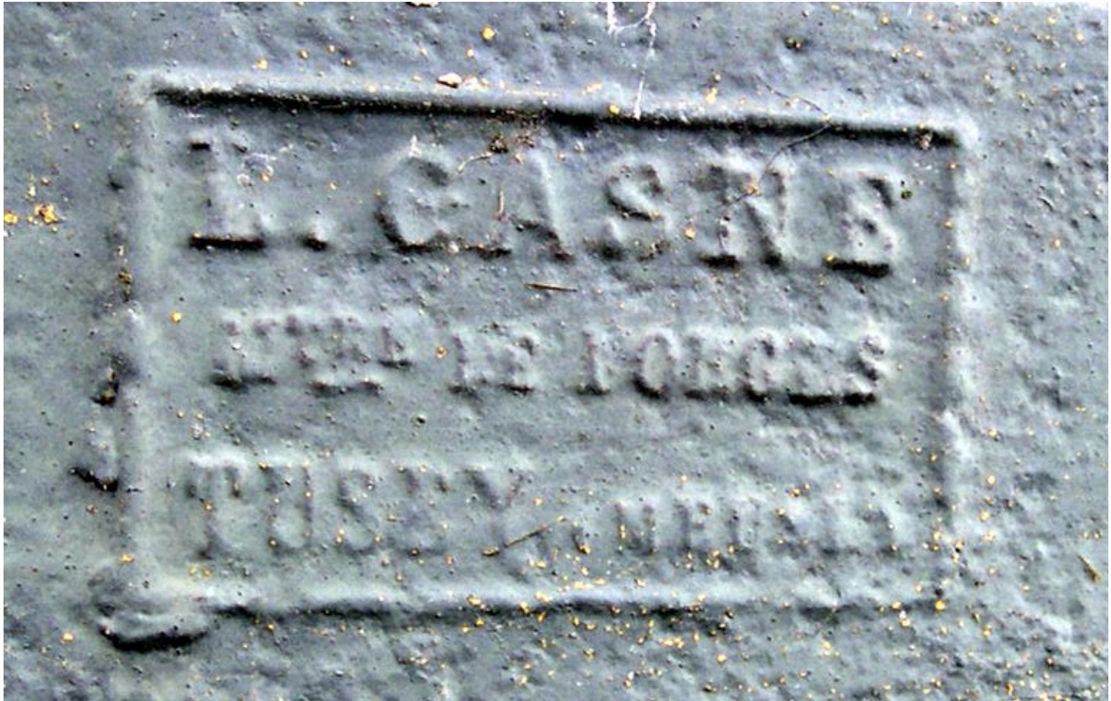
Vue de détail sur la marque de fabricant.