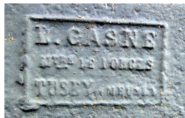
Vue de détail sur la marque de fabricant.