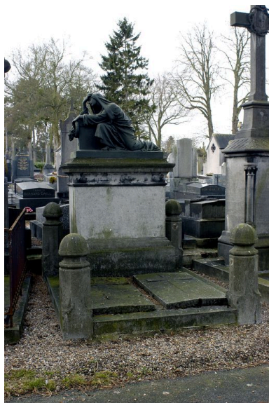
Vue générale. IVR22_20058000274NUCA