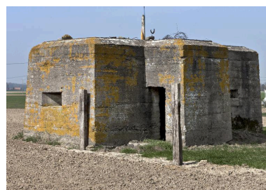
Vue vers le nord-ouest. L'entrée.