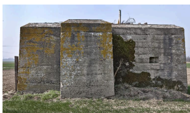
Vue vers l'ouest. Au premier plan le porche pare-suffle