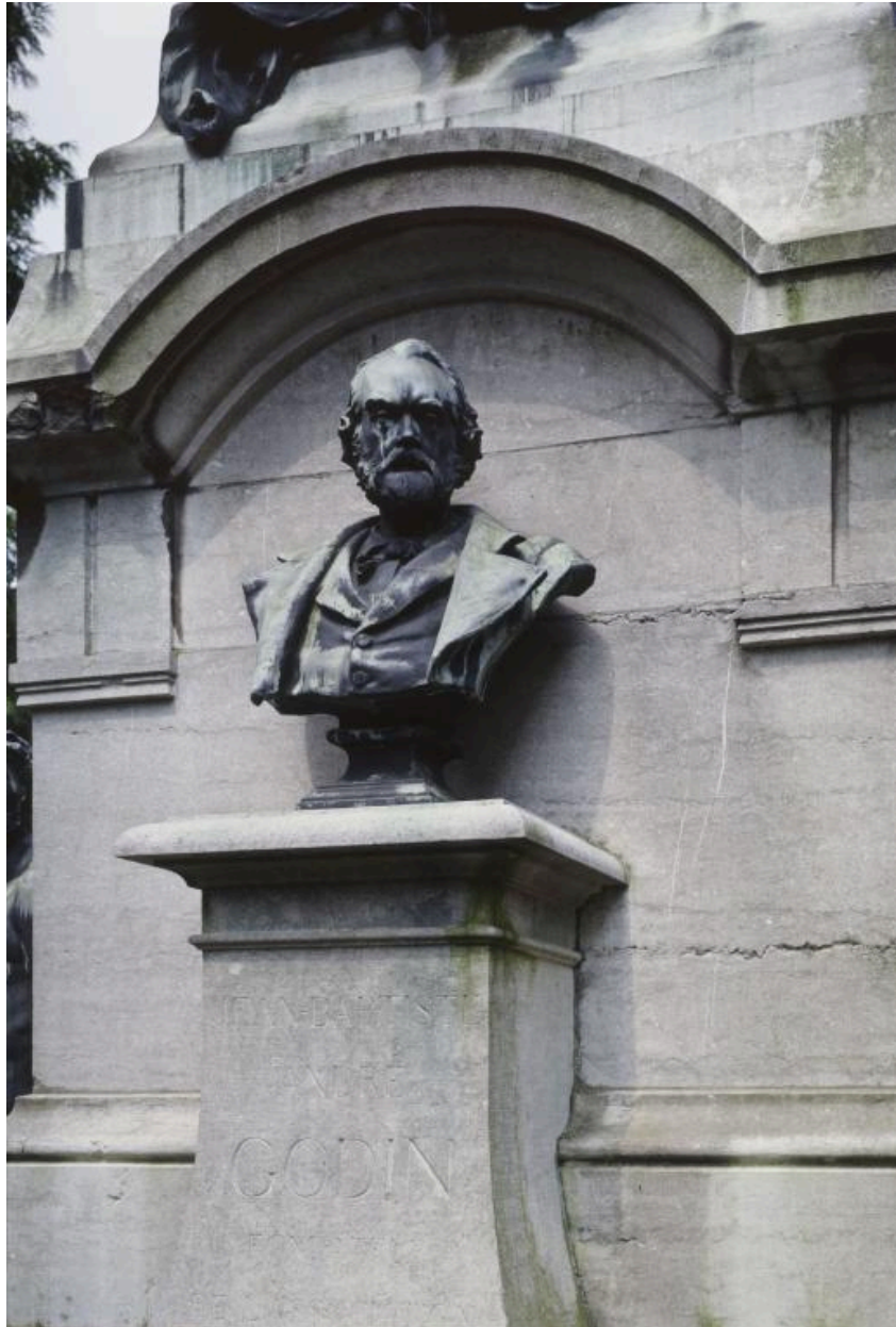
Vue du buste placé sur la face antérieure du monument.