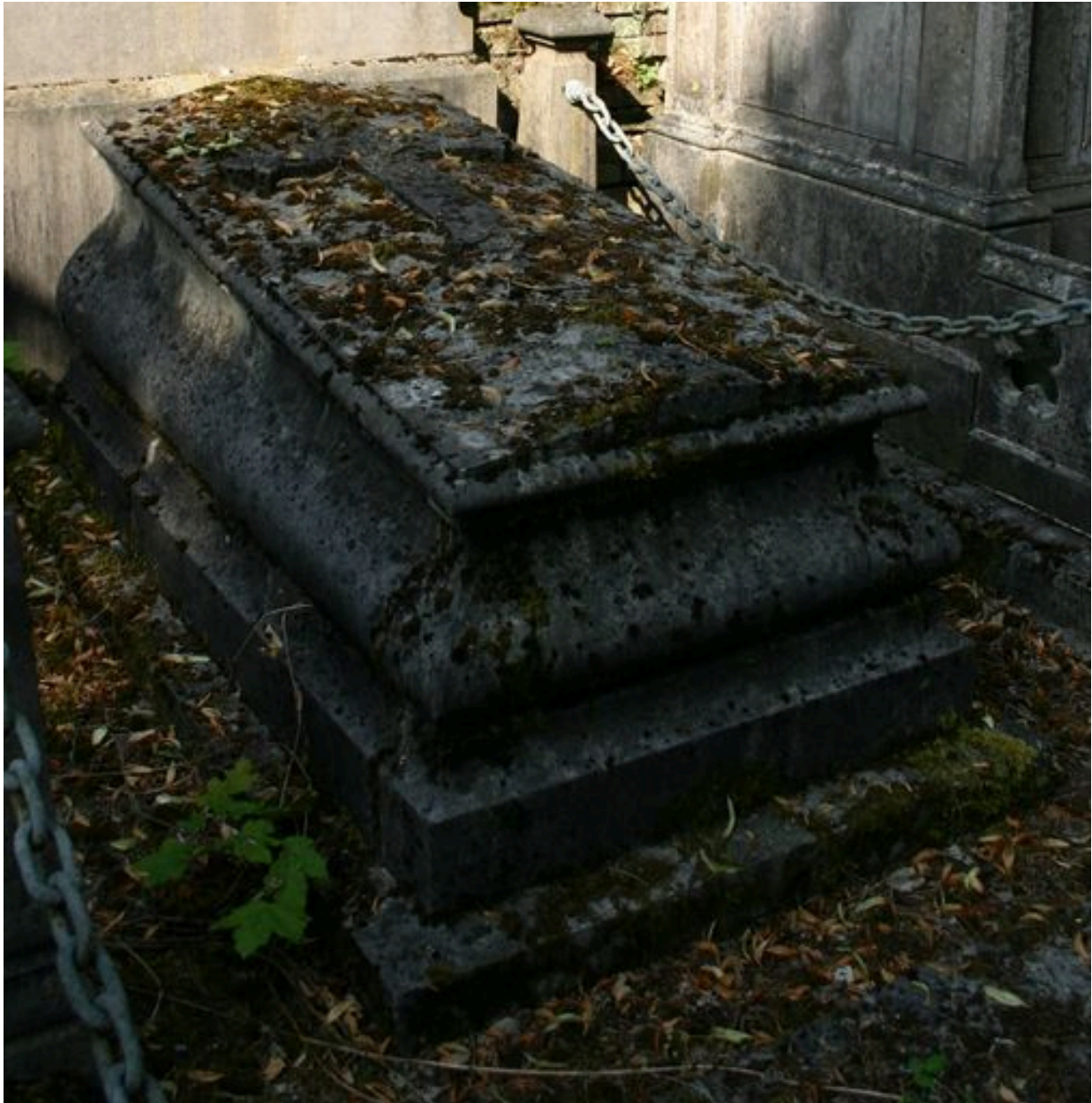
Tombeau en forme de sarcophage.