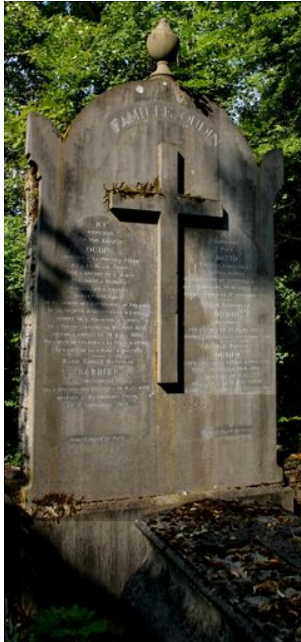
Stèle funéraire, Lesot (entrepreneur), vers 1899.