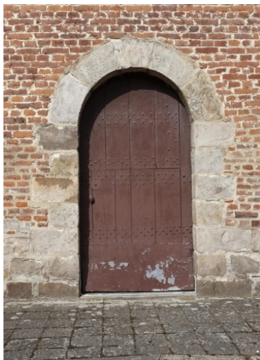
Détail de la porte du premier logis.