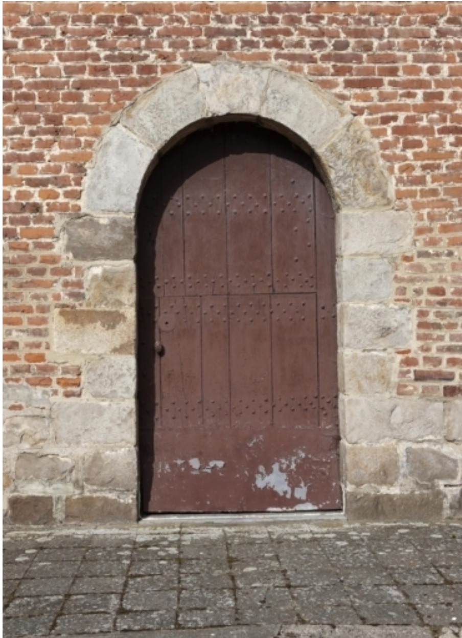
Détail de la porte du premier logis.