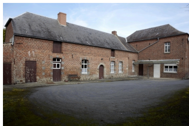
Vue générale du premier logis et du revers du logis sur rue. IVR31_20095903266NUCA