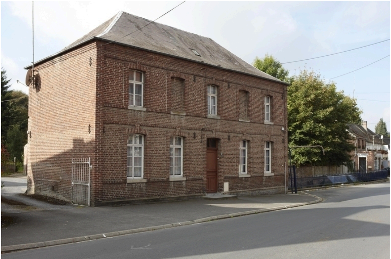
Vue du second logis, depuis la voie.