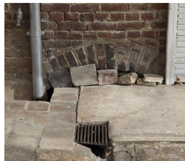
Vue de l'ouverture située sur le revers du second logis, près du cours de l'Aunelle.