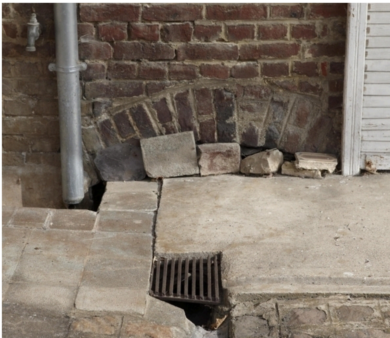
Vue de l'ouverture située sur le revers du second logis, près du cours de l'Aunelle.