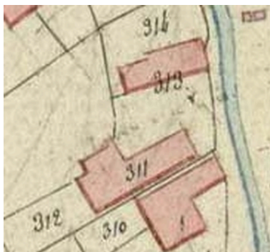
Extrait de la feuille cadastrale B1. Plan de situation en 1826.