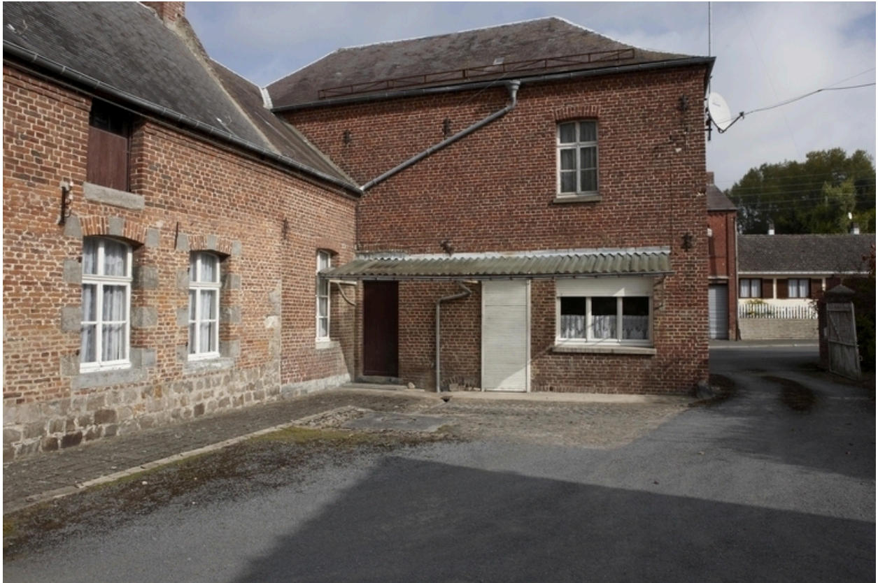
Vue du revers du second logis.