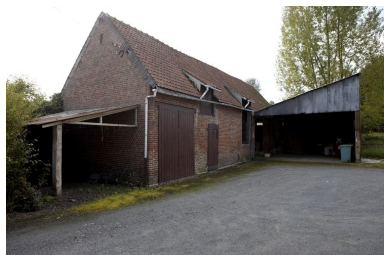
Vue du bâtiment servant à stocker les fruits. IVR31_20095903265NUCA