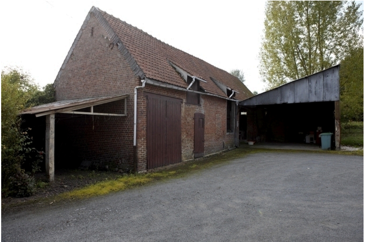
Vue du bâtiment servant à stocker les fruits.