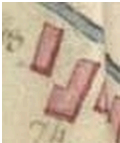
Extrait de la feuille cadastrale F. Plan de situation en 1803. IVR31_20095902614NUCA