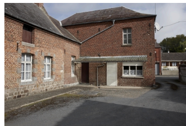
Vue du revers du second logis.