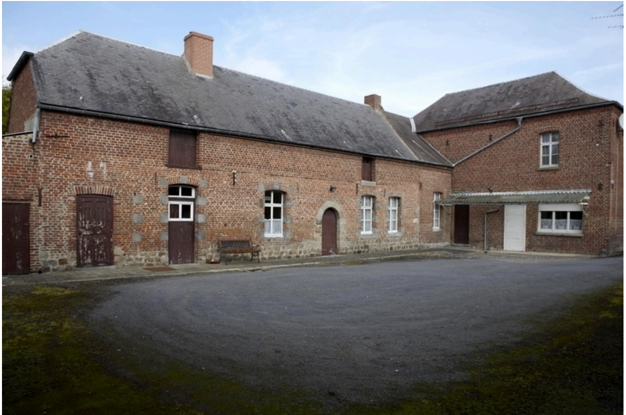
Vue générale du premier logis et du revers du logis sur rue.