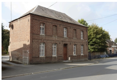
Vue du second logis, depuis la voie.