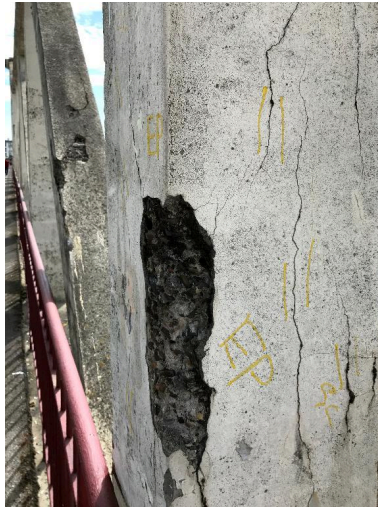
Epaufrure du béton sur l'un des supports verticaux de la passerelle.