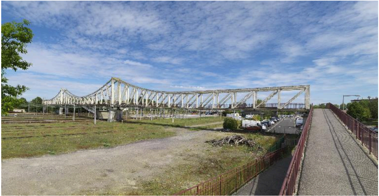
Vue générale depuis le sud.