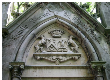
Tombeau en forme de chapelle : vue de détail sur les armoiries de la famille Dournel de Bonnival.