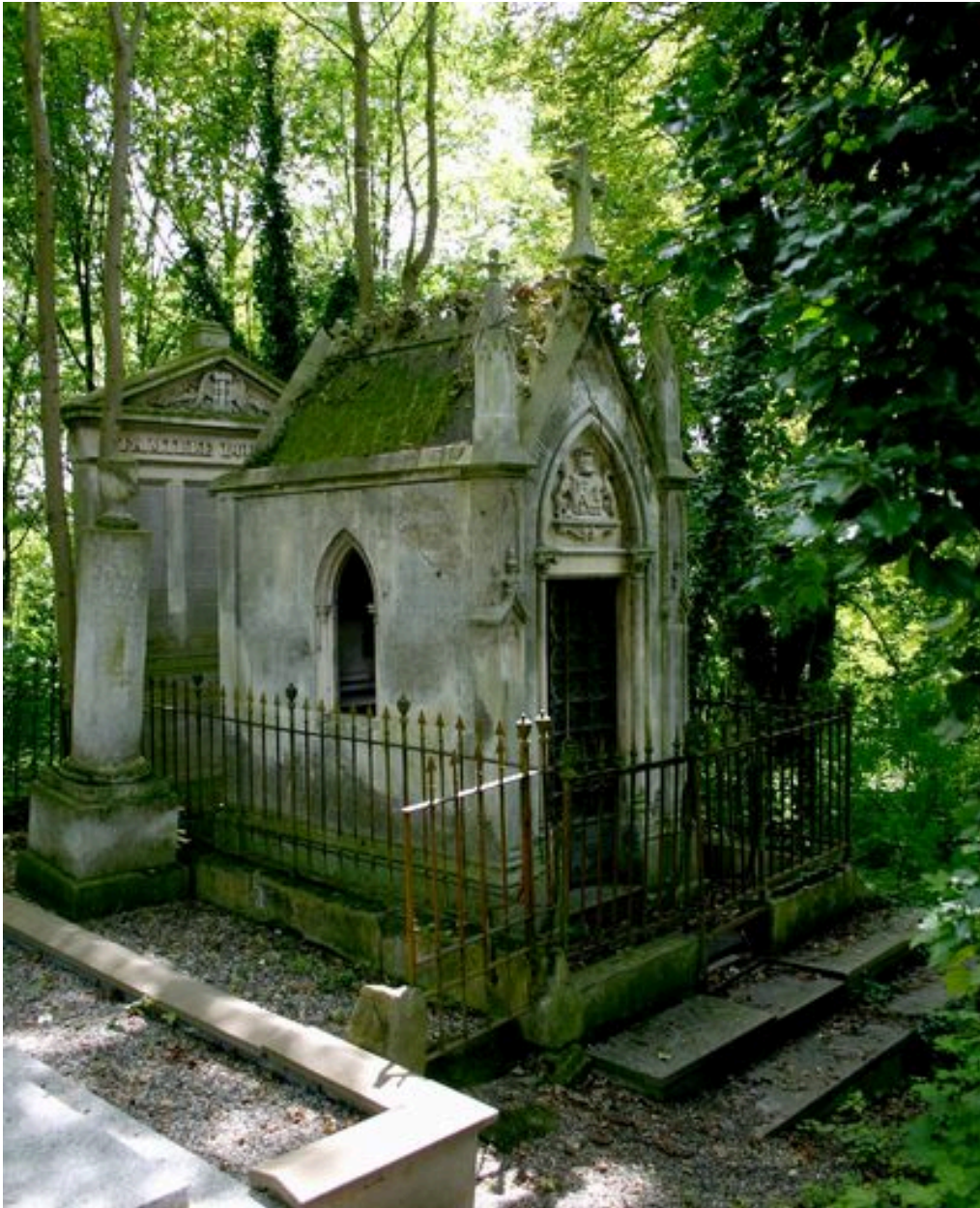
Vue générale, depuis le côté gauche.