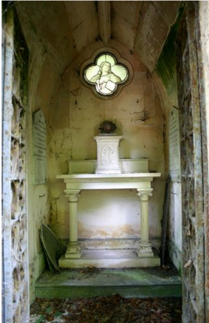
Tombeau en forme de chapelle : vue intérieure.