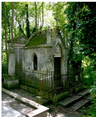
Vue générale, depuis le côté gauche.