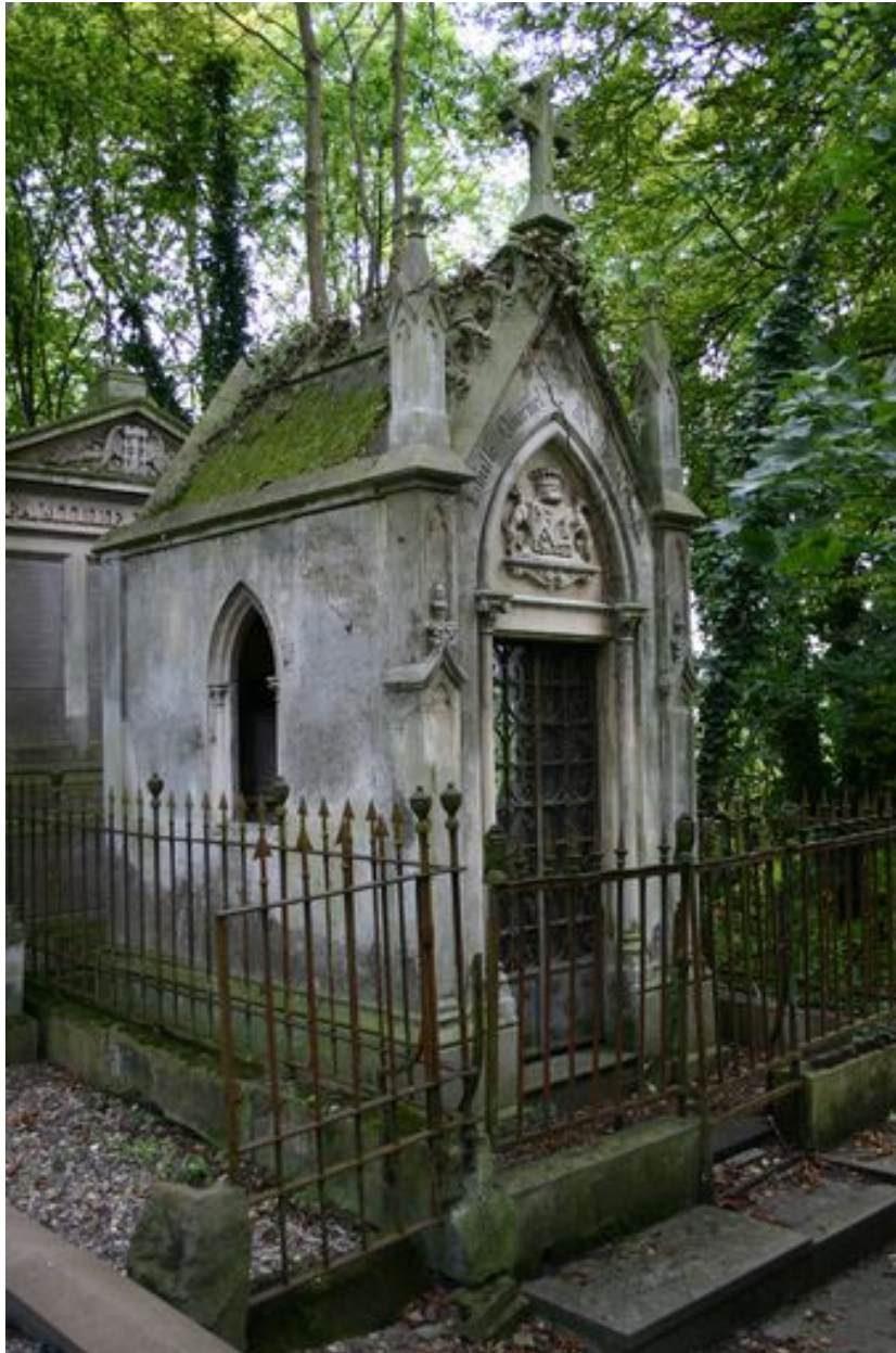
Tombeau en forme de chapelle, depuis le côté gauche.