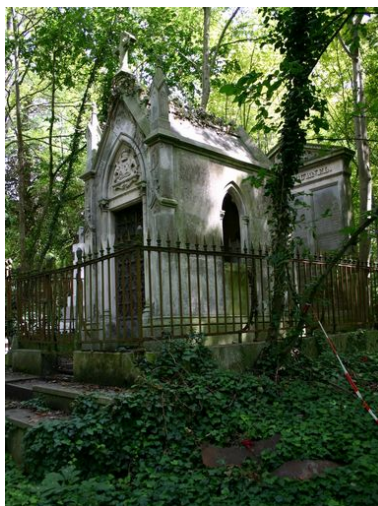
Vue générale, depuis le côté droit.