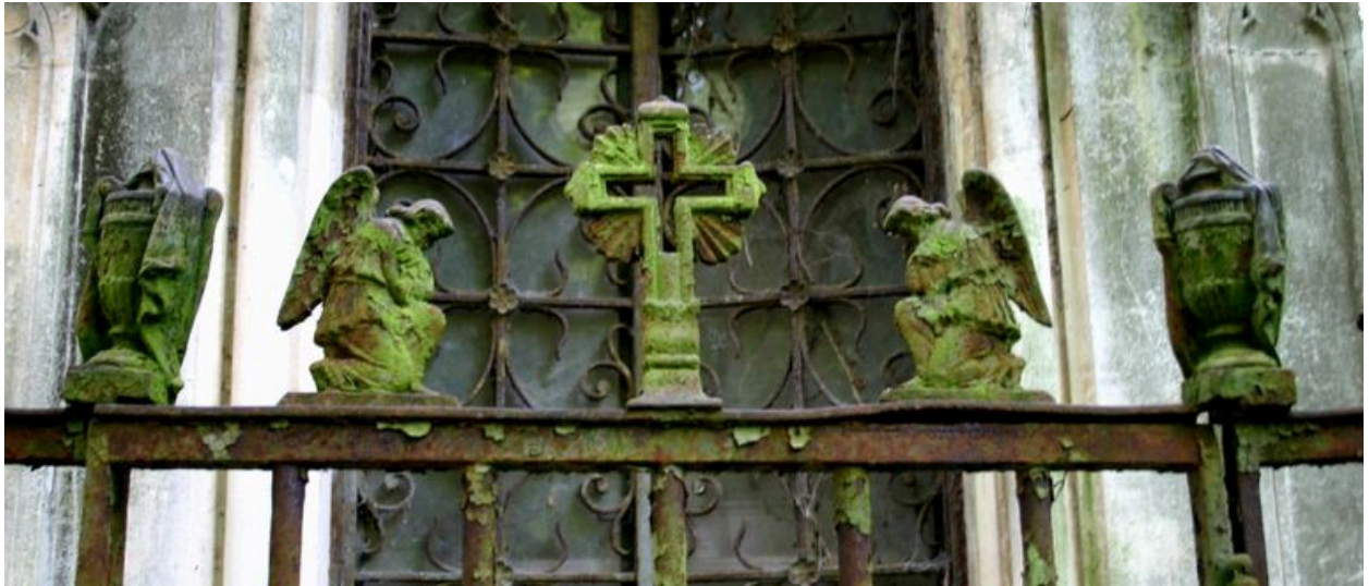
Détail du décor ornant le portillon de clôture.