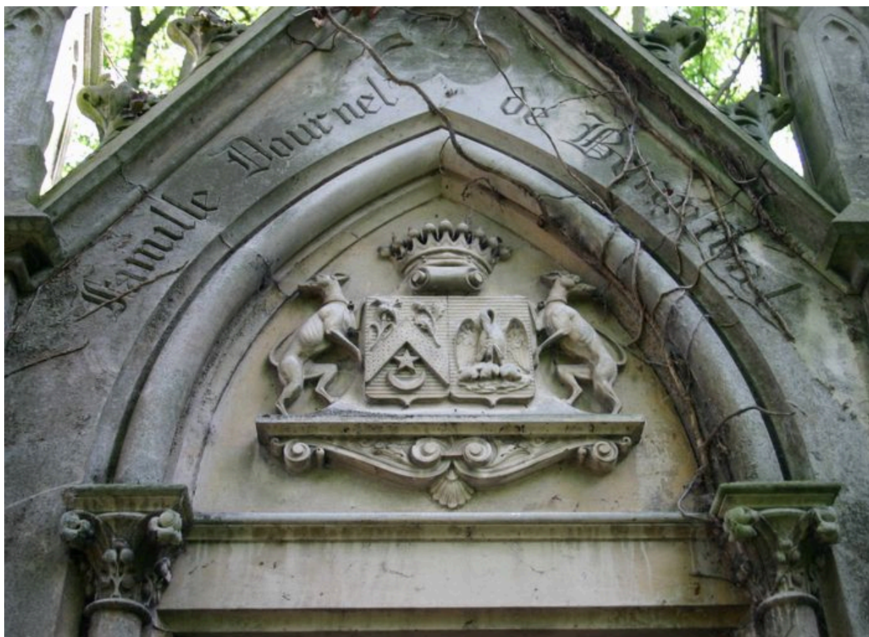
Tombeau en forme de chapelle : vue de détail sur les armoiries de la famille Dournel de Bonnival.