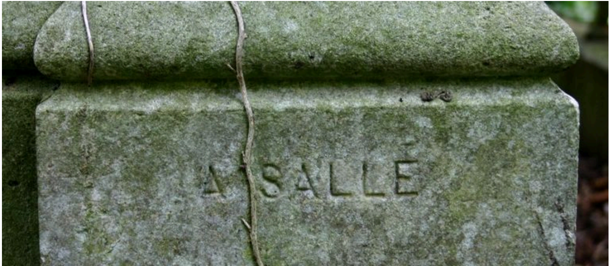
Tombeau en forme de chapelle : signature de l'entrepreneur A. Sallé.