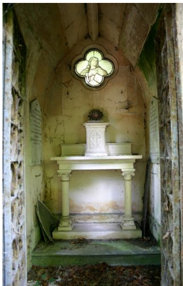
Tombeau en forme de chapelle : vue intérieure.