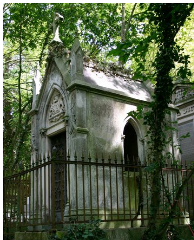
Tombeau en forme de chapelle, depuis le côté droit. IVR22_20078001028NUCA