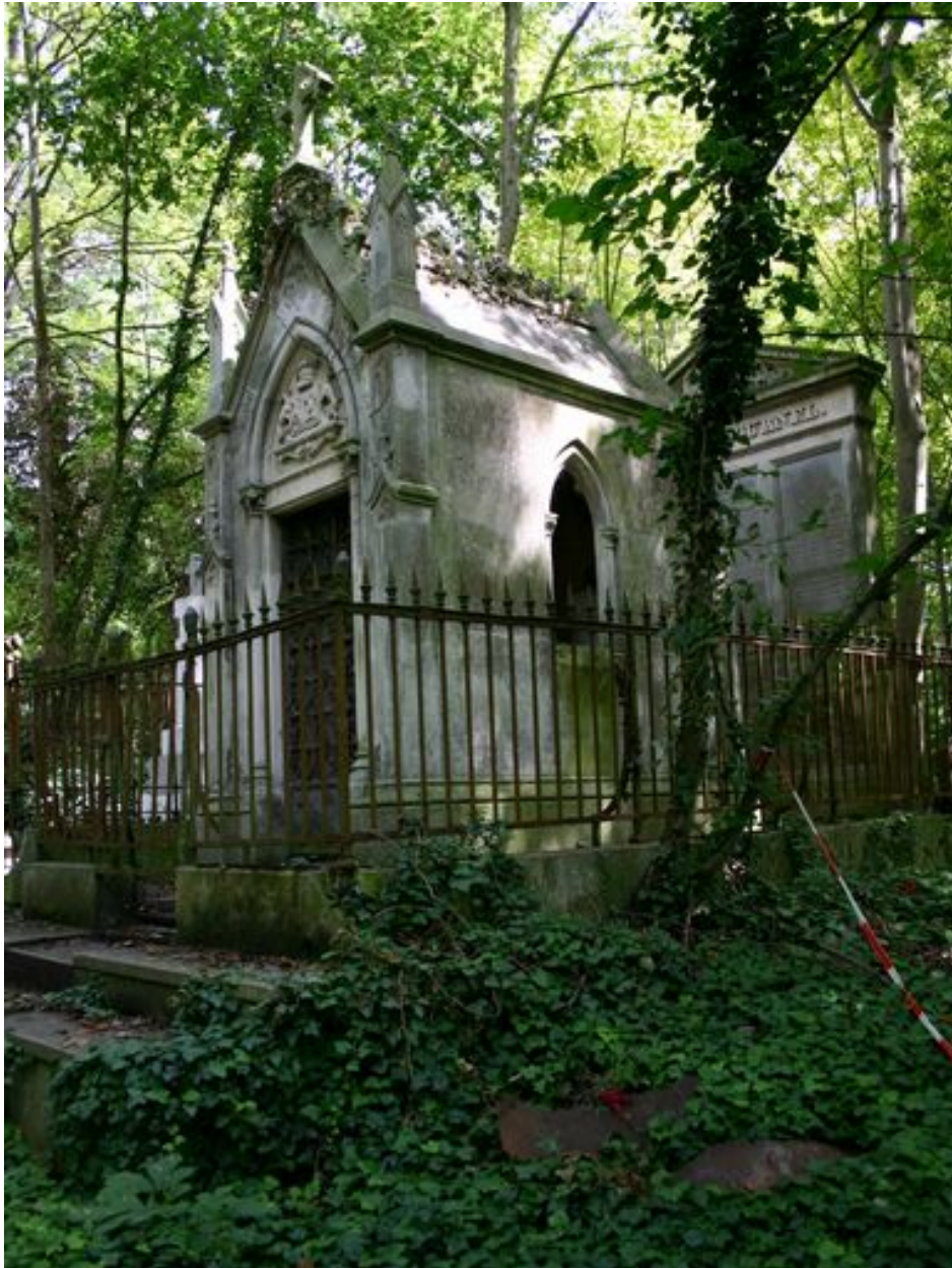
Vue générale, depuis le côté droit.