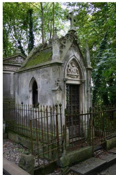
Tombeau en forme de chapelle, depuis le côté gauche.