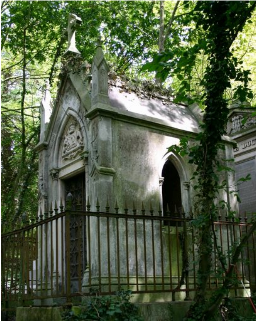
Tombeau en forme de chapelle, depuis le côté droit.