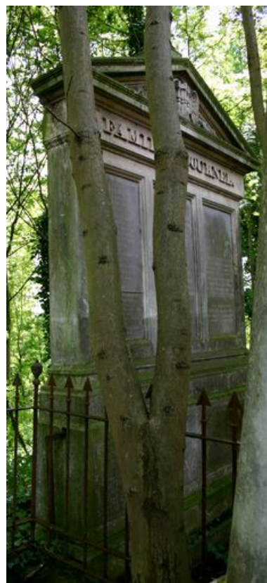
Stèle à entablement et fronton. IVR22_20078001031NUCA