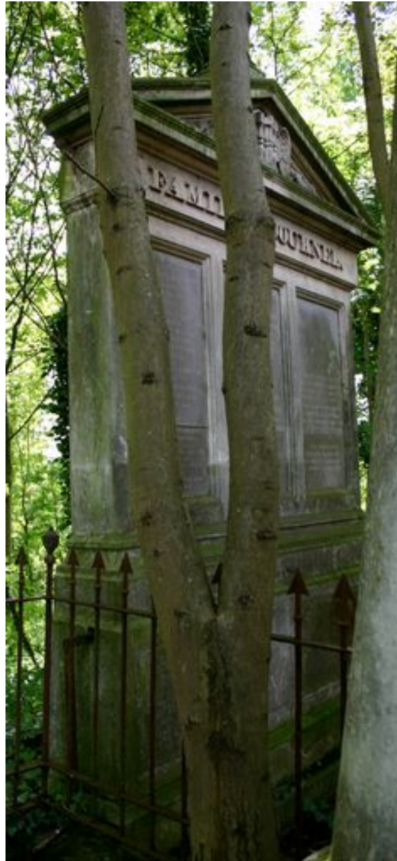
Stèle à entablement et fronton.