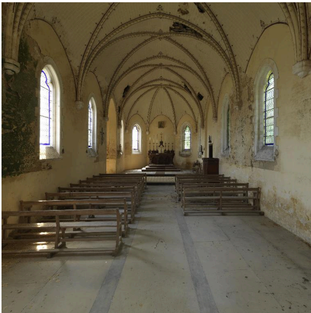
Vue de la nef et du choeur.