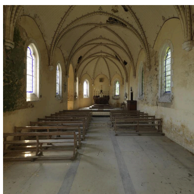
Vue de la nef et du chœur. IVR22_20158000568NUC2AQ