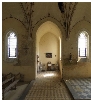
Vue de la chapelle nord.