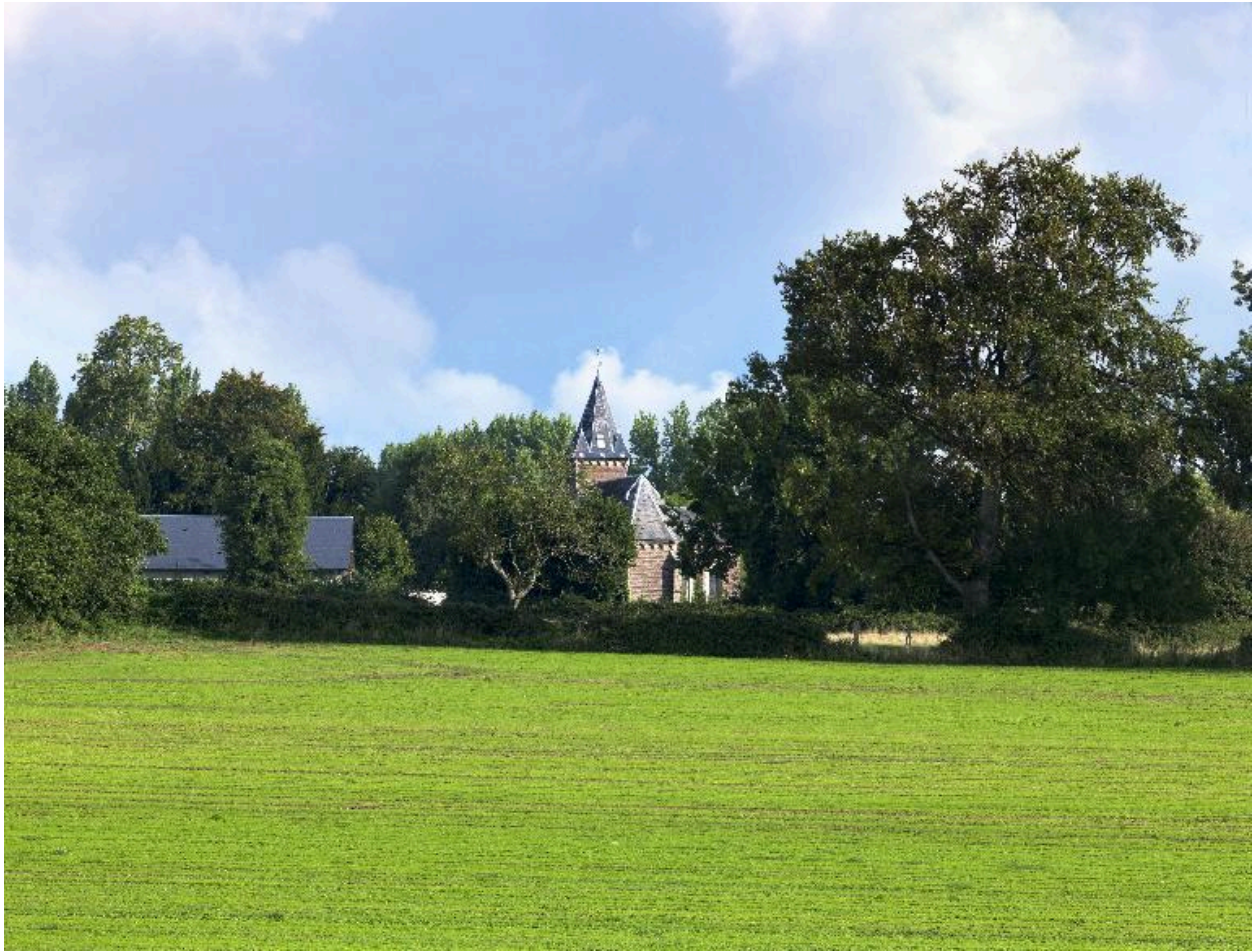
Vue du chevet.