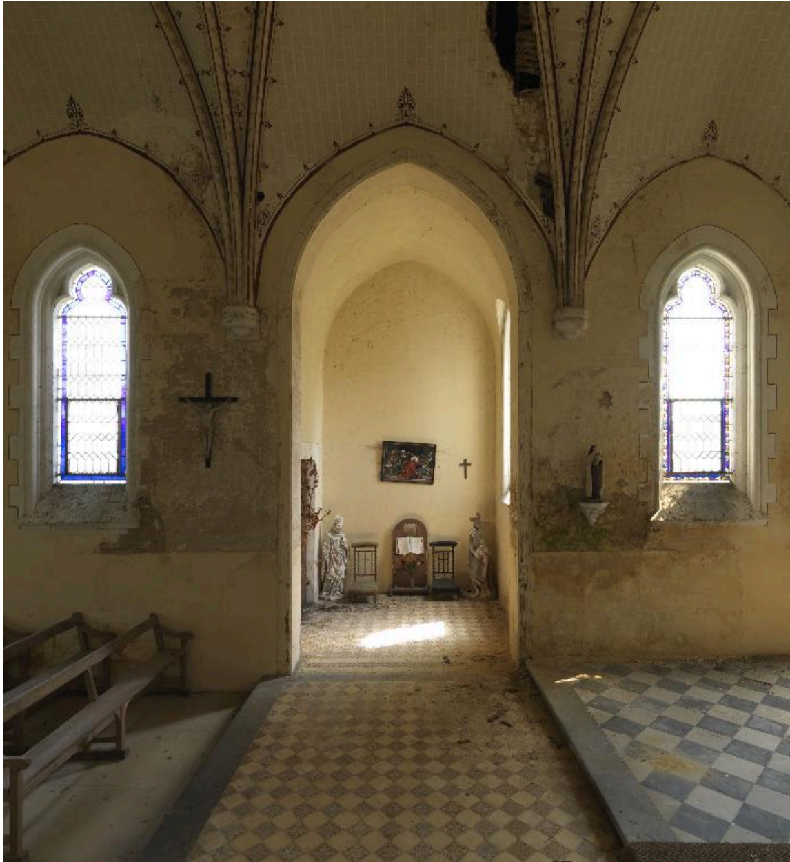
Vue de la chapelle nord.