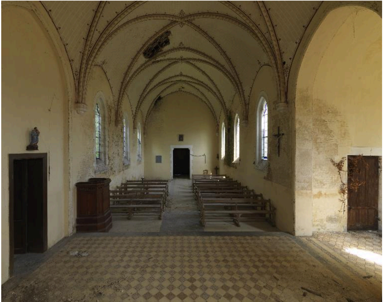
Vue de la nef depuis le chœur.