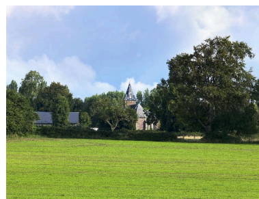
Vue du chevet.