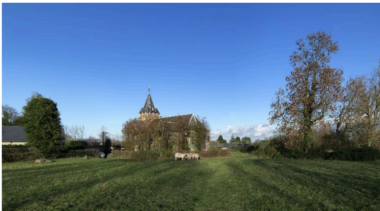
Vue de trois-quarts arrière.