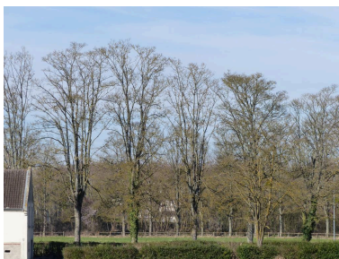
L'ancien stade.