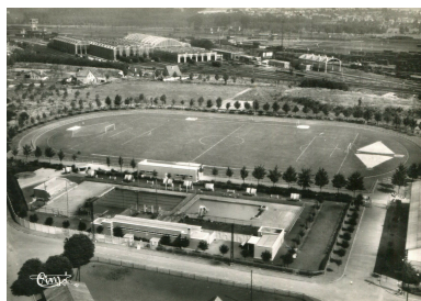
Quessy-cité. Le stade, la piscine et le solarium. Carte postale, vers 1960 (coll. part). IVR32_20210205188NUCA