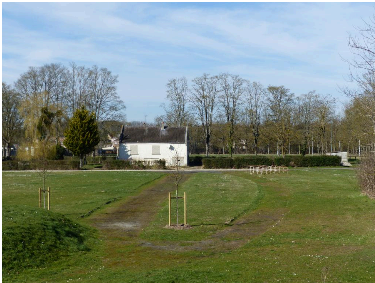
Vue depuis le sud.