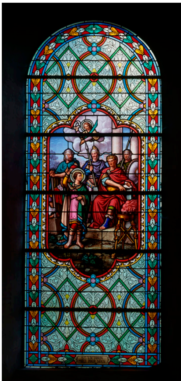
Baie 1 : Saint Victorin.