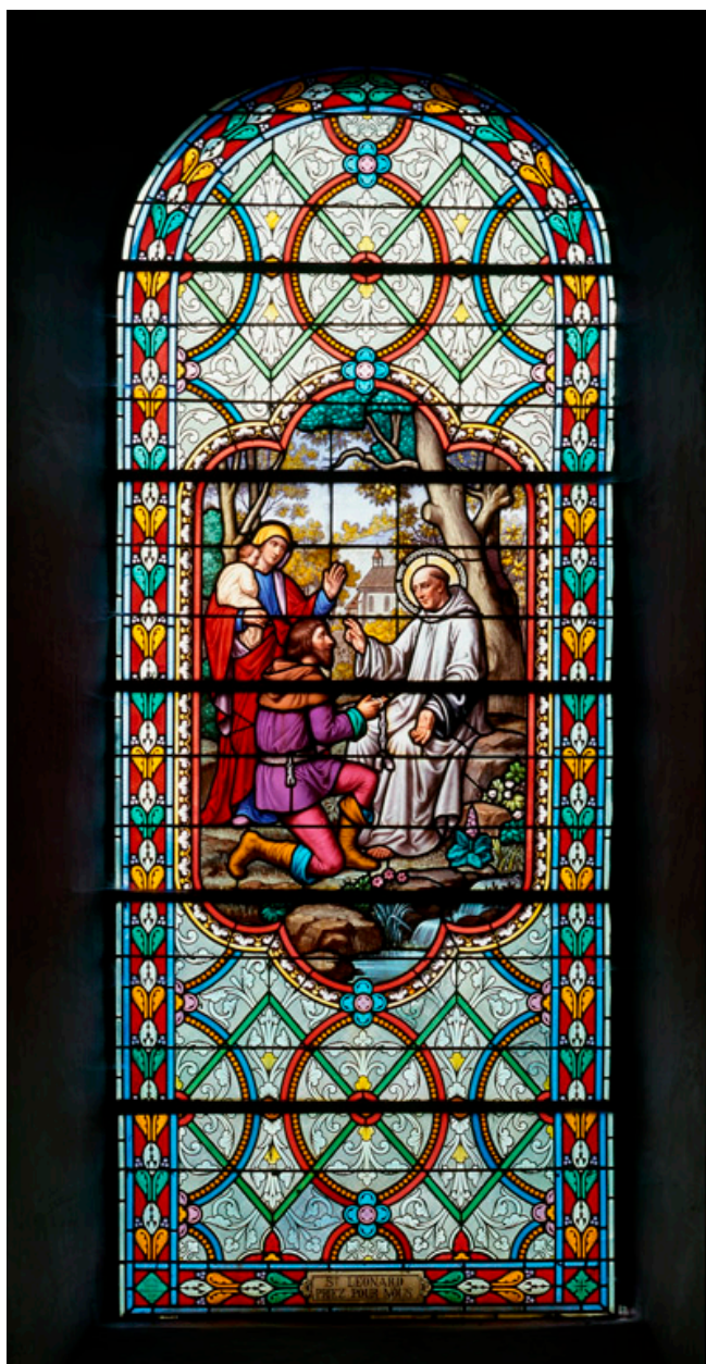
Baie 2 : saint Léonard.