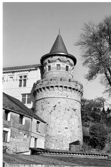
Vue de la tour des Fermes (ancienne prison), transformée en 1853 dans le style médiéval.

IVR22_19990207086Z