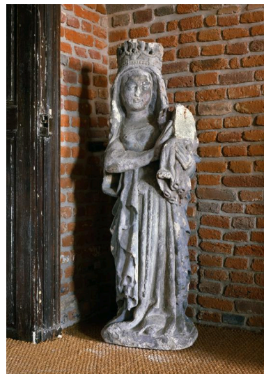
Vue de la statue autrefois placée sur la porte dite à l'Image Notre Dame, détruite en 1781. L'oeuvre est conservée à la SAHVP.