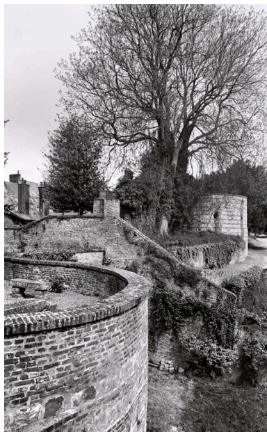
Détail d'une tour des fortifications de la ville.