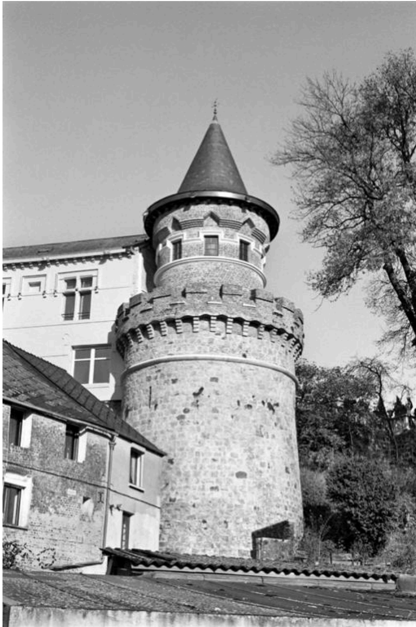
Vue de la tour des Fermes (ancienne prison), transformée en 1853 dans le style médiéval.