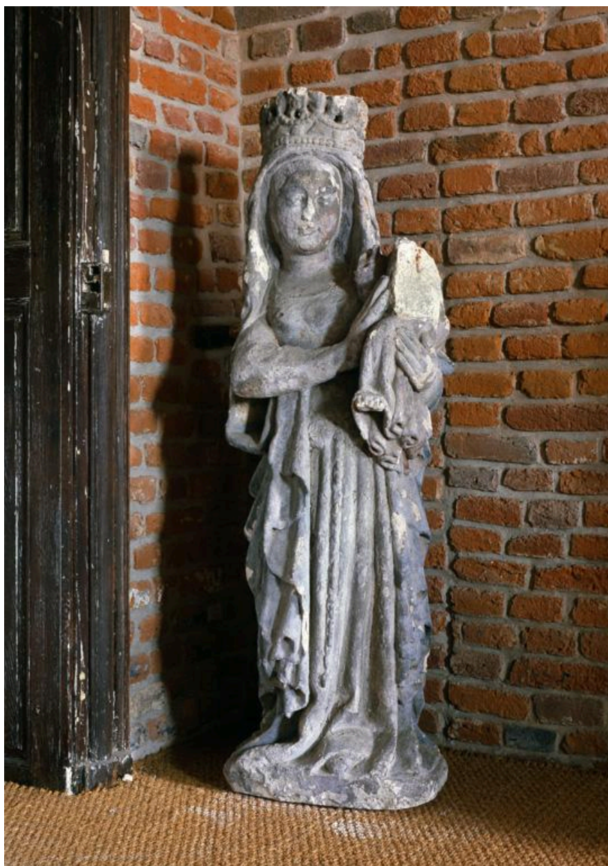
Vue de la statue autrefois placée sur la porte dite à l'Image Notre Dame, détruite en 1781. L'oeuvre est conservée à la SAHVP.