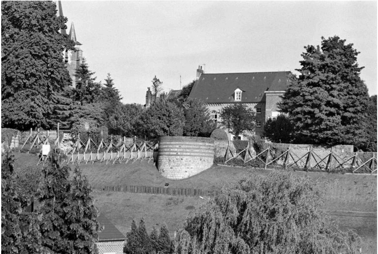
Vue de l'élévation septentrionale, prise au niveau de la sous-préfecture.