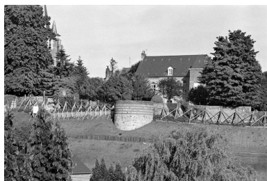
Vue de l'élévation septentrionale, prise au niveau de la sous-préfecture.

IVR22_19990202111Z