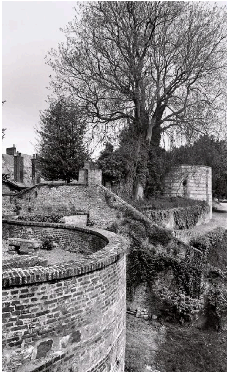
Détail d'une tour des fortifications de la ville.