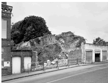
Vue réalisée en 1998, depuis la rue Condorcet, mettant en évidence la composition faite de 2 parements de grès et d'un remplissage de blocailles noyées dans un mortier.

IVR22_19990202111Z