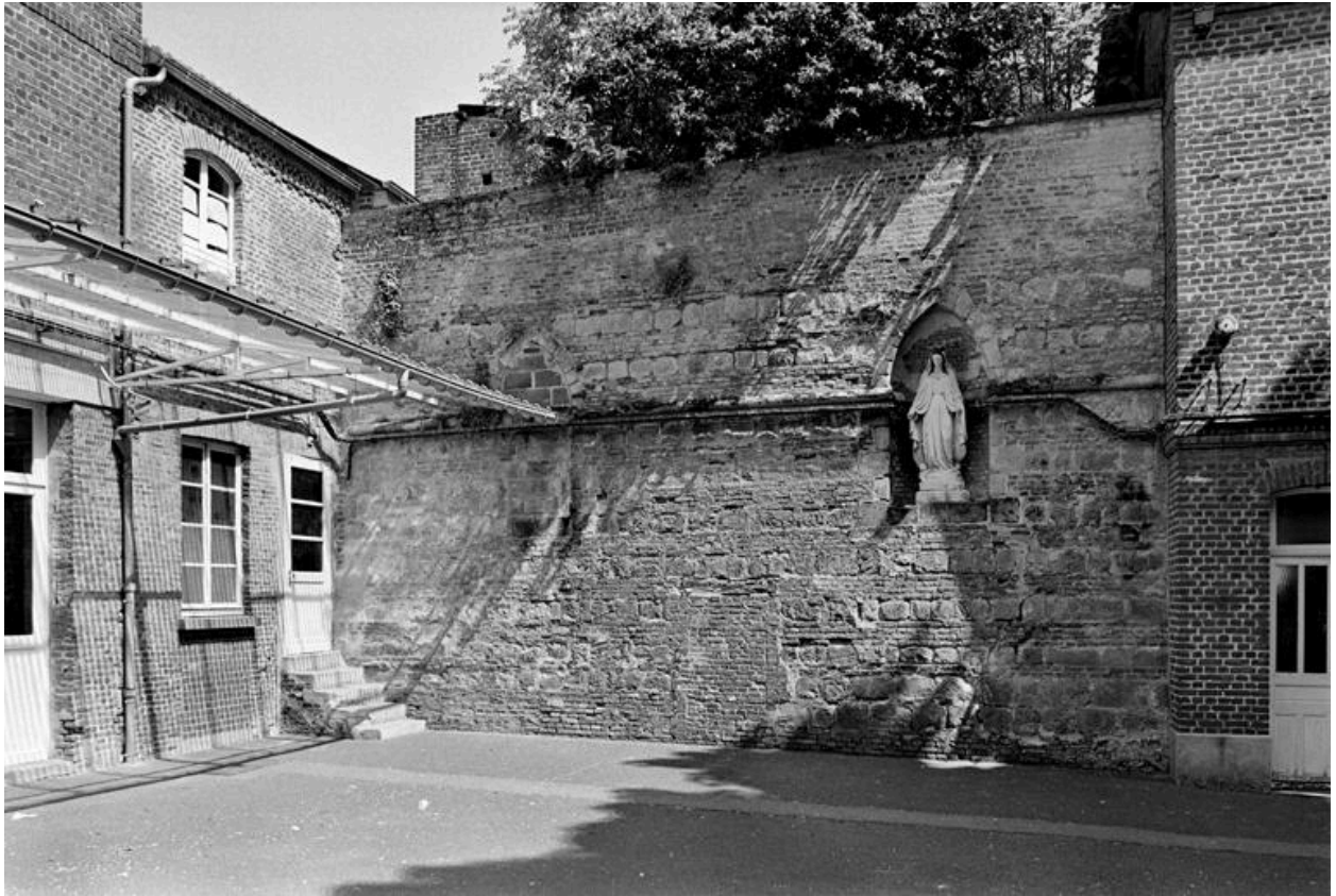
Vue, depuis la cour intérieure de l'insitution Sainte-Anne, d'une partie de l'ancienne fortification.