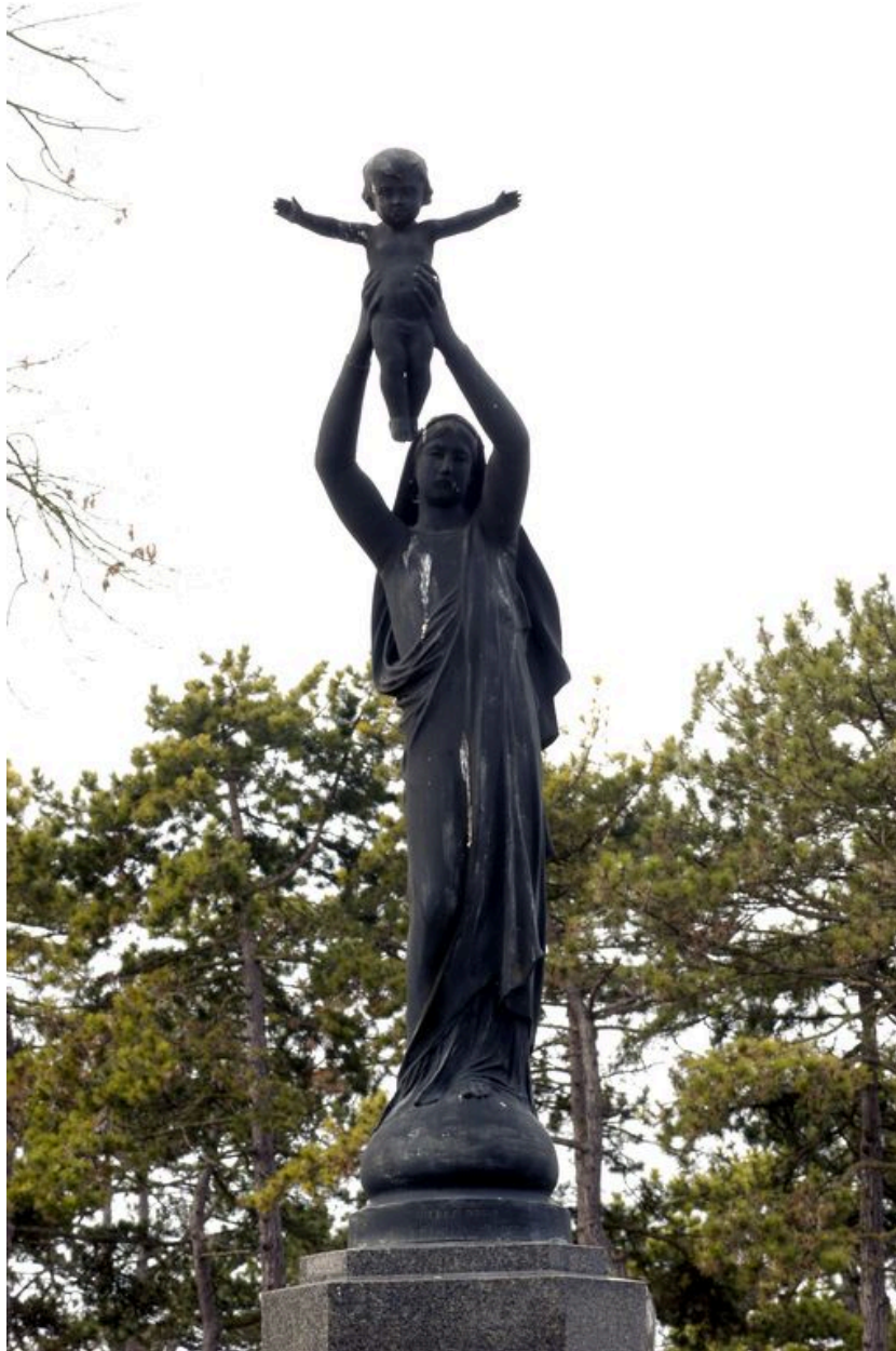
Vue de détail sur la statue (vue de face).