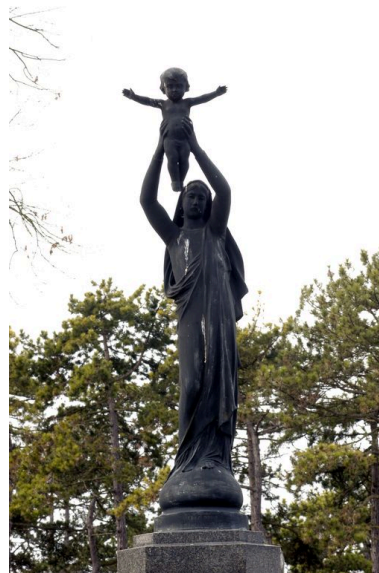
Vue de détail sur la statue (vue de face).