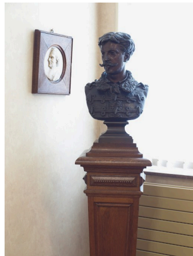
Vue générale IVR31_20106204436NUCA