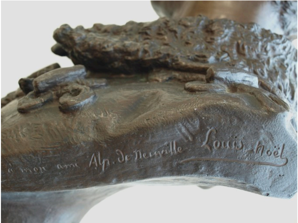
Vue de détail : signature sculpteur