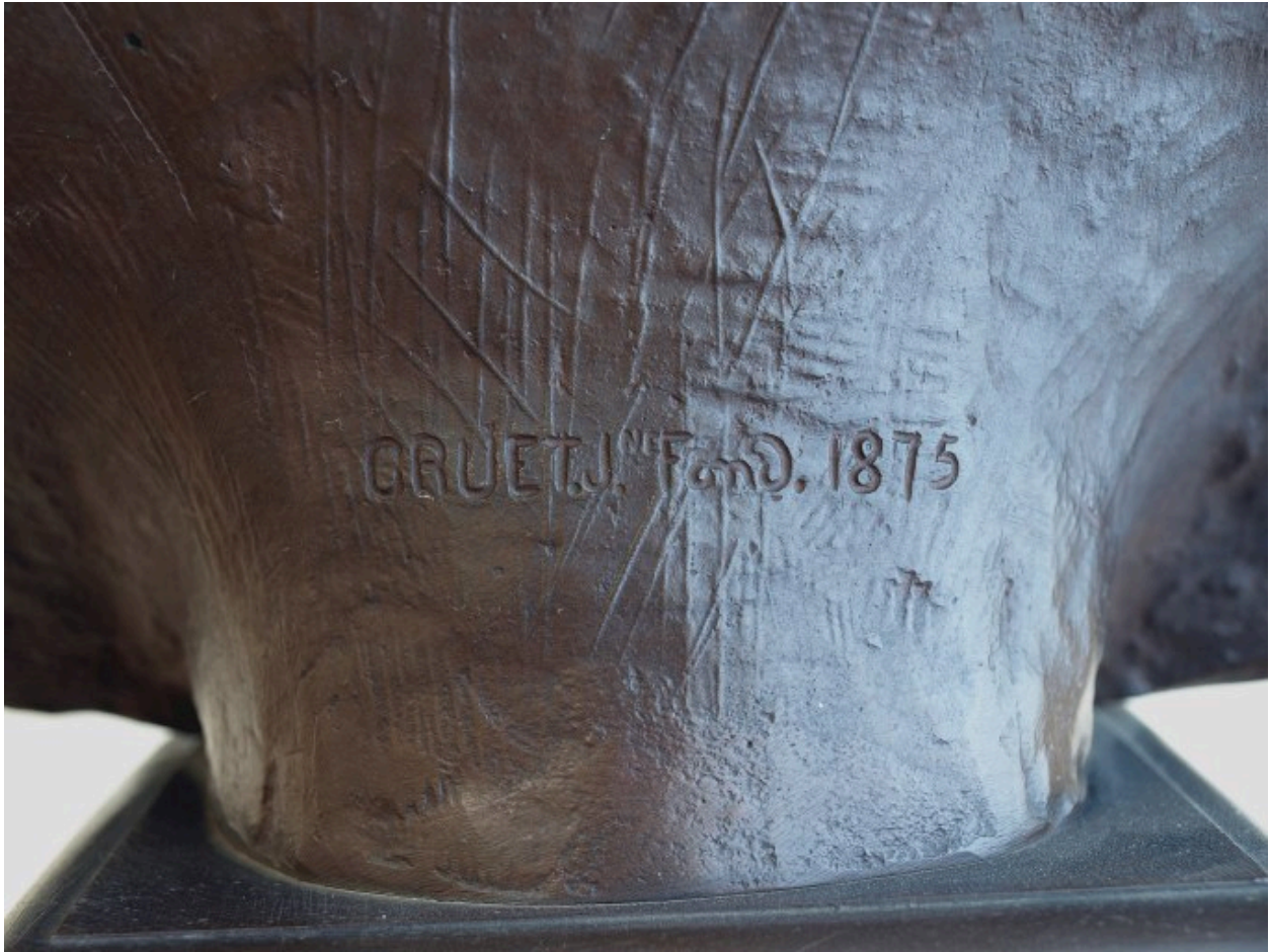
Vue de détail : signature fondeur