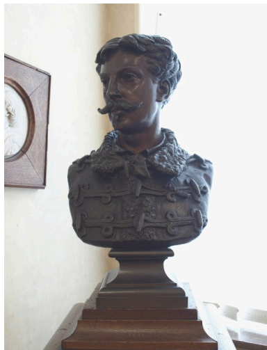
Vue générale IVR31_20106204437NUCA