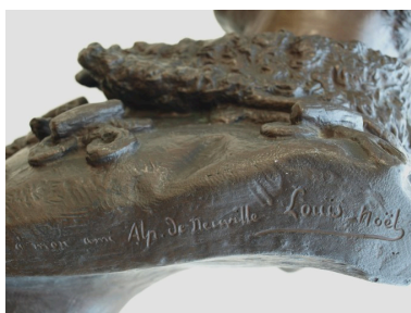
Vue de détail : signature sculpteur IVR31_20106204440NUCA