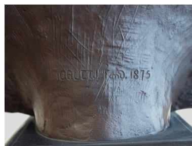
Vue de détail : signature fondeur IVR31_20106204441NUCA