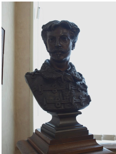
Vue générale IVR31_20106204438NUCA