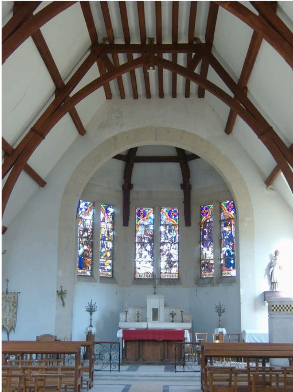
Vue générale du chœur.