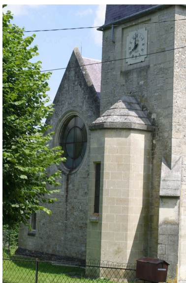
Vue de la façade ouest. IVR22_20030202865NUCA