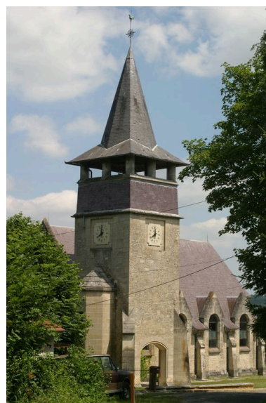
Vue latérale.