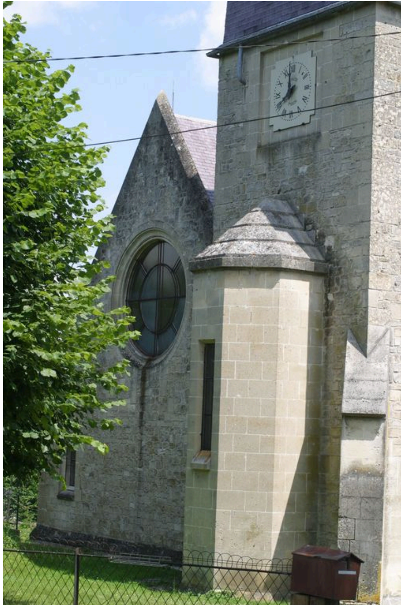
Vue de la façade ouest.