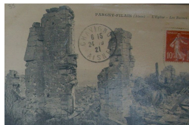
Vue de l'église en ruine.