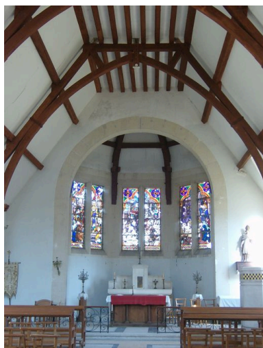
Vue générale du chœur.