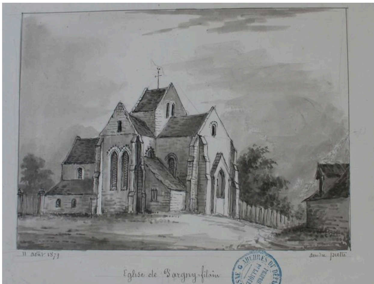
Dessin présentant l'édifice à la fin du 19e siècle, par Amédée Piette (AD Aisne : 8 Fi Pargny 1).