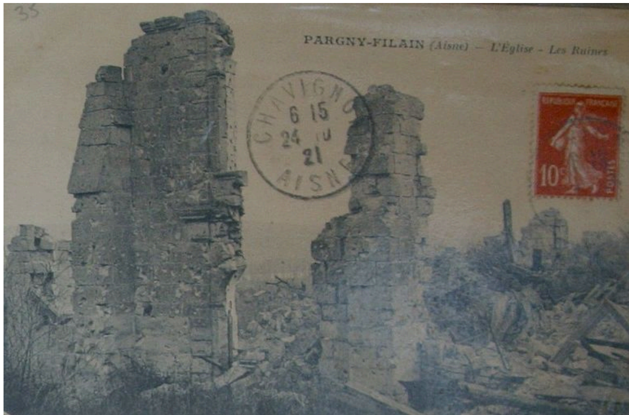
Vue de l'église en ruine (coll. part).