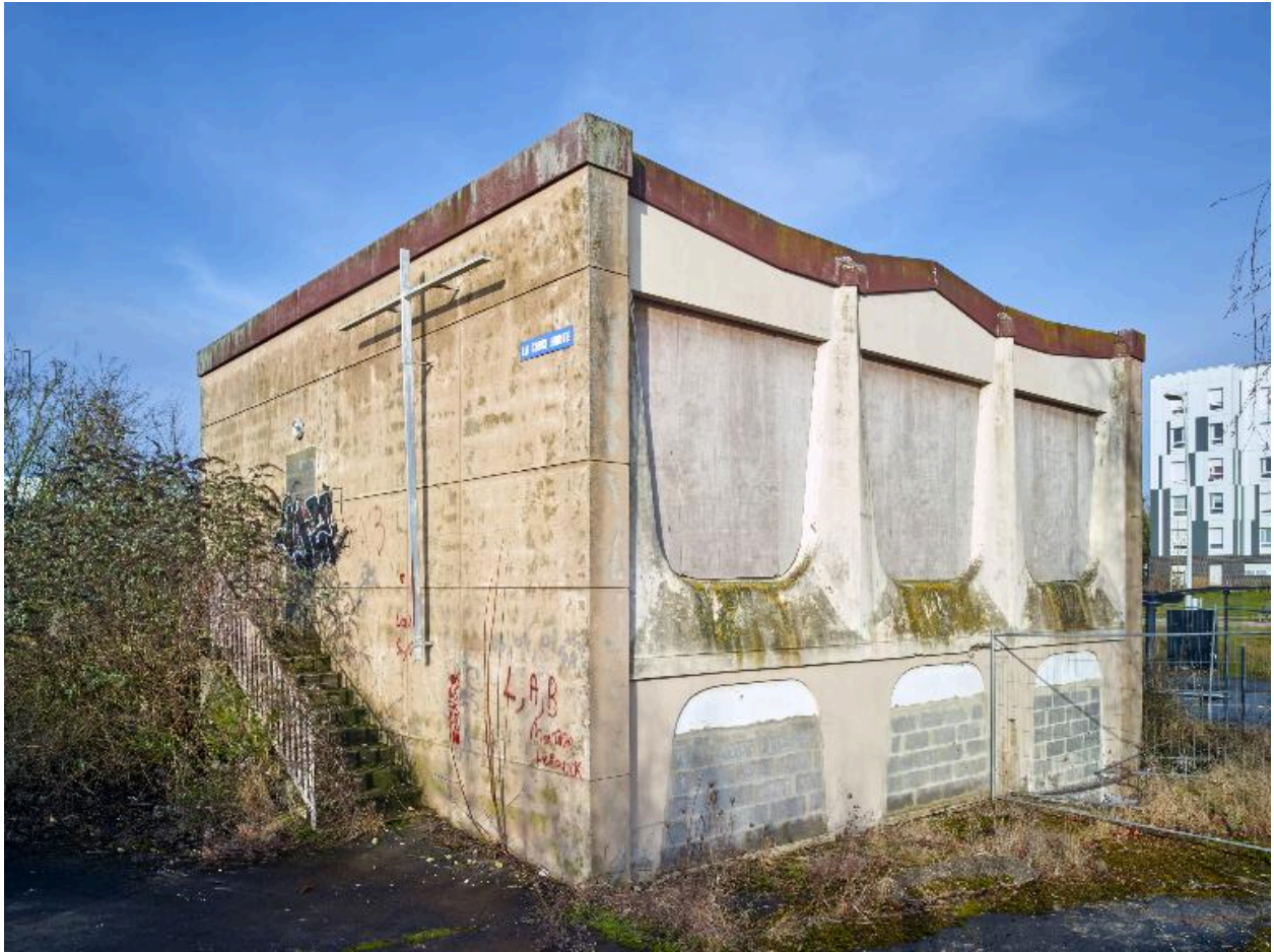
Élévation sud et ouest de l'édifice.