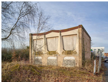
Élévation est et nord de l'édifice. IVR32_20176200045NUCA