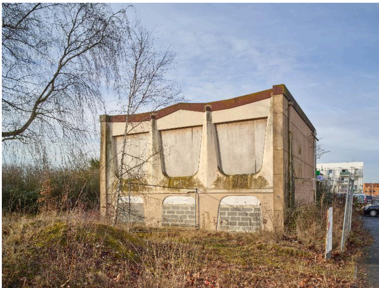
Élévation est et nord de l'édifice.