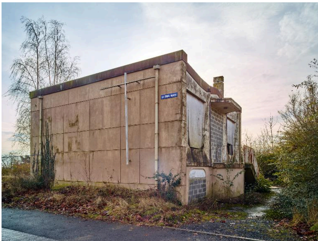
Élévation nord et ouest de l'édifice.