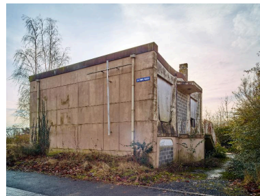
Élévation nord et ouest de l'édifice.