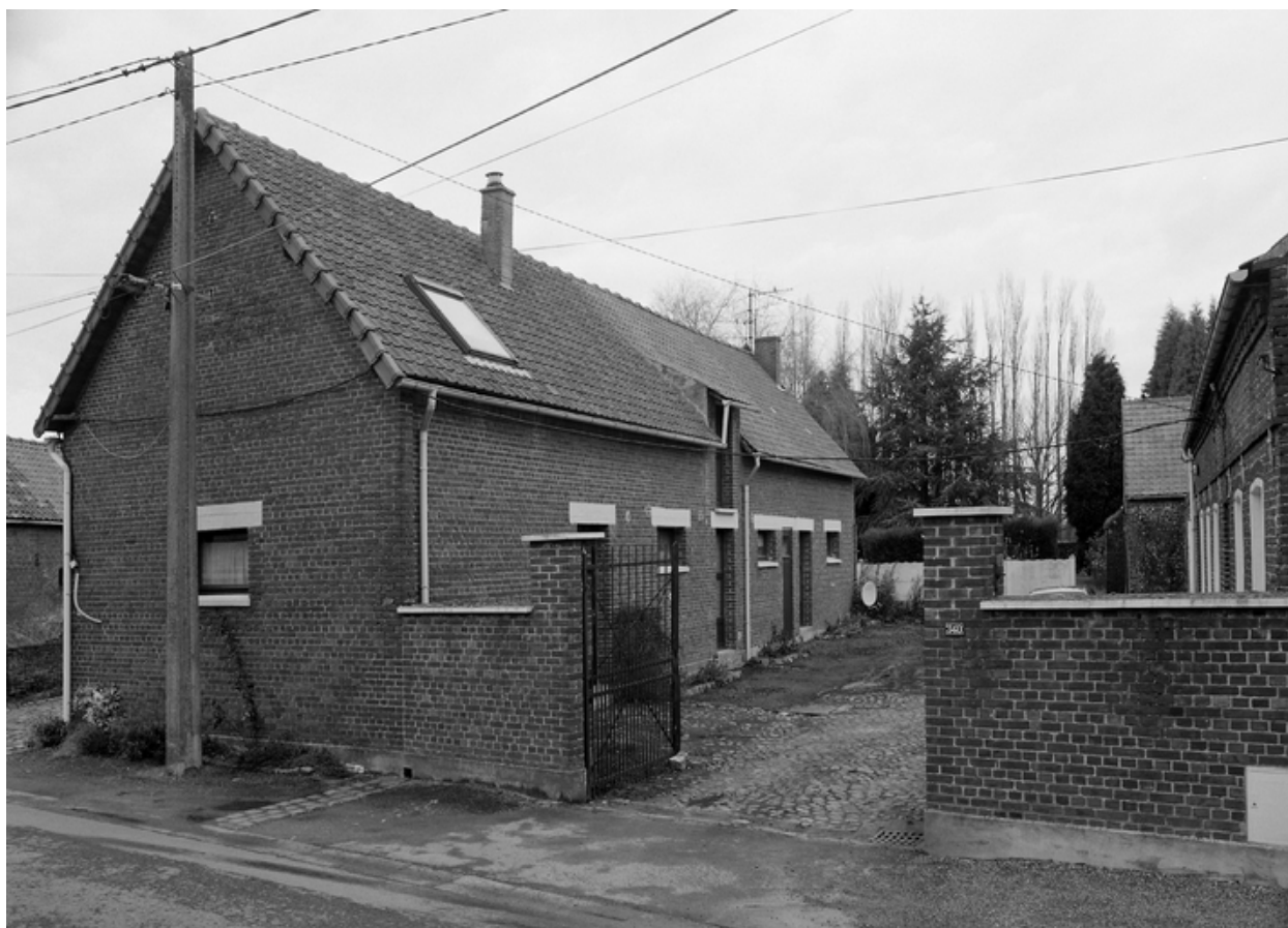
Vue générale des étables-écuries depuis la rue.