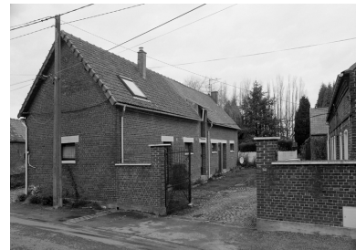
Vue générale des étables- écuries depuis la rue. IVR31_20055900023X