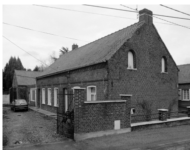
Vue générale du logis depuis la rue. IVR31_20055900021X