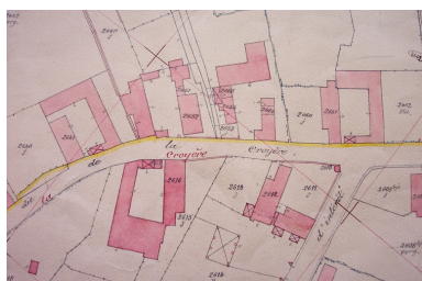
Situation sur le cadastre de 1912, feuille 12 (AD Nord : P31/ 624). IVR31_20055907318NUCA