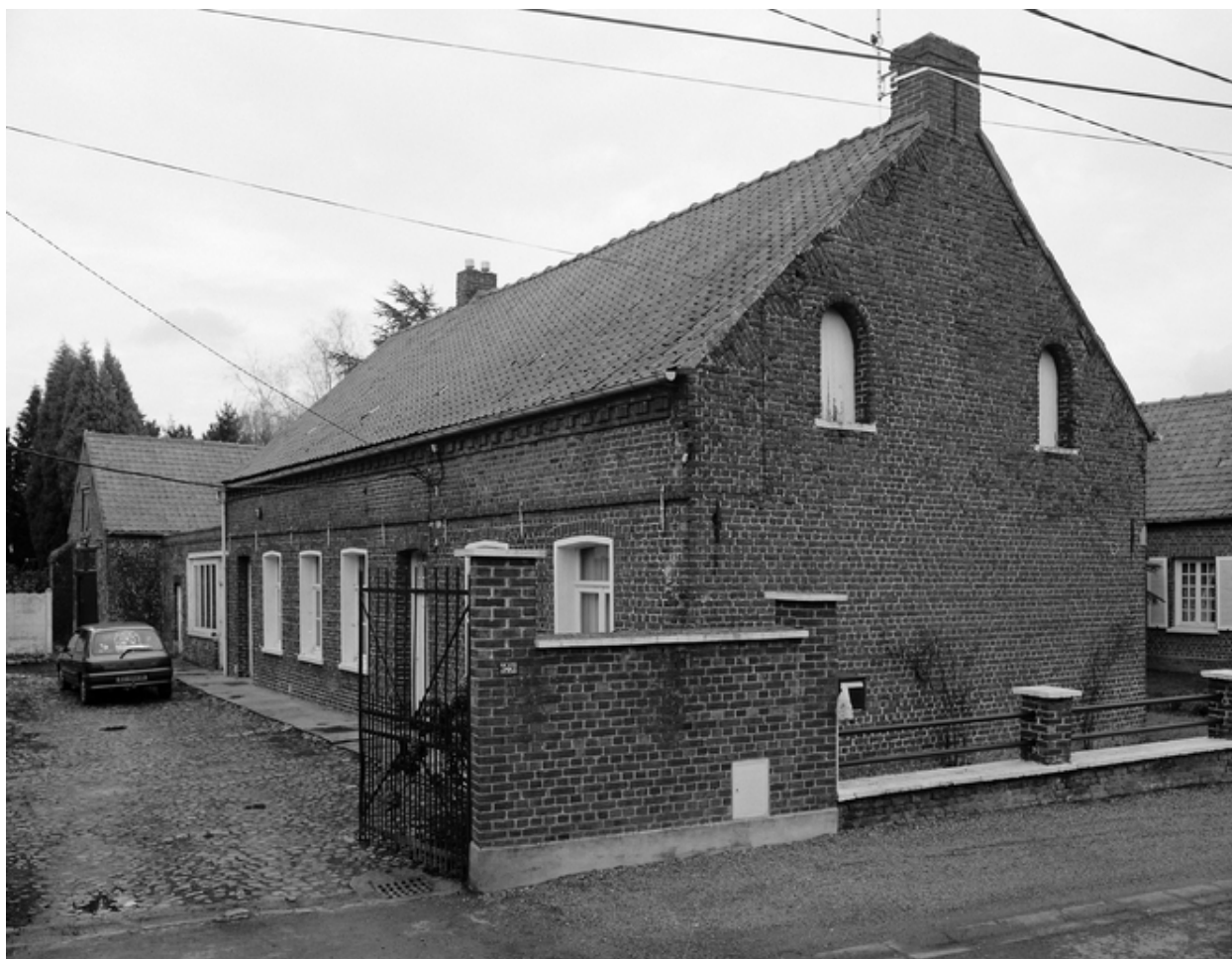
Vue générale du logis depuis la rue.