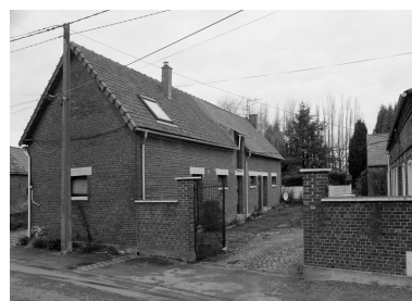
Vue générale des étables- écuries depuis la rue. IVR31_20055900023X