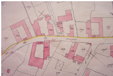
Situation sur le cadastre de 1912, feuille 12 (AD Nord : P31/ 624). IVR31_20055907318NUCA