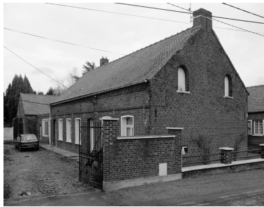
Vue générale du logis depuis la rue. IVR31_20055900021X