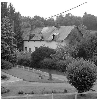
Vue éloignée du logis après sinistre.

IVR22_20080290085NUCA