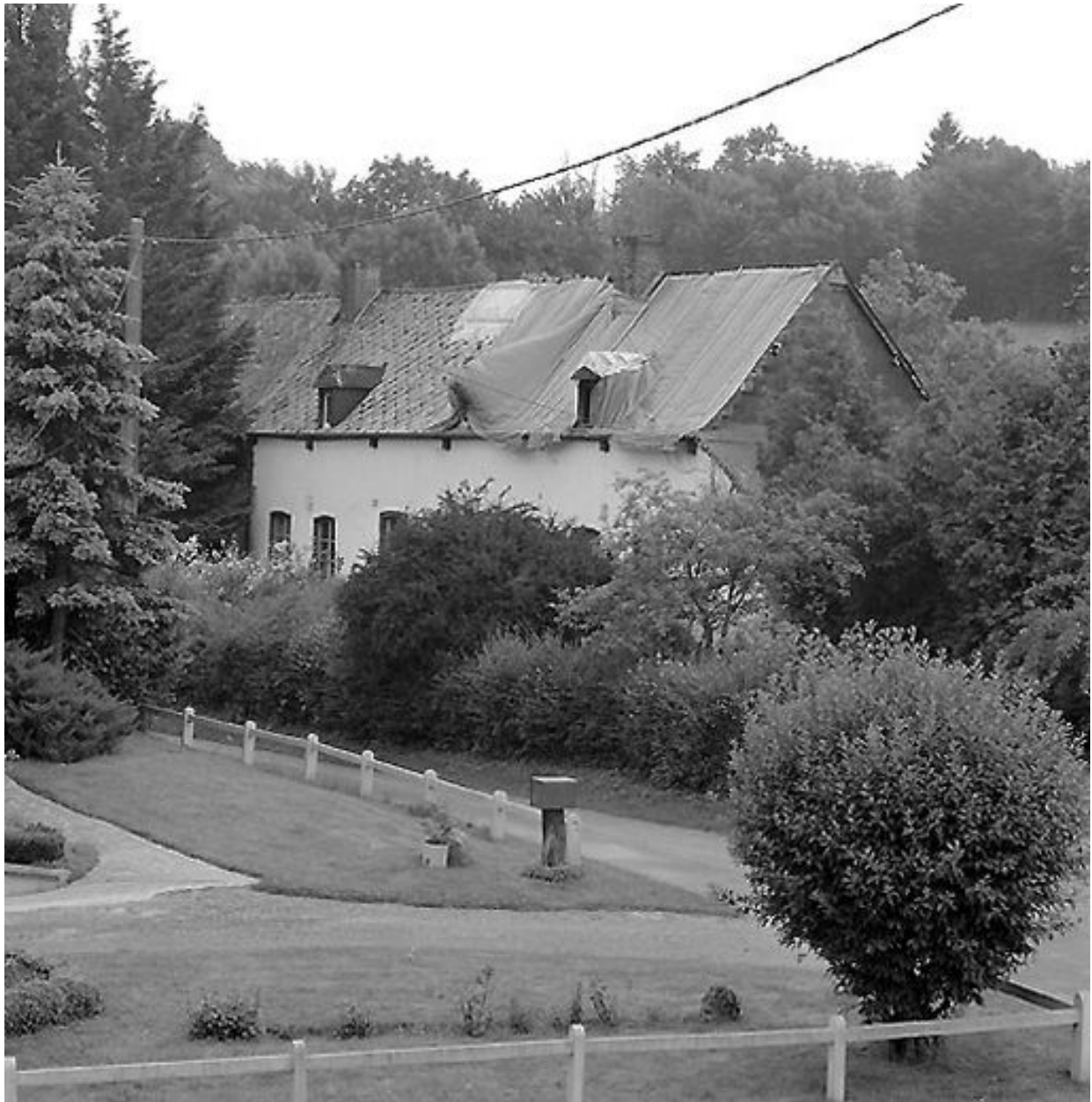
Vue éloignée du logis après sinistre.