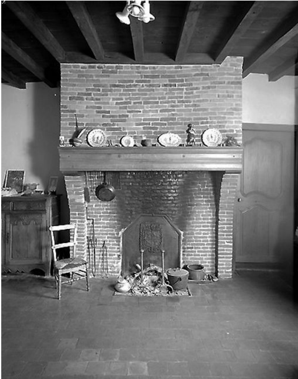
Cheminée de la salle commune