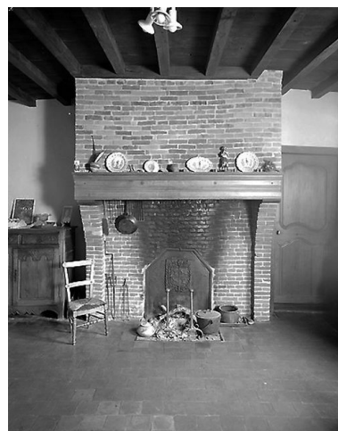
Cheminée de la salle commune

Phot. Thierry Lefébure IVR22_20020200464X