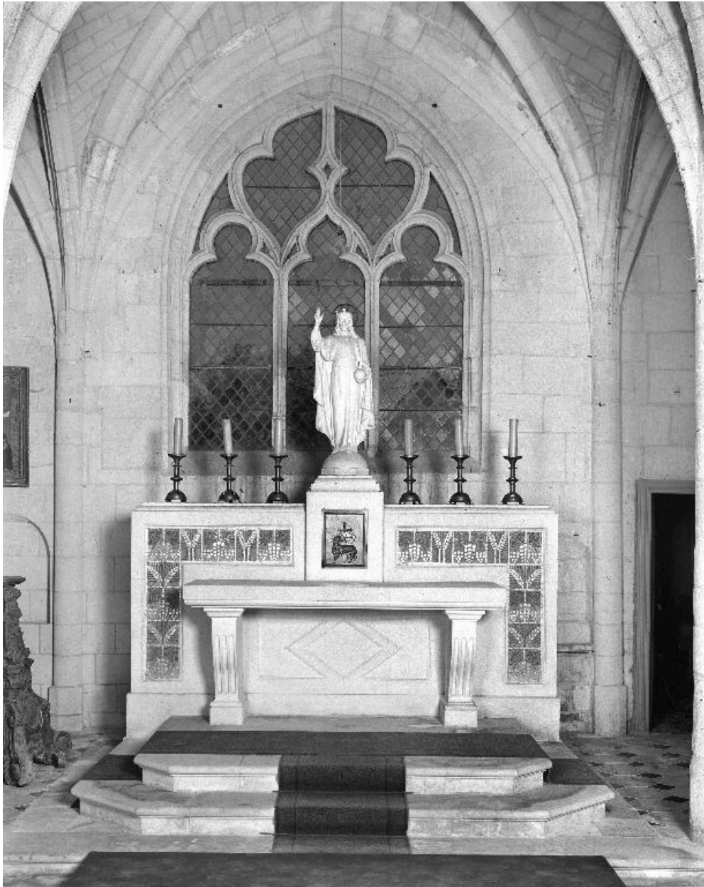
Vue générale du maître-autel.