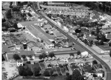
Vue aérienne générale de 1990. IVR32_20178005042NUCA