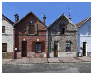
Logements ouvriers de la rue Henri- Piquet, façades des n° 18 et 20.