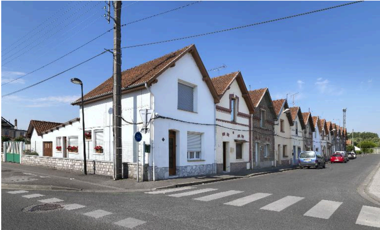
Logements ouvriers de la rue Nouvelle-Cité-Saint.