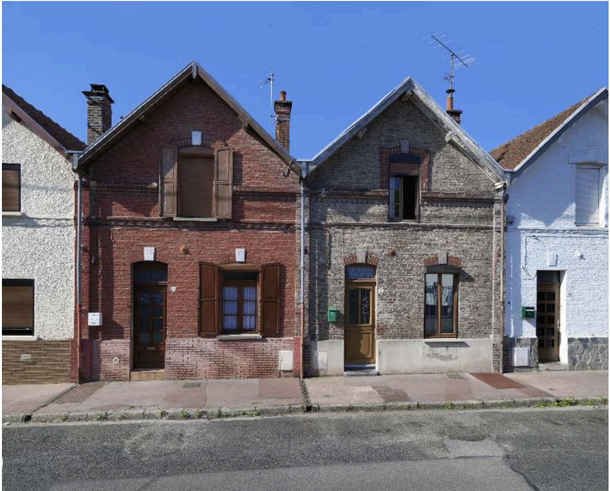
Logements ouvriers de la rue Henri-Piquet, façades des n° 18 et 20.