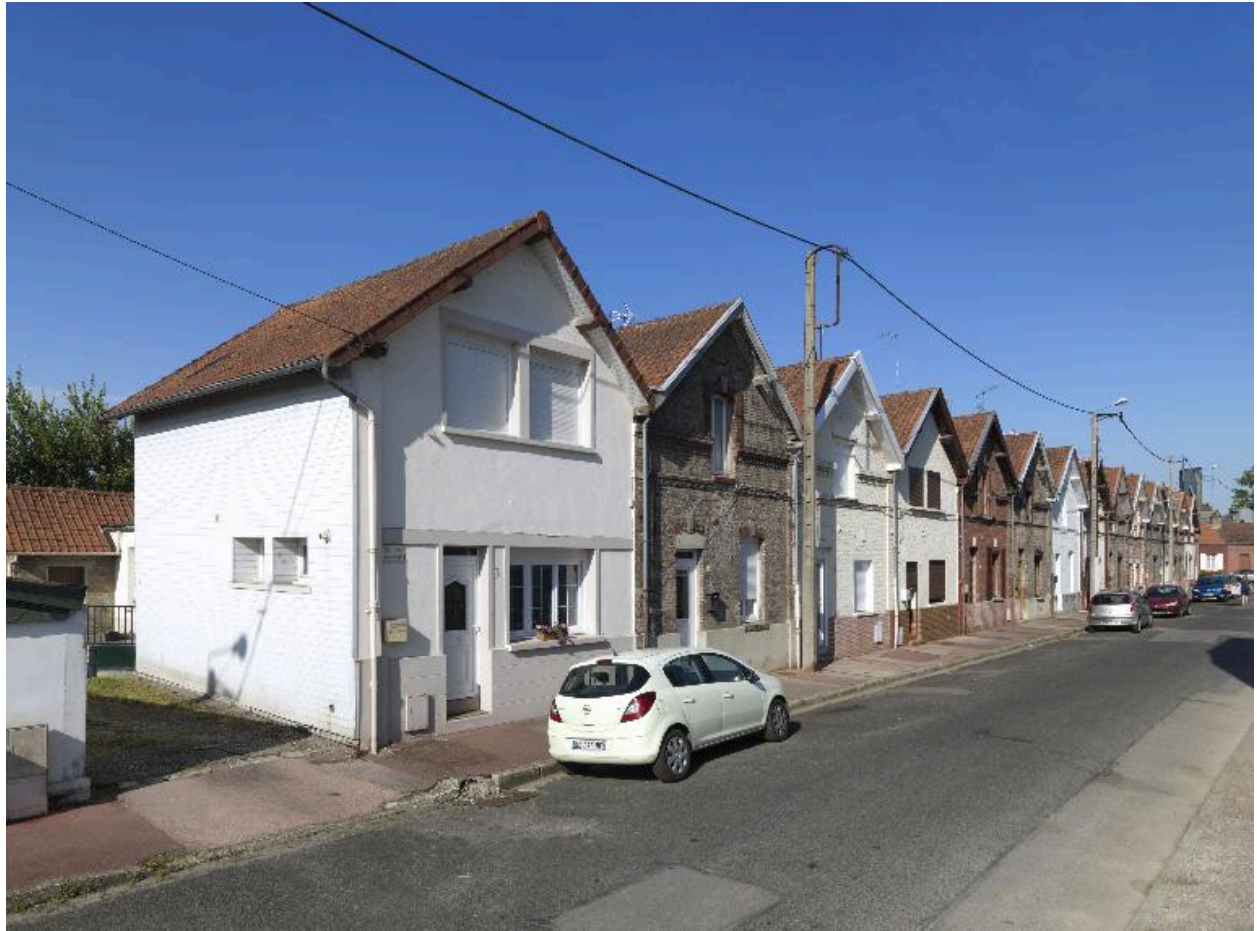
Logements ouvriers de la rue Henri-Piquet.