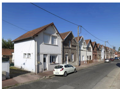
Logements ouvriers de la rue Henri-Piquet. IVR22_20168000289NUC2A