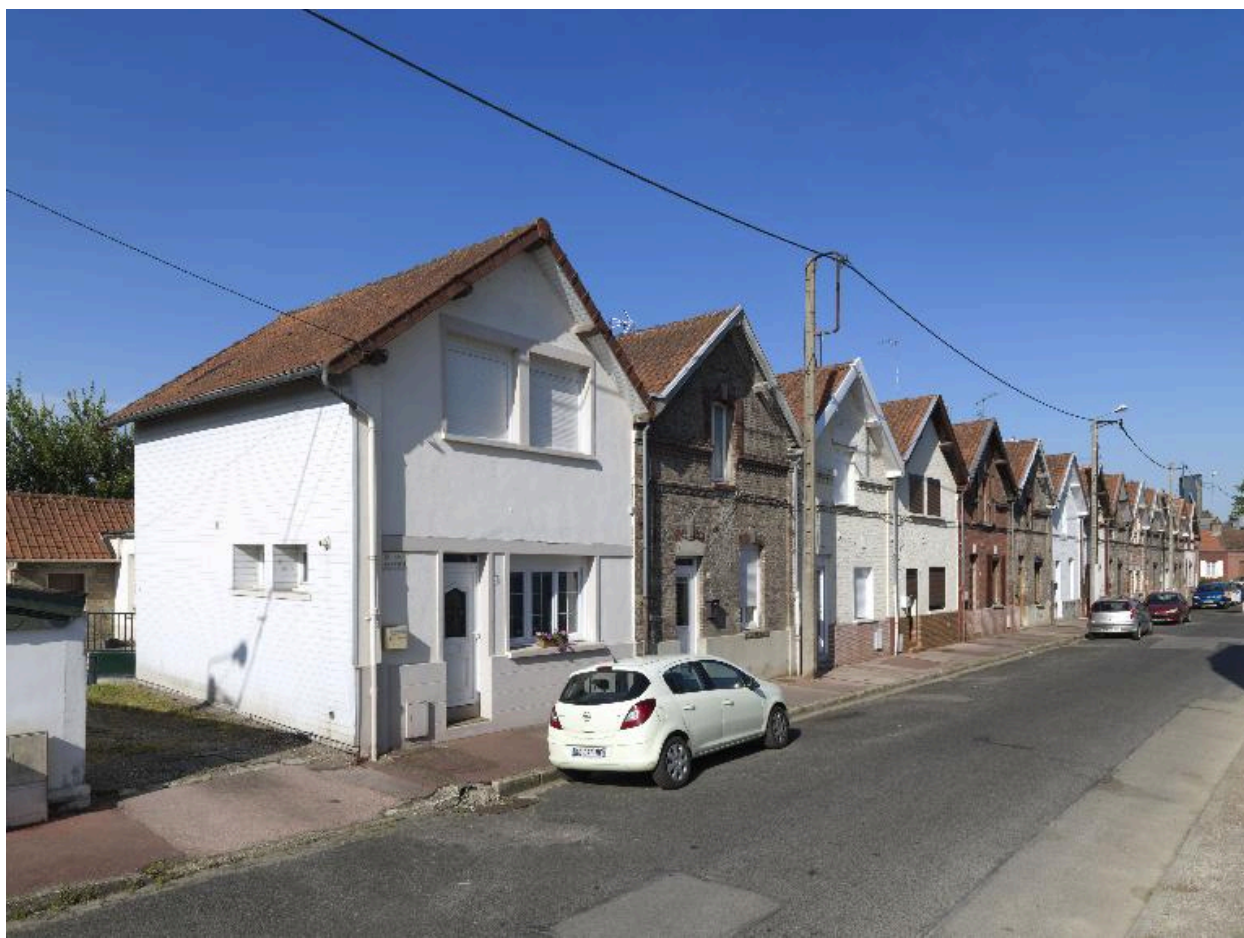
Logements ouvriers de la rue Henri-Piquet.