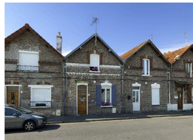
Logements ouvriers de la rue Nouvelle-Cité-Saint, façades des n° 19, 21 et 23. IVR22_20168000294NUC2A