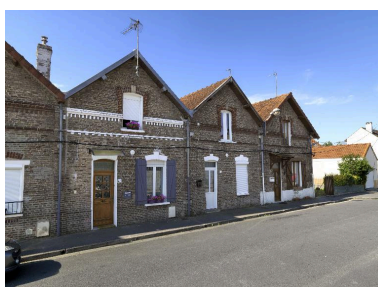
Logements ouvriers de la rue Nouvelle-Cité-Saint.