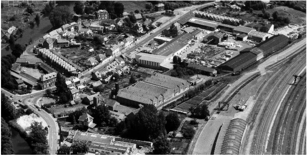
Vue aérienne générale de 1990.