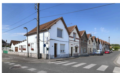
Logements ouvriers de la rue Nouvelle-Cité-Saint. IVR22_20168000292NUC2AQ