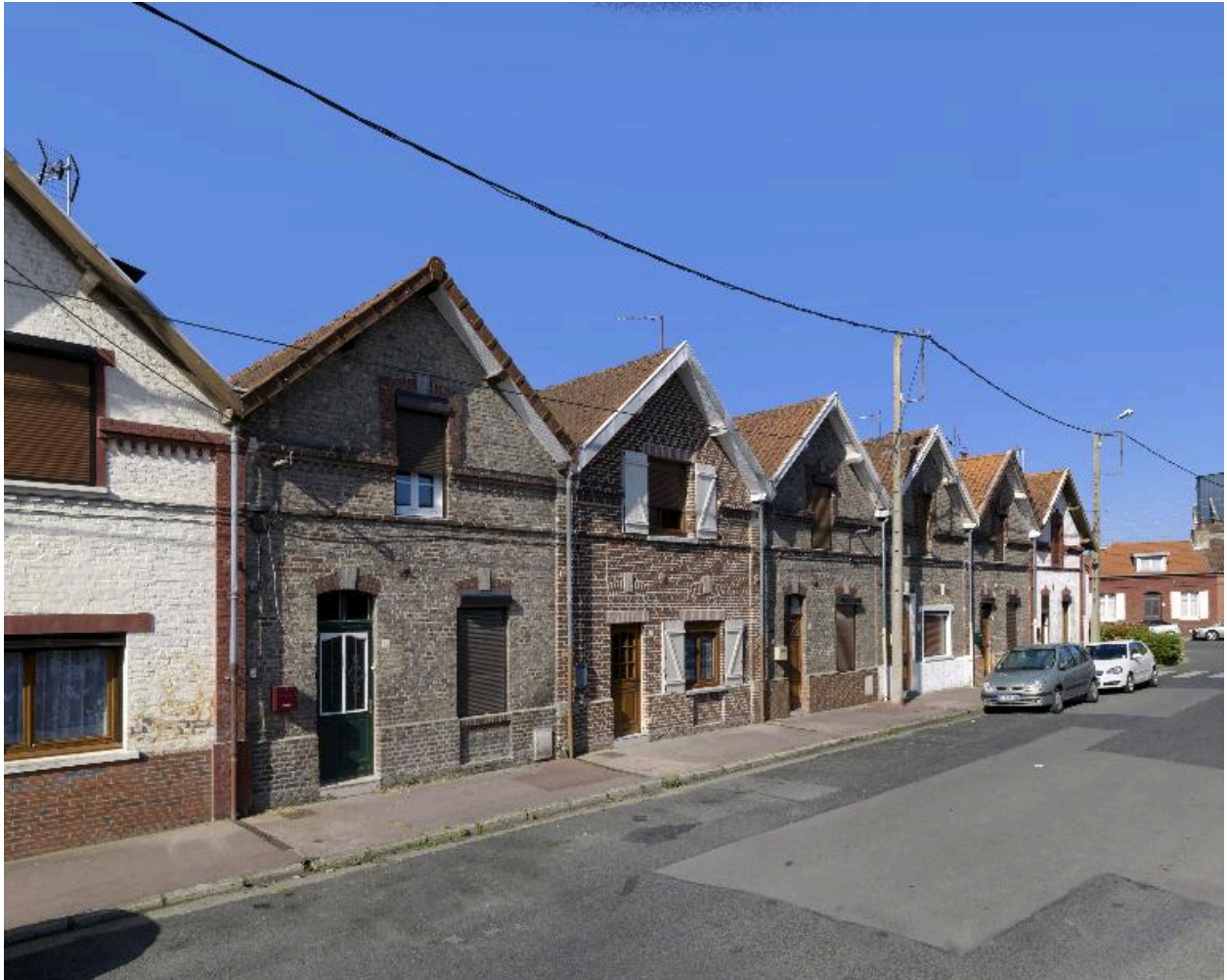
Logements ouvriers de la rue Henri-Piquet.