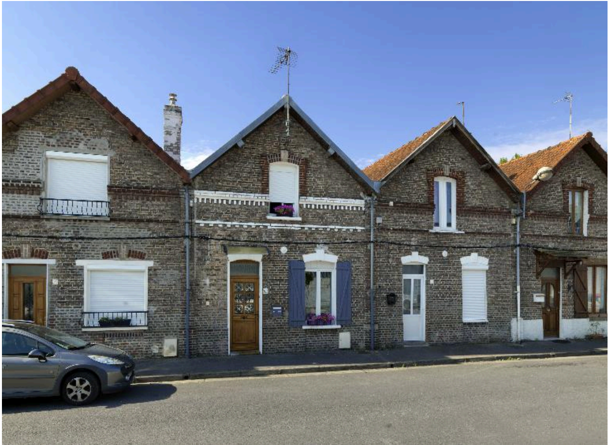
Logements ouvriers de la rue Nouvelle-Cité-Saint, façades des n° 19, 21 et 23.