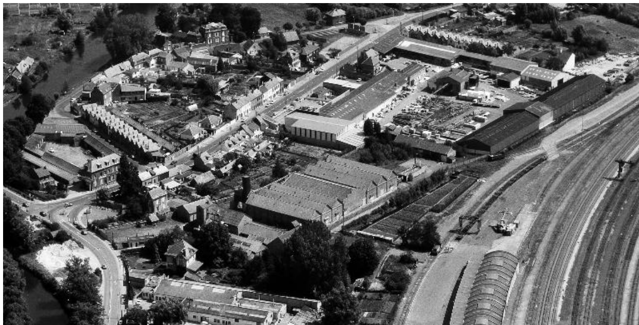
Vue aérienne générale de 1990.