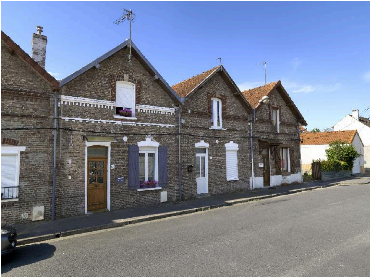
Logements ouvriers de la rue Nouvelle-Cité-Saint.