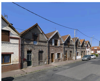
Logements ouvriers de la rue Henri-Piquet.