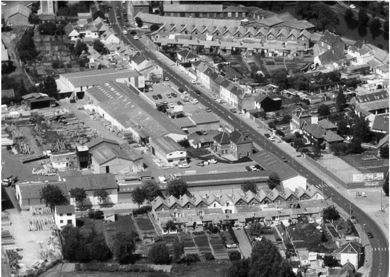
Vue aérienne générale de 1990.