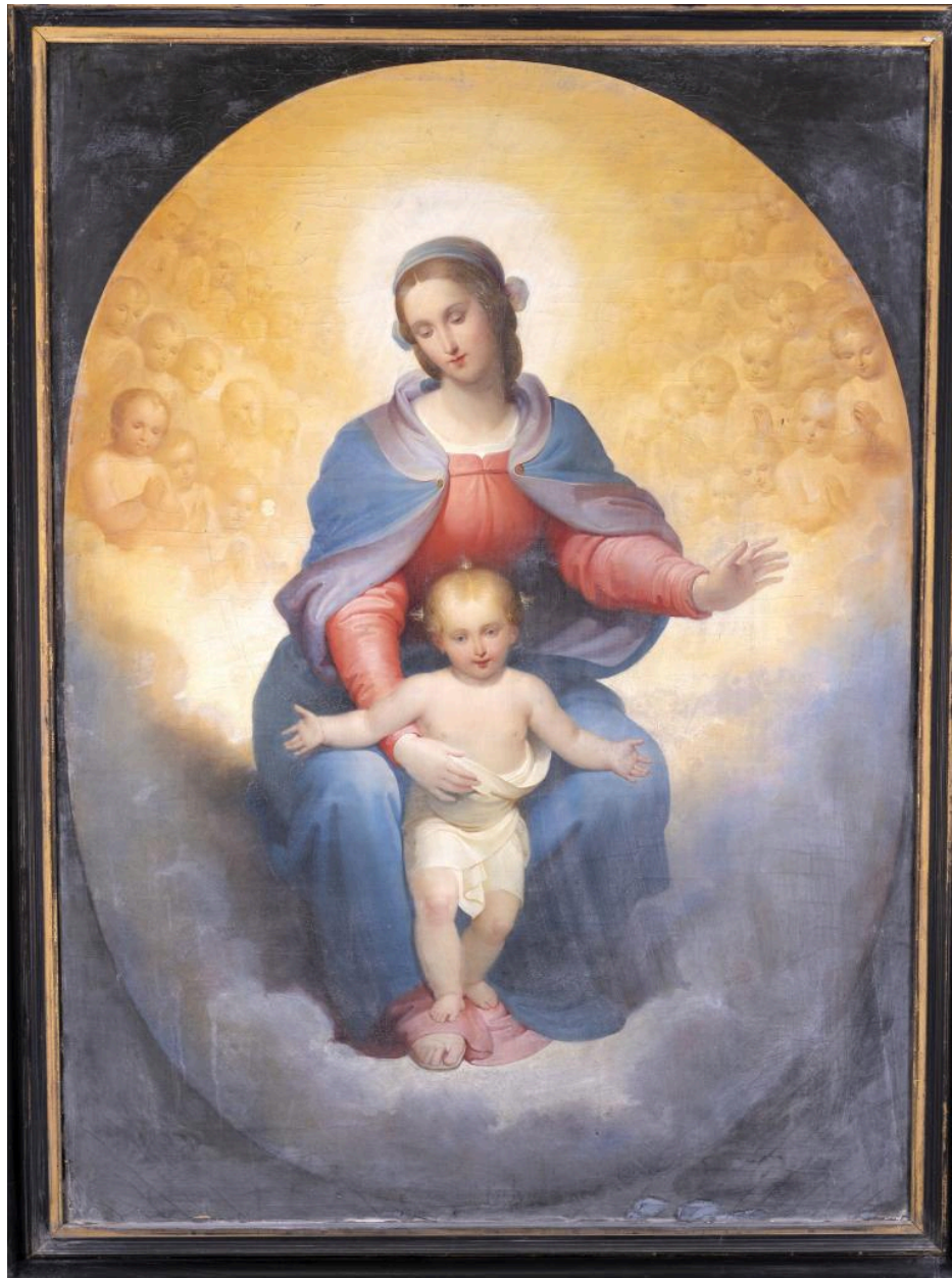
Tableau: Vierge en Majesté, huile sur toile, milieu du 19e siècle.