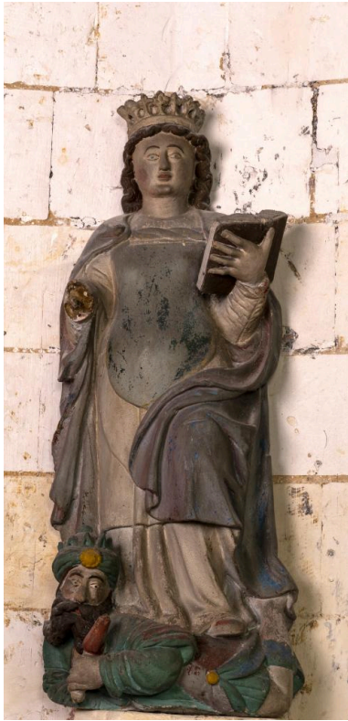
Statue de sainte Catherine, bois polychrome, 16e siècle.