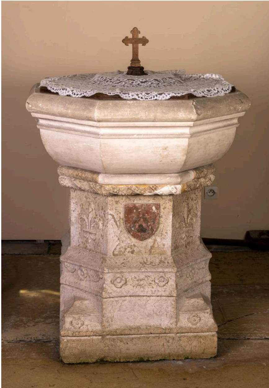
Fonts baptismaux avec blason des seigneurs de Choqueuse, pierre, limite des 15e et 16e siècles.