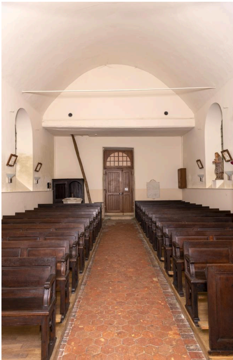
Vue intérieure de la nef.