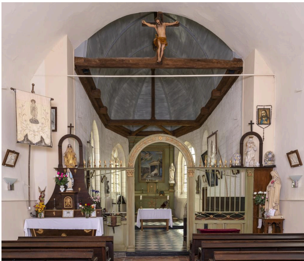
Vue du chœur.