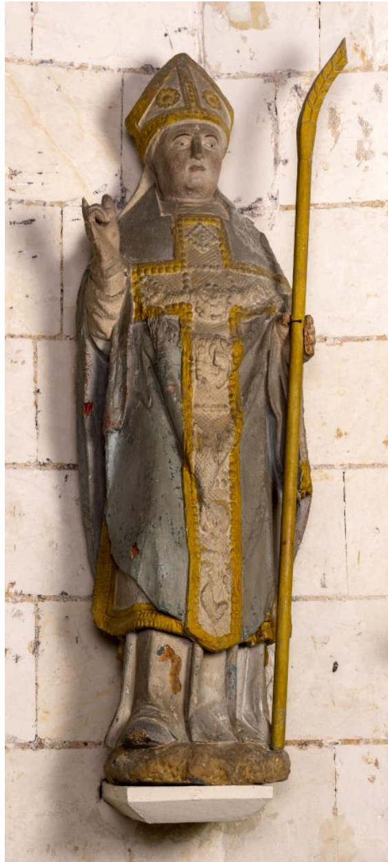
Statue de saint évêque, bois polychrome, 16e siècle.