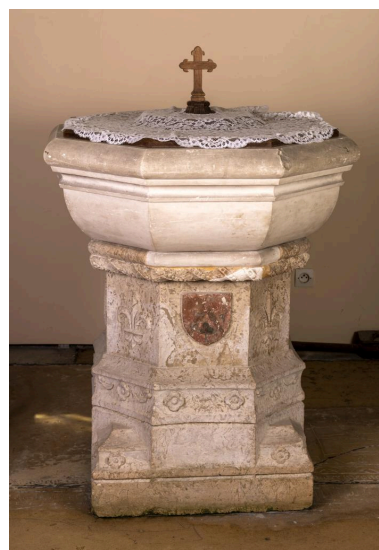
Fonts baptismaux avec blason des seigneurs de Choqueuse, pierre, limite des 15e et 16e siècles. IVR32_20216000401NUCA