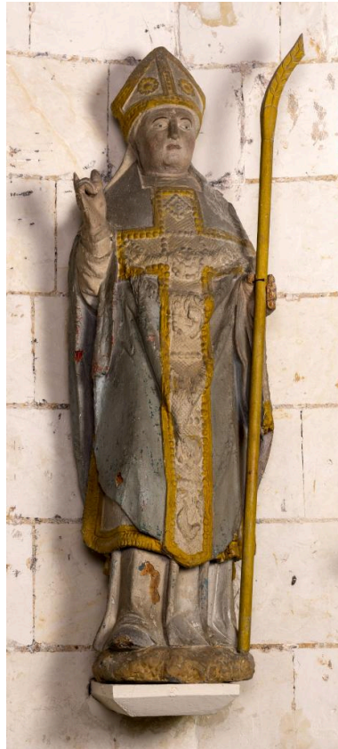
Statue de saint évêque, bois polychrome, 16e siècle.