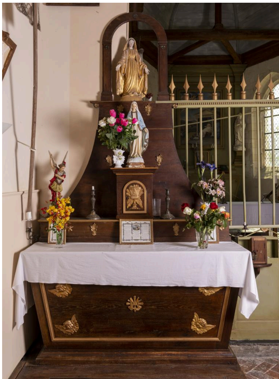
Autel secondaire de la Vierge avec tabernacle et statuette de l'Immaculée Conception, 2e quart 19e siècle.