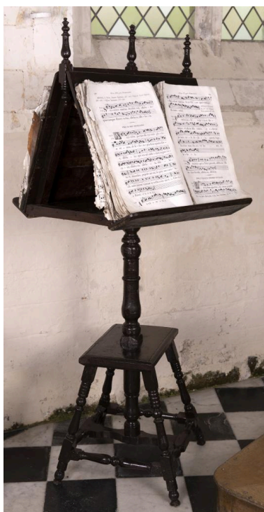
Lutrin, 17e ou 18e siècle. IVR32_20216000396NUCA