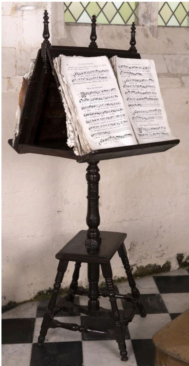
Lutrín, 17e ou 18e siècle.