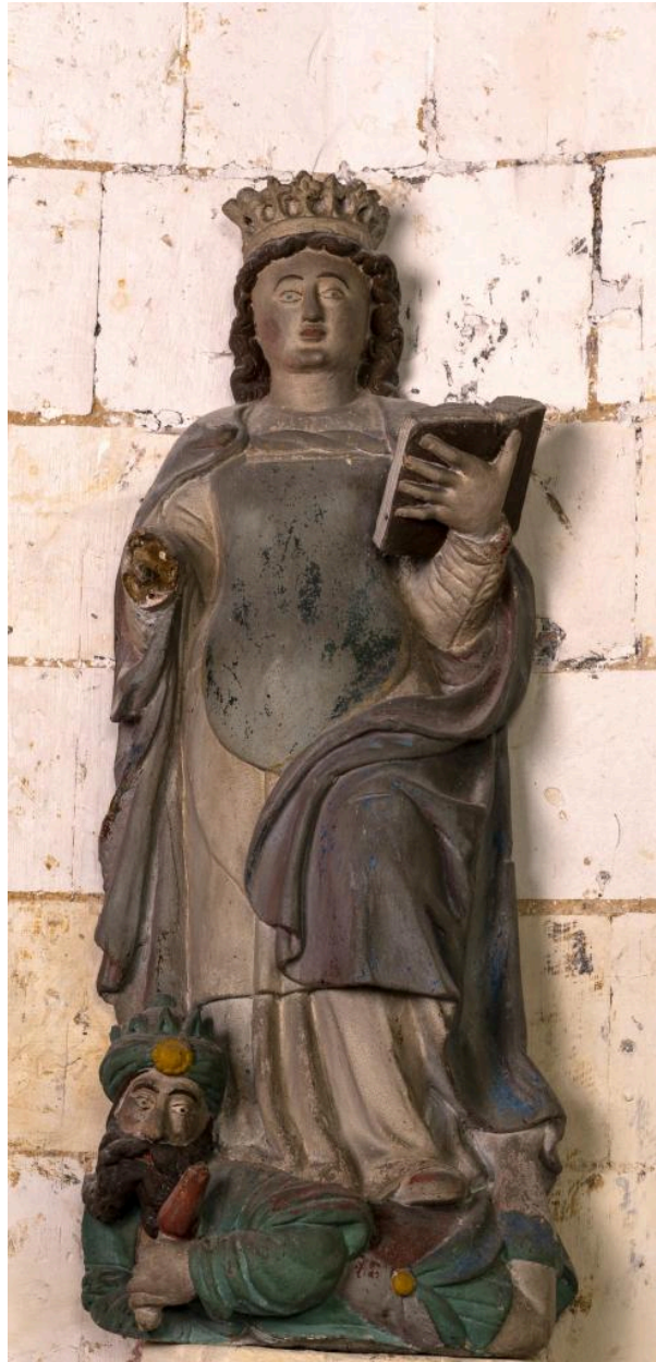
Statue de sainte Catherine, bois polychrome, 16e siècle.