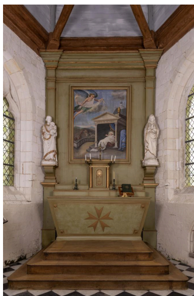
Ensemble du maître-autel avec tableau représentant une scène inspirée d'un cantique à la Vierge, 2e quart du 19e siècle.