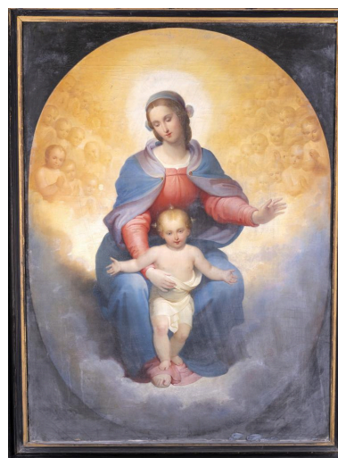
Tableau: Vierge en Majesté, huile sur toile, milieu du 19e siècle.