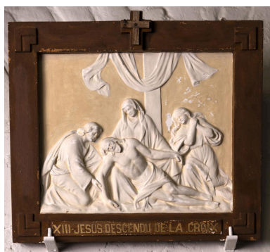
Chemin de croix, station 13: Jésus descendu de la croix, cadre en bois et bas-relief en plâtre, premier quart du 20e siècle.