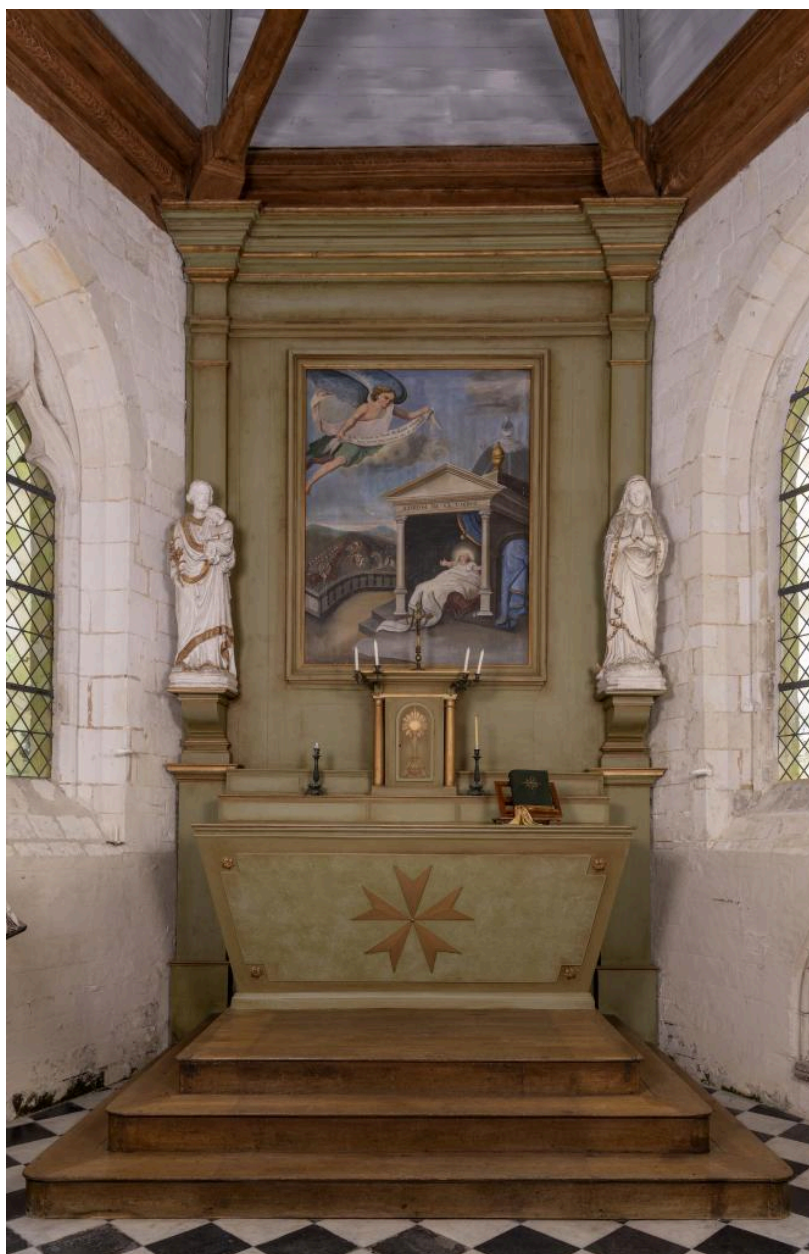
Ensemble du maître-autel avec tableau représentant une scène inspirée d'un cantique à la Vierge, 2e quart du 19e siècle.