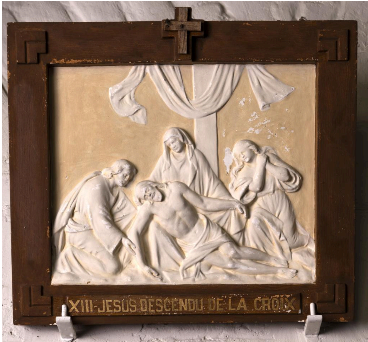
Chemin de croix, station 13: Jésus descendu de la croix, cadre en bois et bas-relief en plâtre, premier quart du 20e siècle.