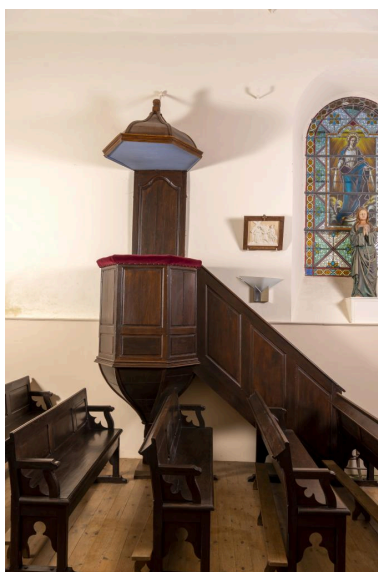
Chaire à prêcher, 1ère moitié du 19e siècle. IVR32_20216000400NUCA