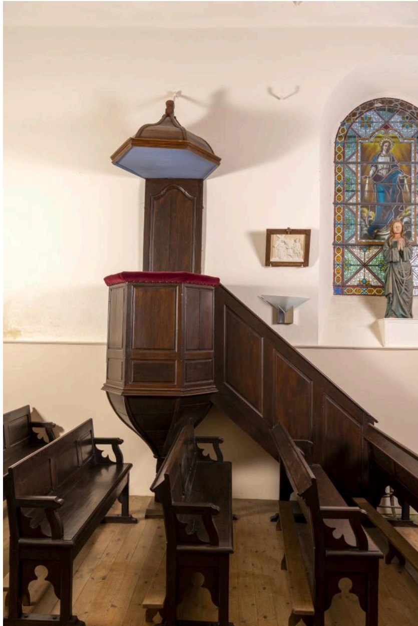
Chaire à prêcher, 1ère moitié du 19e siècle.