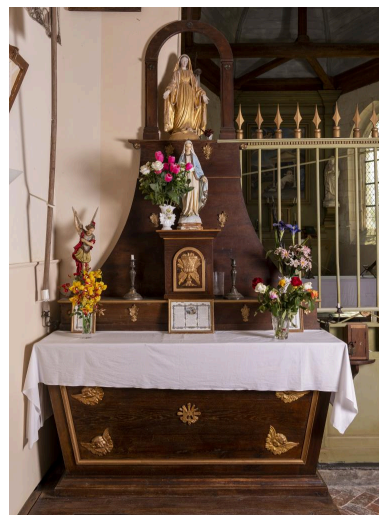
Autel secondaire de la Vierge avec tabernacle et statuette de l'Immaculée Conception, 2e quart 19e siècle. IVR32_20216000474NUCA