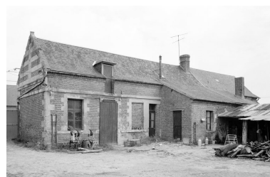
Logis. Elévation sur cour. IVR22_19846000965X