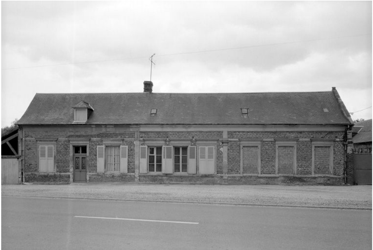
Logis. Elévation sur rue.