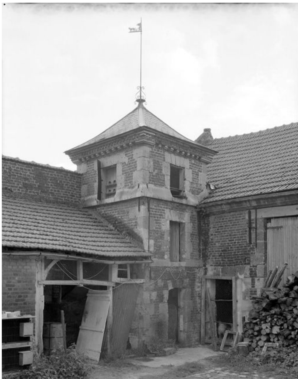
Pigeonnier. Vue générale.