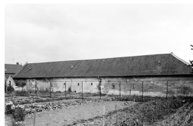
Etable et remise. Elévations extérieures, du côté droit de la cour. IVR22_19846000973X