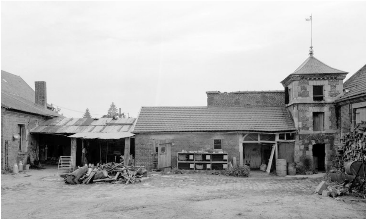
Vue partielle de la cour, côté gauche.