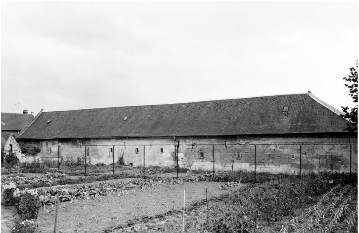
Etable et remise. Elévations extérieures, du côté droit de la cour.