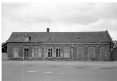
Logis. Elévation sur rue.