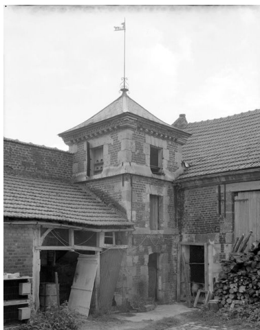
Pigeonnier. Vue générale. IVR22_19846000956V