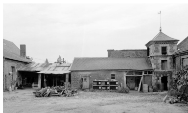
Vue partielle de la cour, côté gauche.