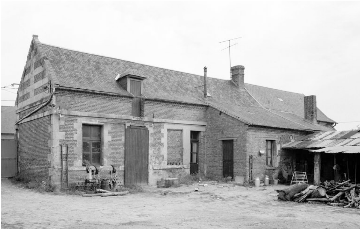
Logis. Elévation sur cour.