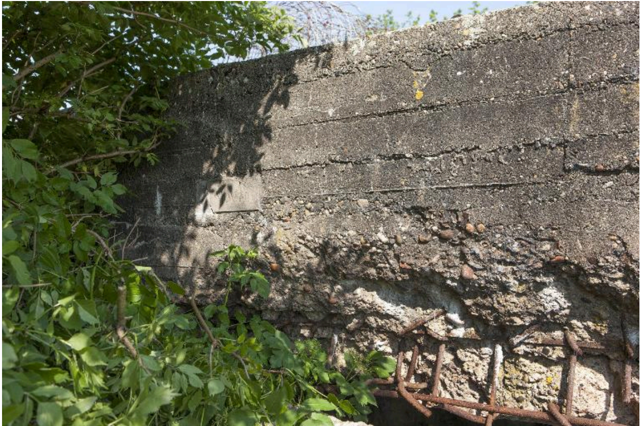
Partie de l'élévation sud