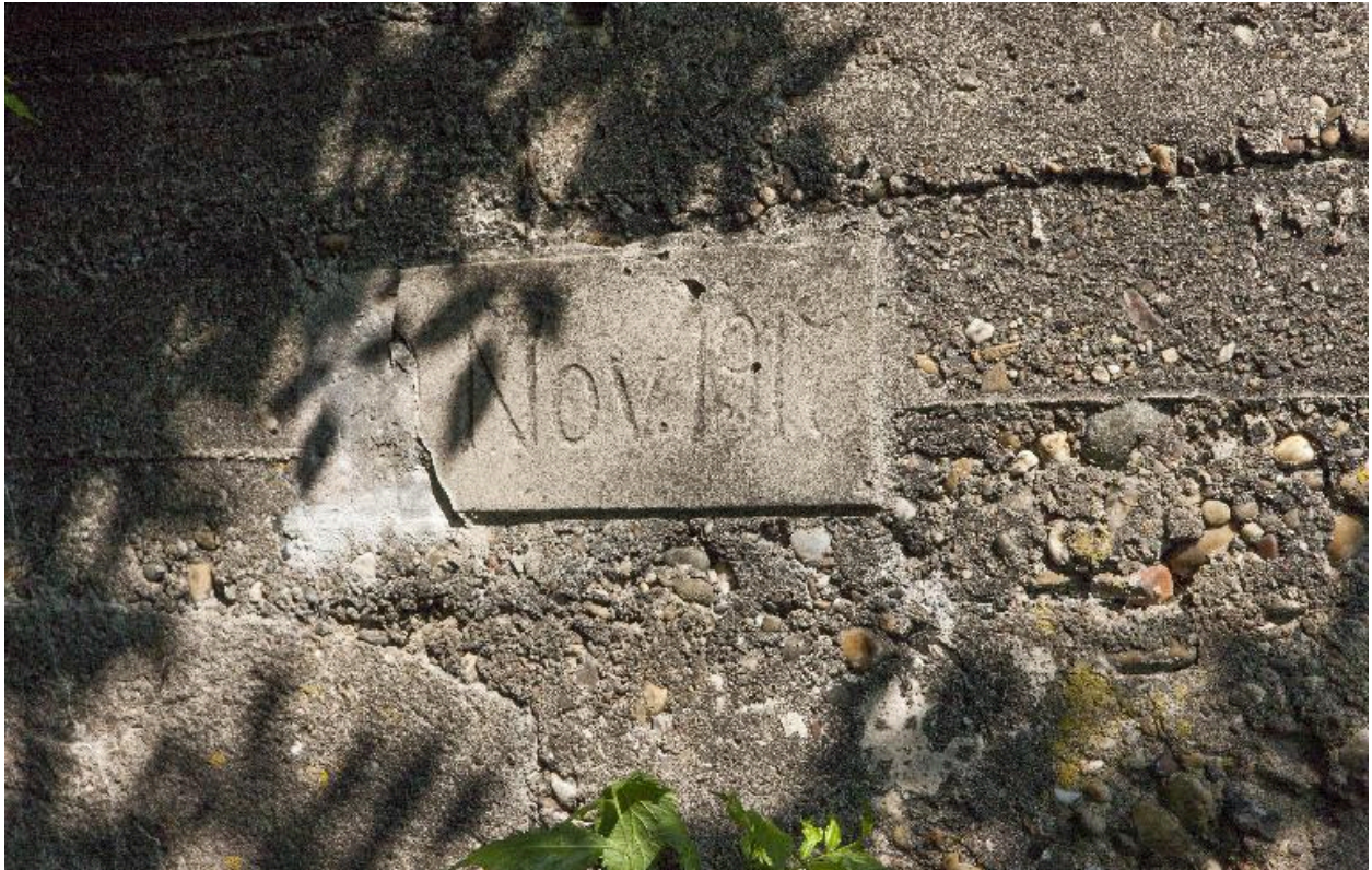
Date portée, sur l'élévation sud