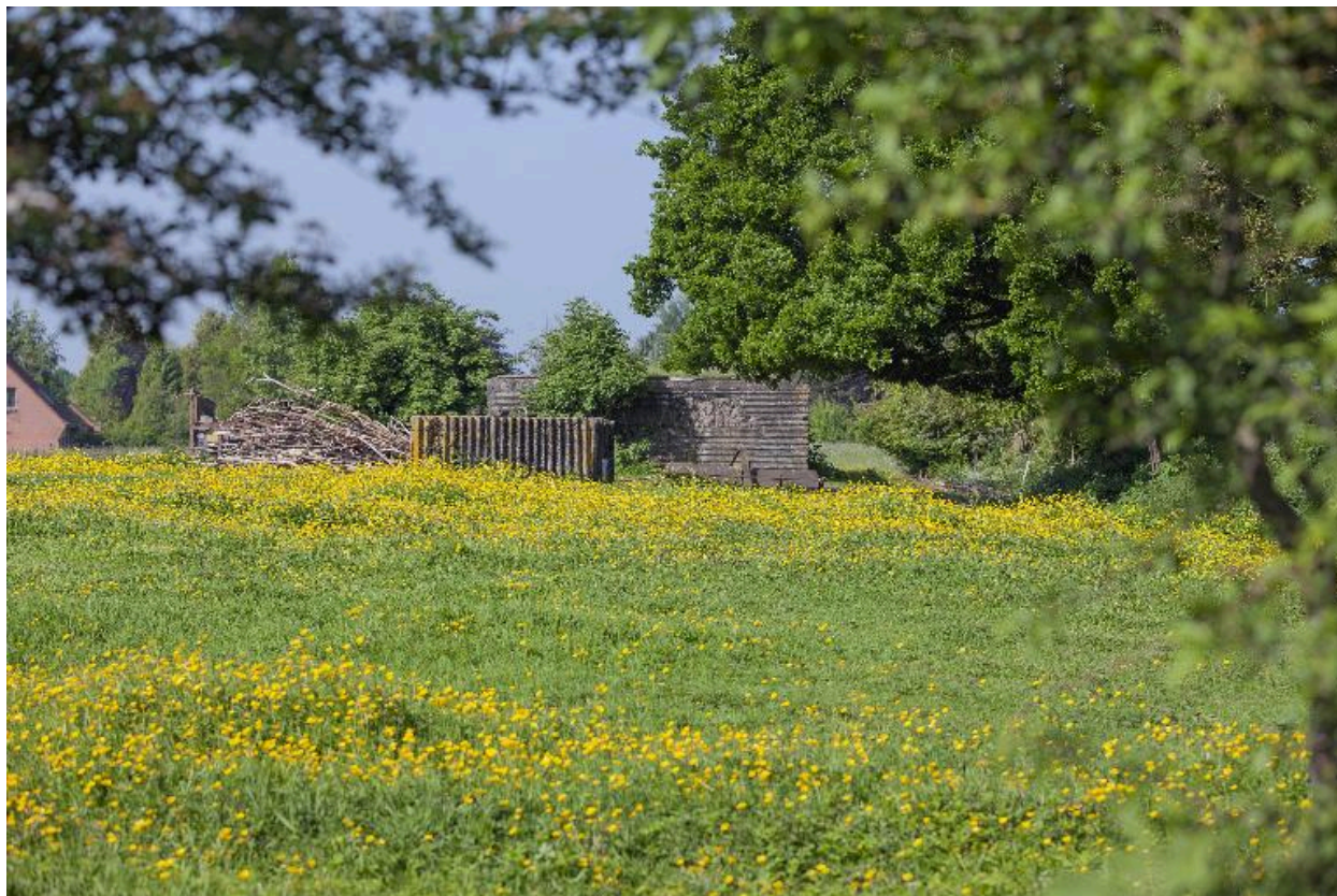
Vue générale, vers l'ouest.