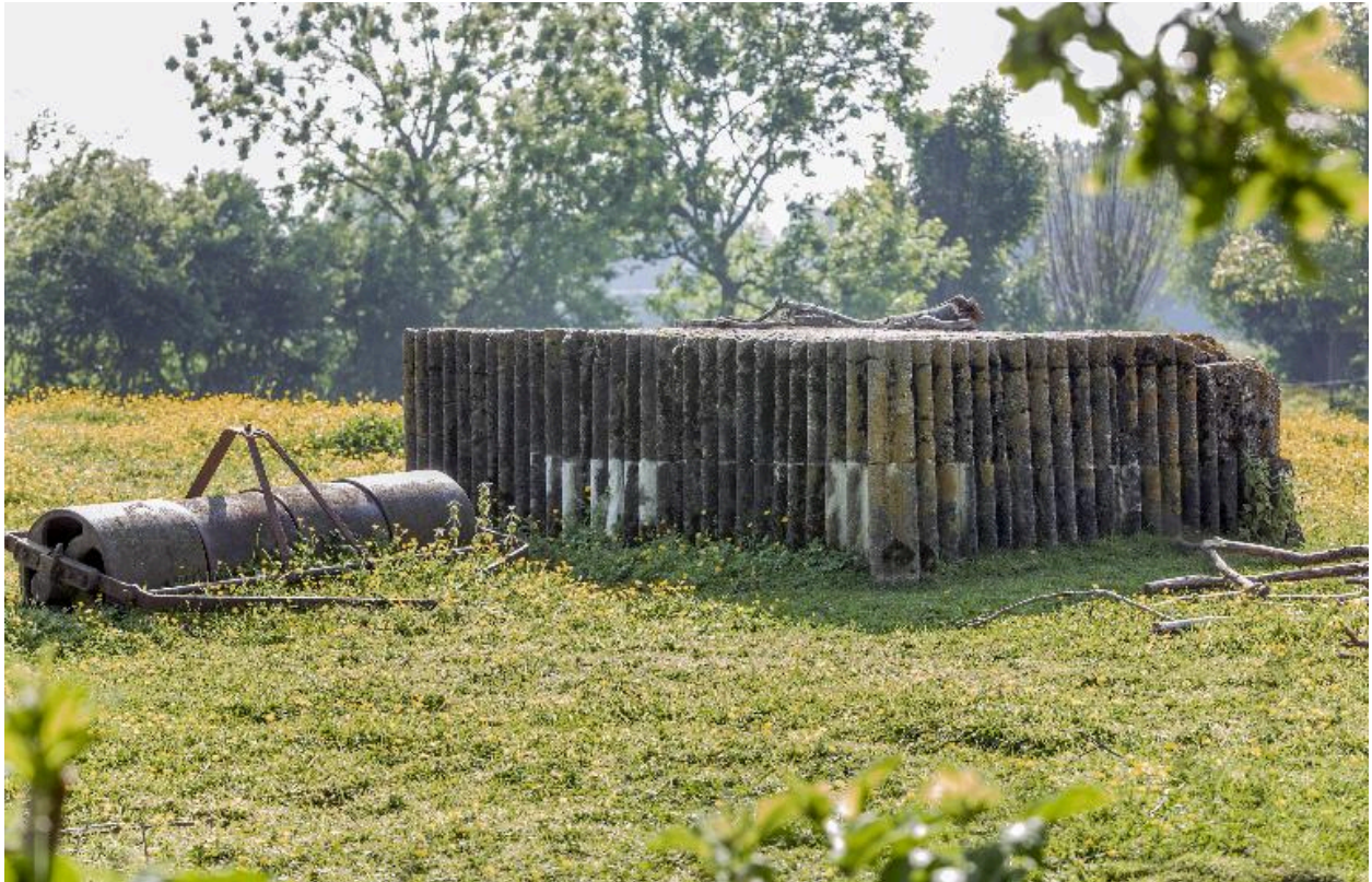
Vue arrière de l'édicule, vers le sud-ouest