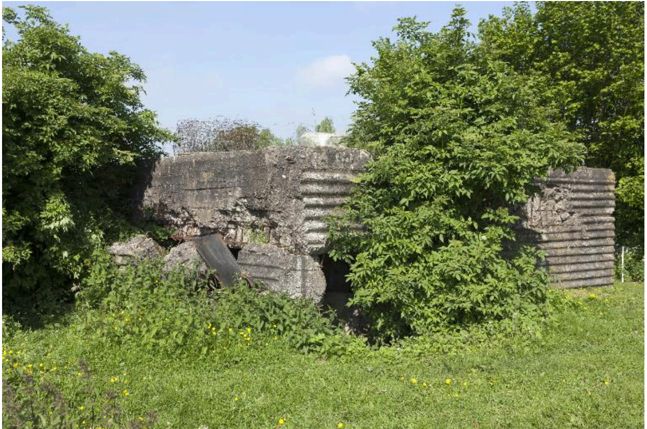
Vue de trois-quarts vers nord-ouest de la casemate dynamitée