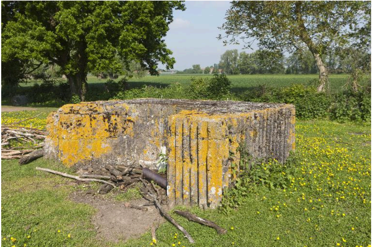
Edicule vers le nord-ouest