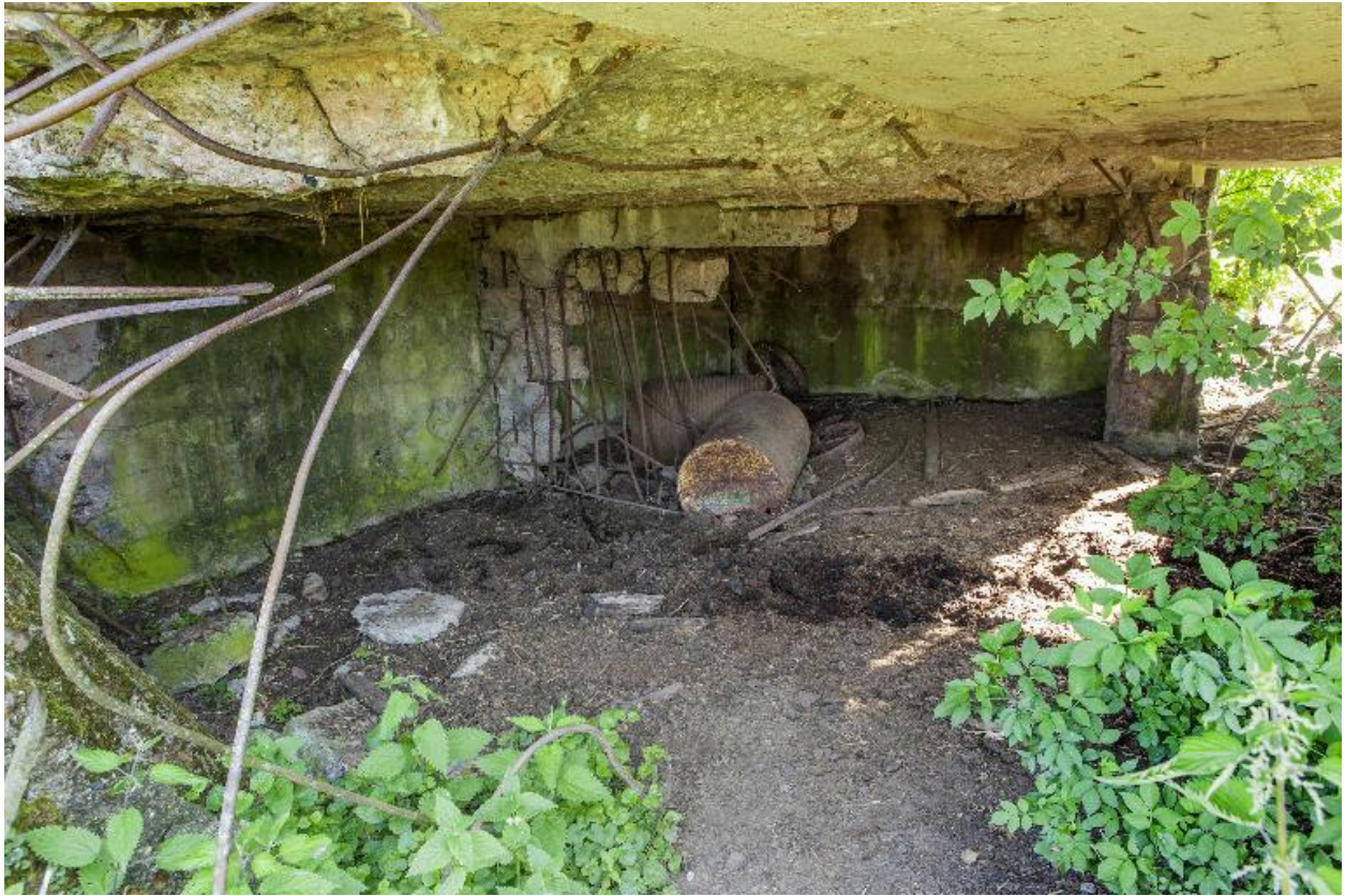
Vue intérieure vers le nord