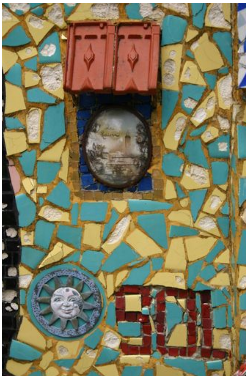
Détail du décor (soleil en mosaïque, photo en médaillon).