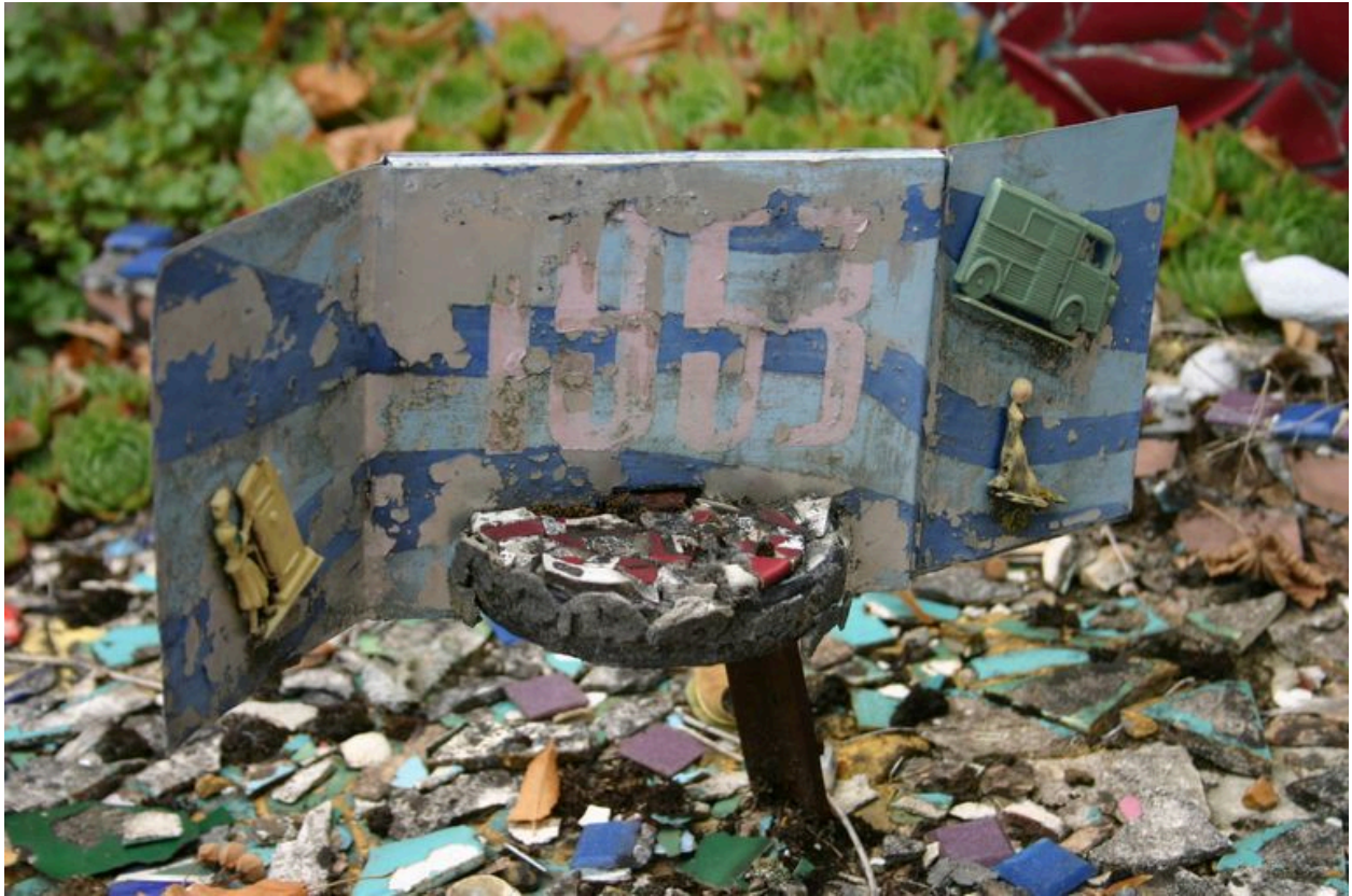
Détail du décor : année 1953.