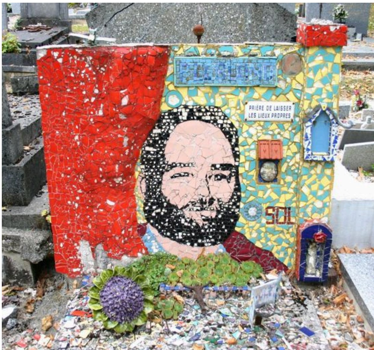
Détail du décor de mosaïques.