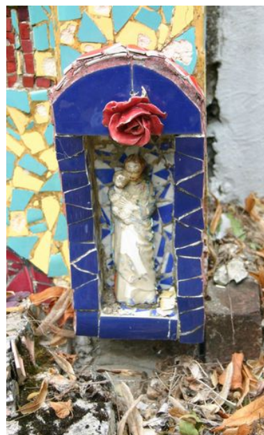
Détail du décor : Vierge à l'Enfant.