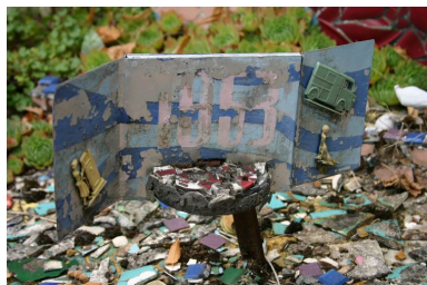
Détail du décor : année 1953.