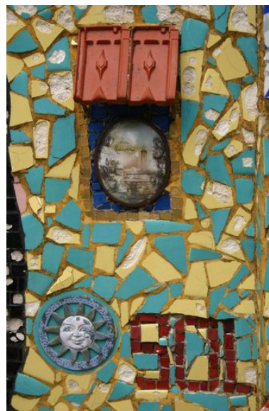
Détail du décor (soleil en mosaïque, photo en médaillon).