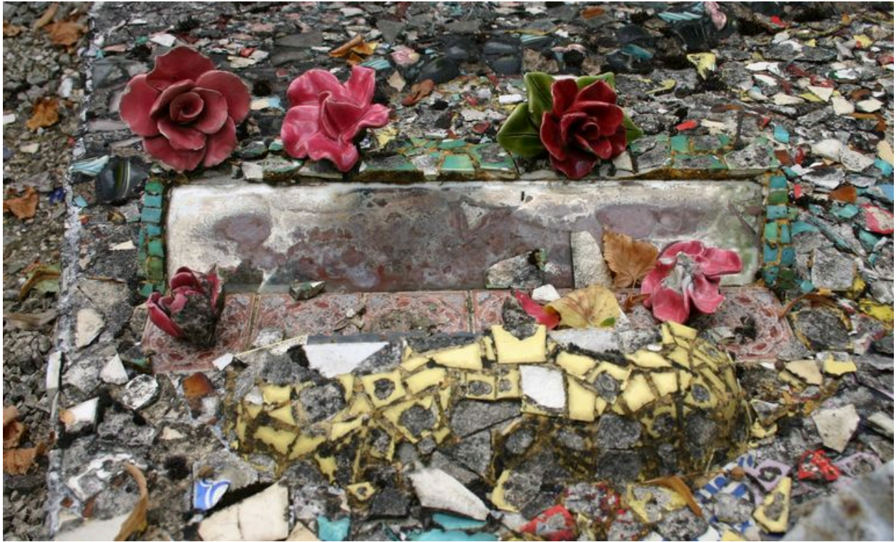
Détail du décor : miroir.