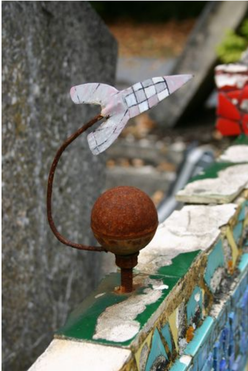
Détail du décor : fusée.