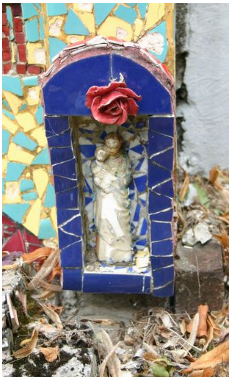
Détail du décor : Vierge à l'Enfant.