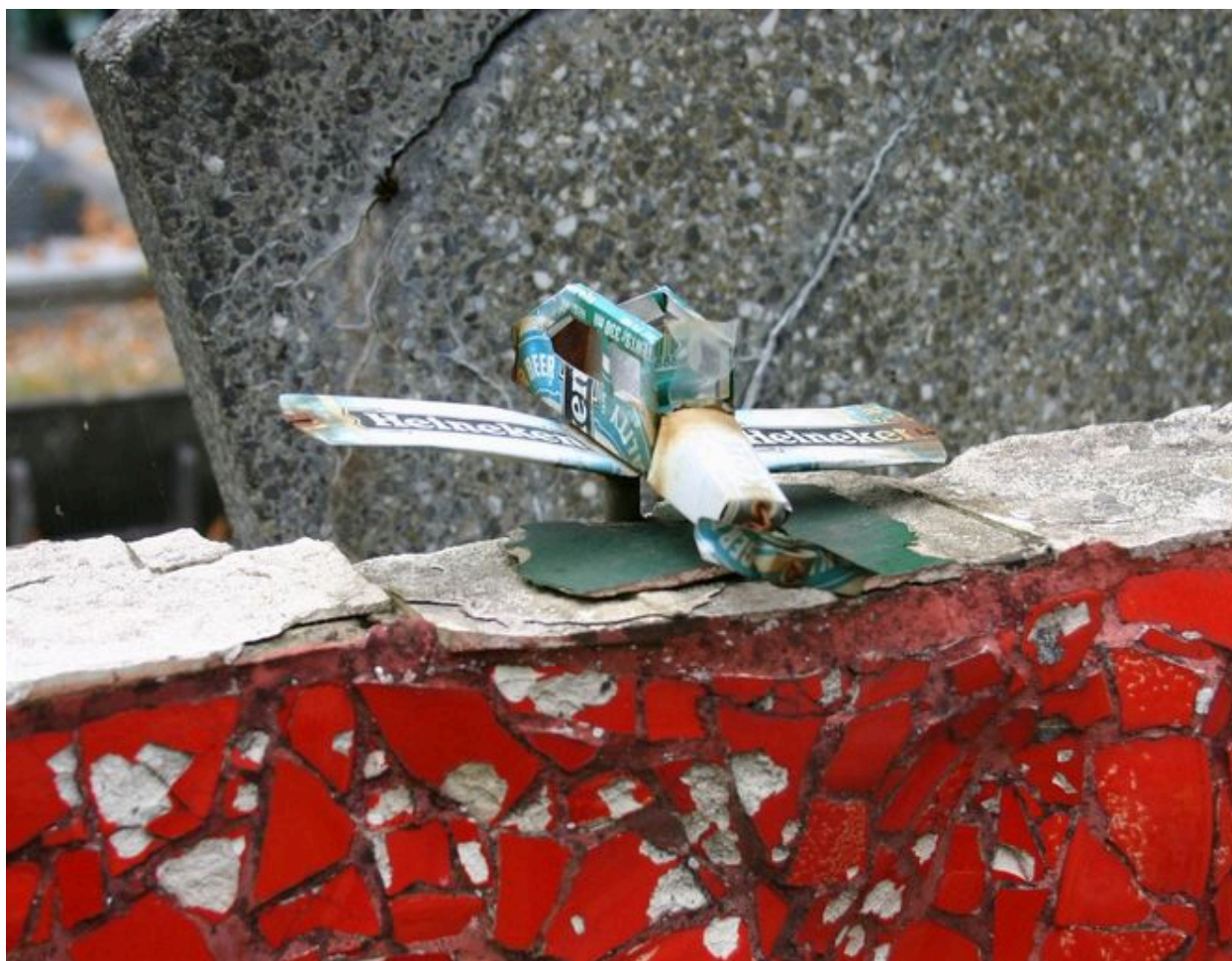
Détail du décor : avion métallique.