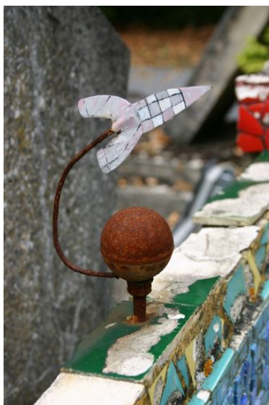
Détail du décor : fusée.