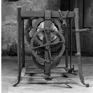
Vue latérale du mécanisme (côté du cadran).