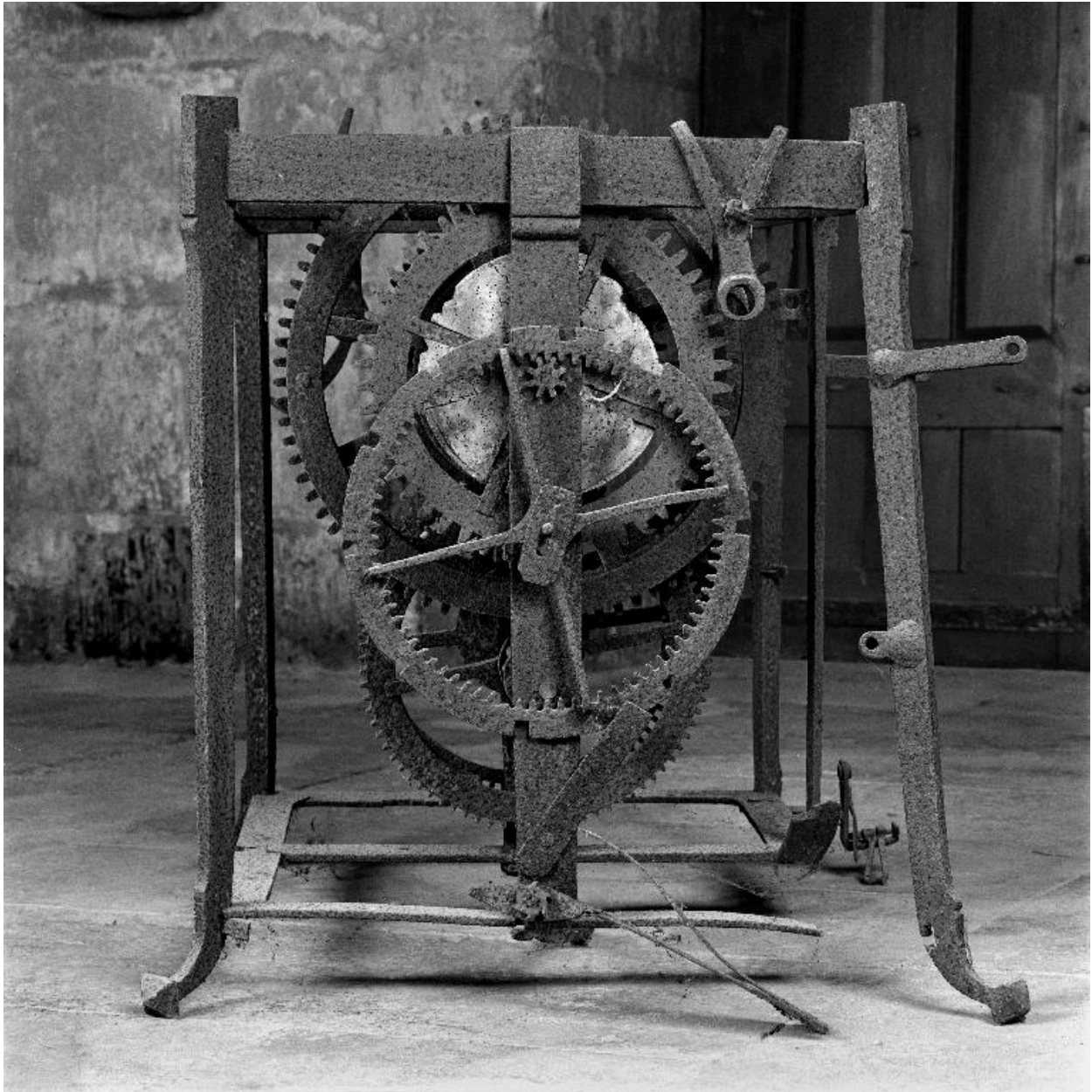
Vue latérale du mécanisme (côté du cadran).