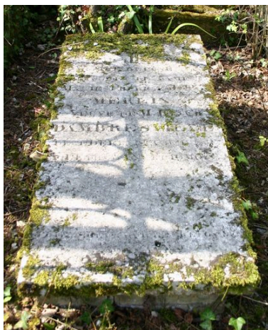
Dalle funéraire couchée sur un soubassement en briques.

Phot. Caroline Vincent IVR22_20068000779NUCA