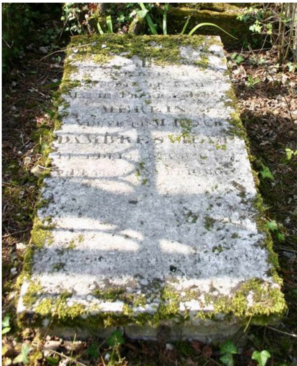
Dalle funéraire couchée sur un soubassement en briques.