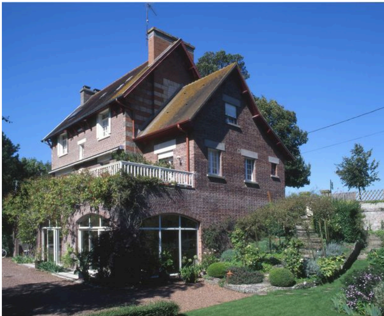
Vue de trois-quarts.