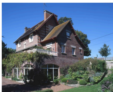
Vue de trois-quarts.

Phot. Marie-Laure Monnehay-Vulliet IVR22_20048000318XA