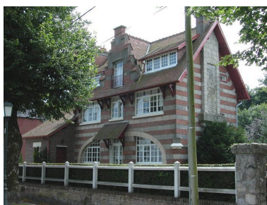
Vue d'ensemble depuis la digue.

IVR22_20058001734XA