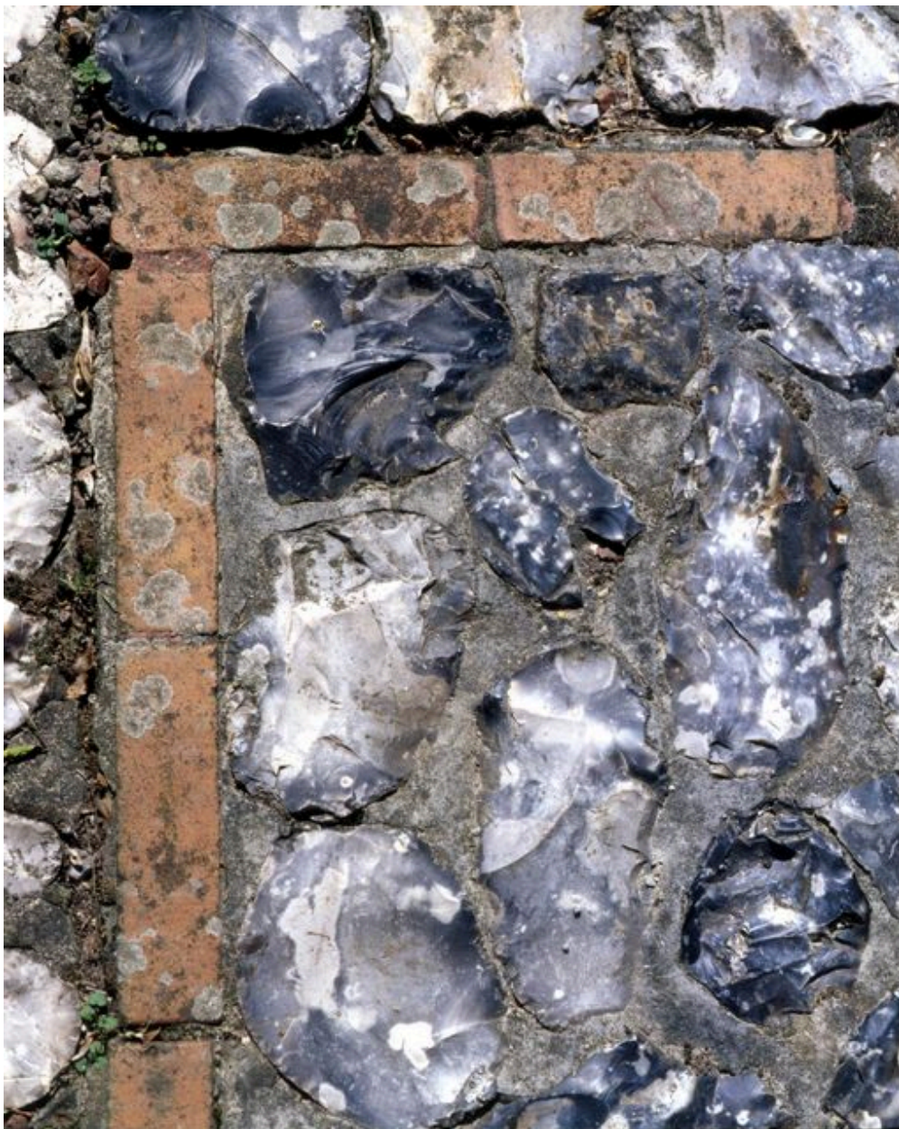
Détail de la mise en oeuvre de l'escalier menant au jardin (rognons de silex).