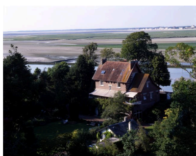
Vue de situation.

IVR22_20058001734XA