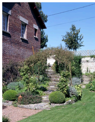
Escalier d'accès au jardin.

IVR22_20048000320XA