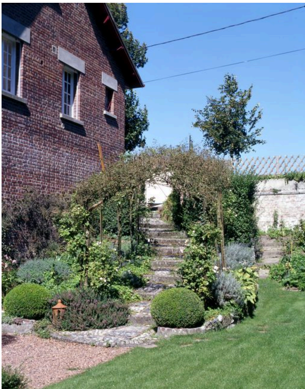
Escalier d'accès au jardin.