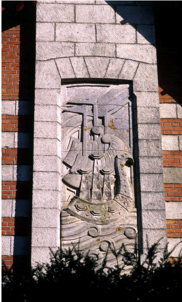
Détail du décor sculpté.