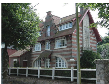
Vue d'ensemble depuis la digue.

IVR22_20058001734XA