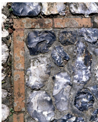
Détail du décor sculpté. IVR22_20058001750XA