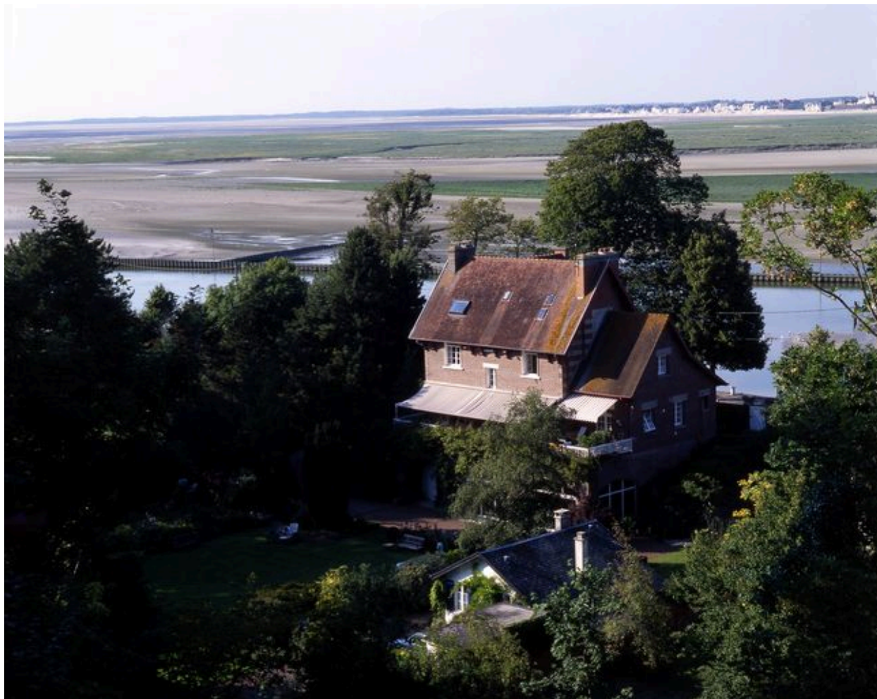
Vue de situation.