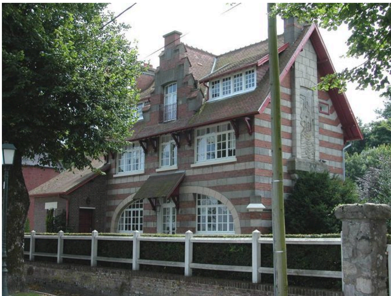
Vue d'ensemble depuis la digue.