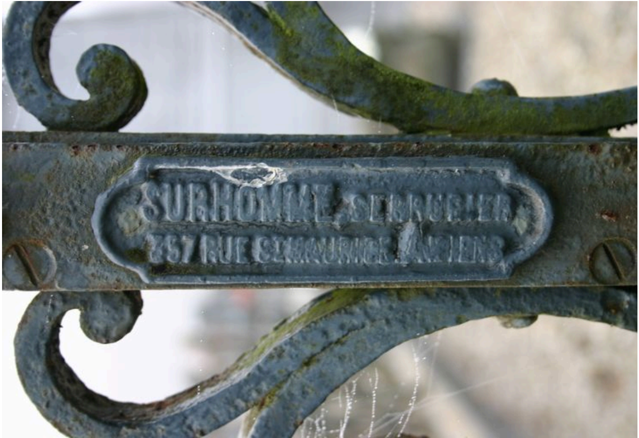
Portillon de clôture : signature du serrurier Surhomme.