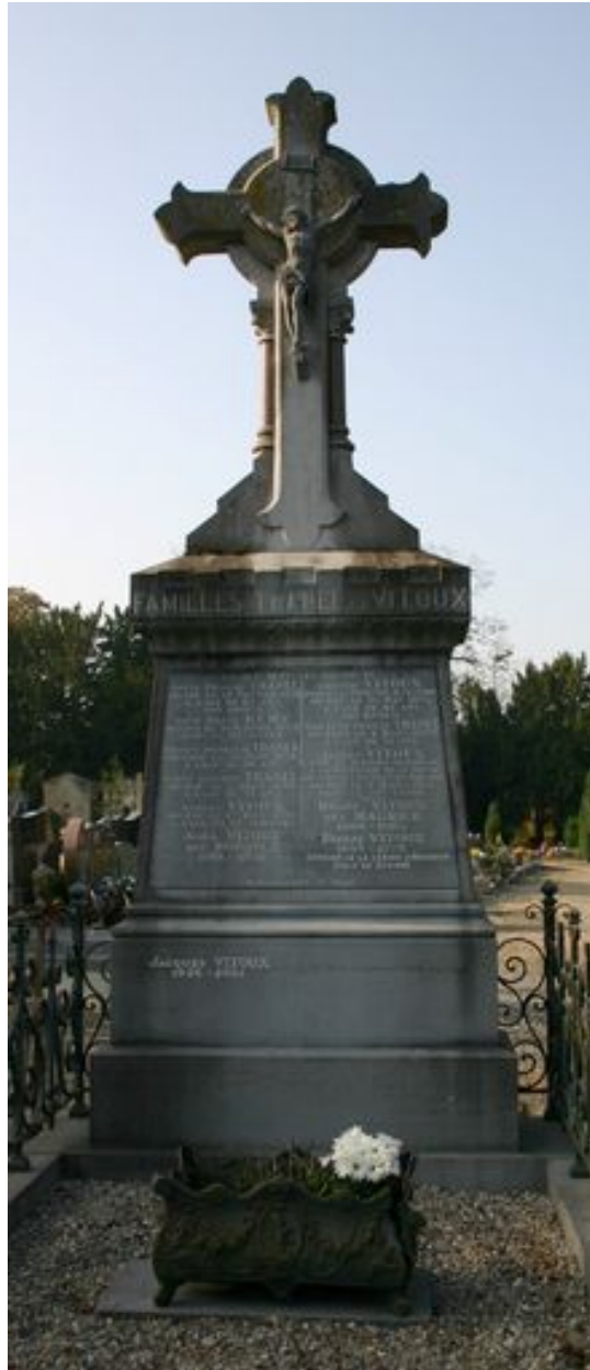
Stèle à croix.