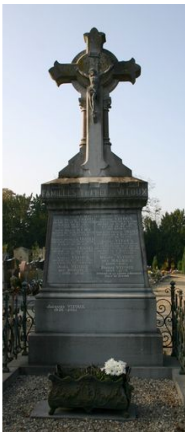
Stèle à croix.