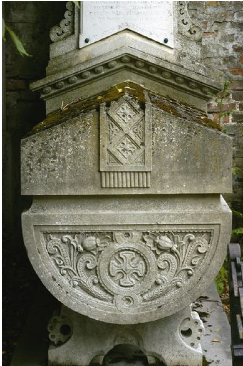
Sarcophage, vu de face.