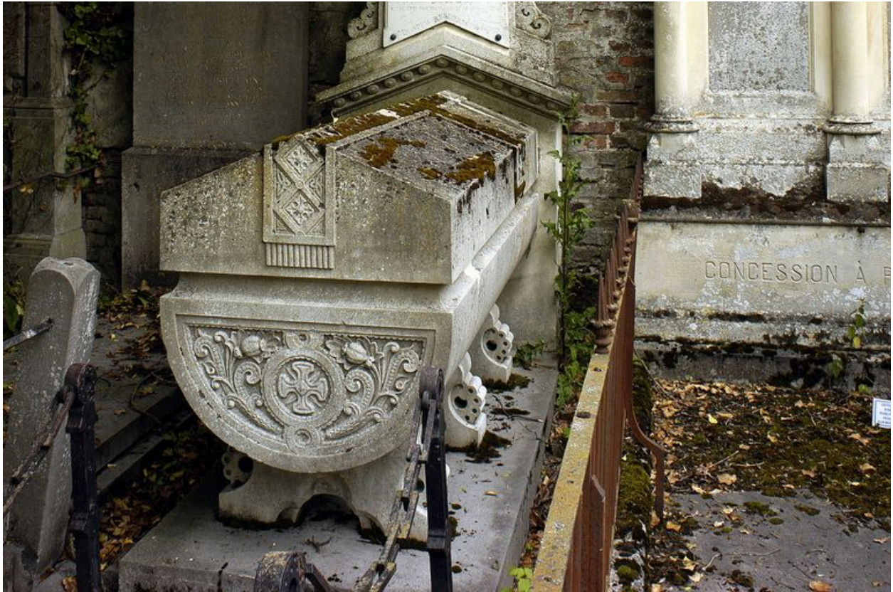
Sarcophage, vu de trois-quarts.