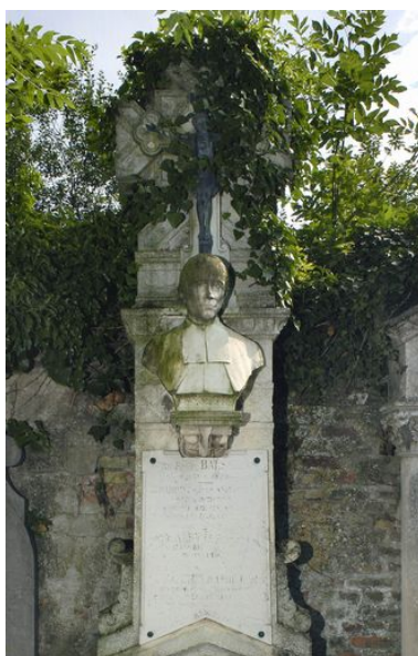
Vue de la stèle avec la statue.