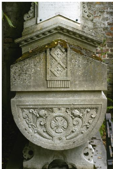
Sarcophage, vu de face.