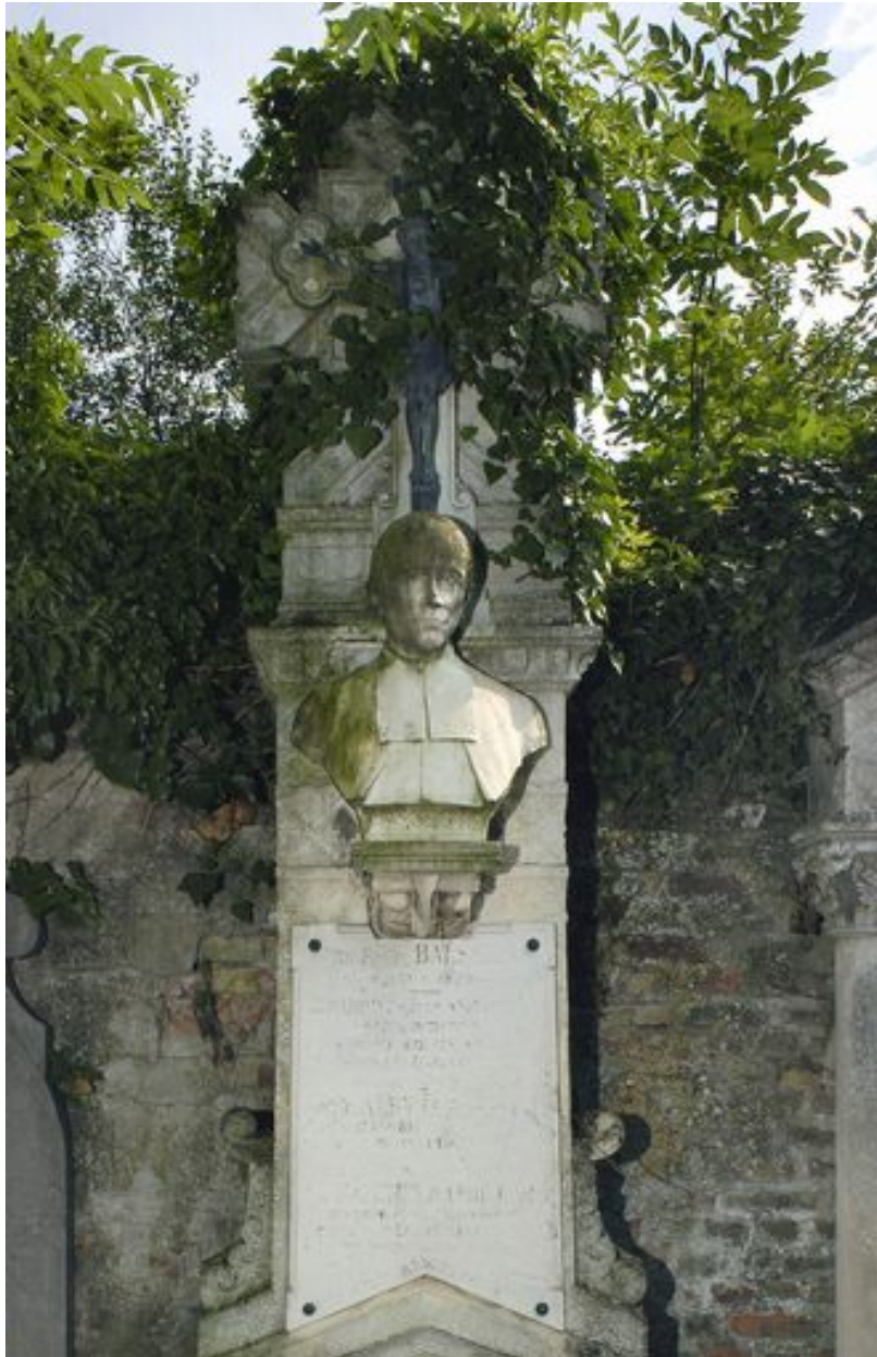
Vue de la stèle avec la statue.