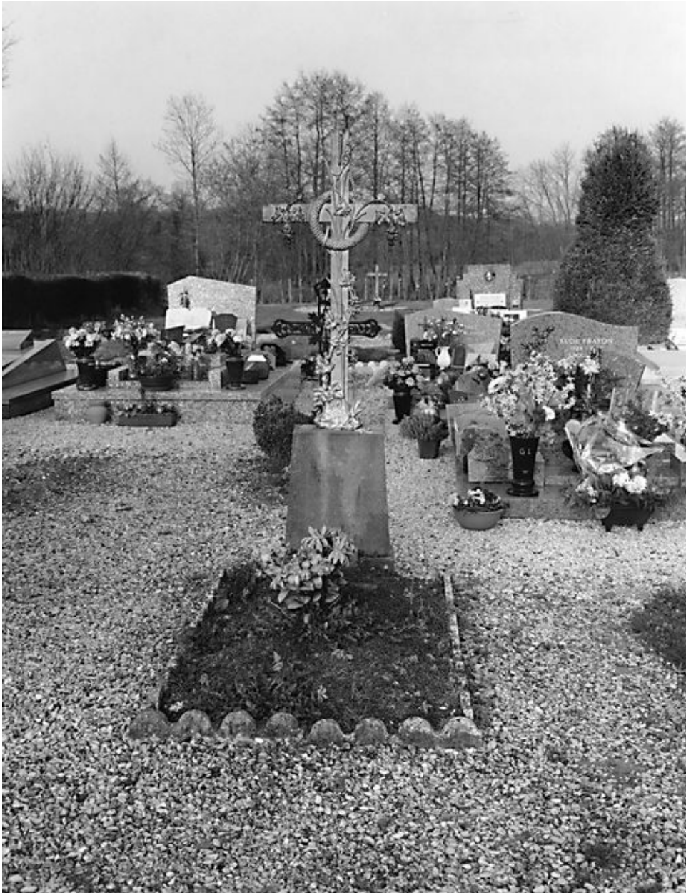
Tombeau de la famille Loiseau, vers 1887.