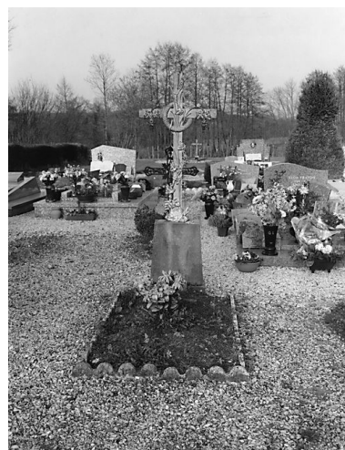
Tombeau de la famille Loiseau, vers 1887. IVR22_19990201218X