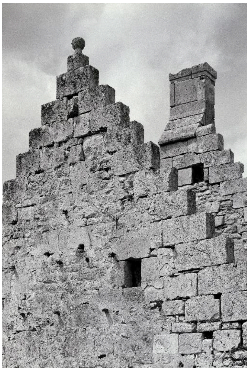
Détail de pignons à redents, à Vivières.