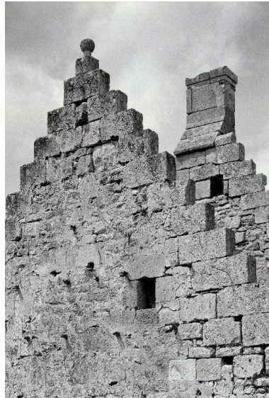
Détail de pignons à redents, à Vivières. IVR22_19860200430X

IVR22_19860200369V