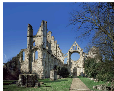
Vue intérieure des ruines de l'église de l'abbaye cistercienne de Longpont. IVR22_19860200394VA