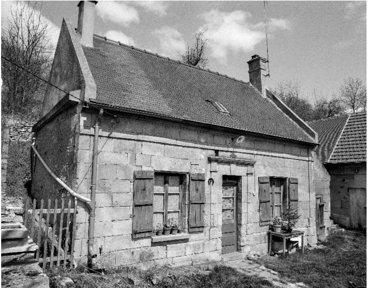
Façade d'une maison à Retheuil (25 rue de la Rouillée).