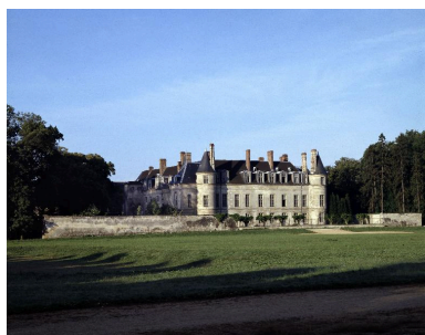
Vue du château de Villers-Cotterêts, depuis le Petit Parc.