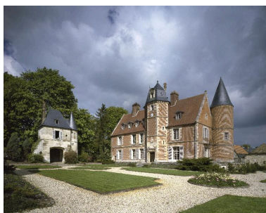
Vue du château d'Oigny-en-Valois et de l'ouvrage d'entrée, depuis la cour.