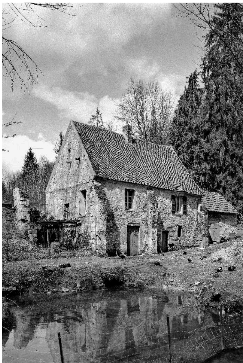
Vue du moulin de Fleury.