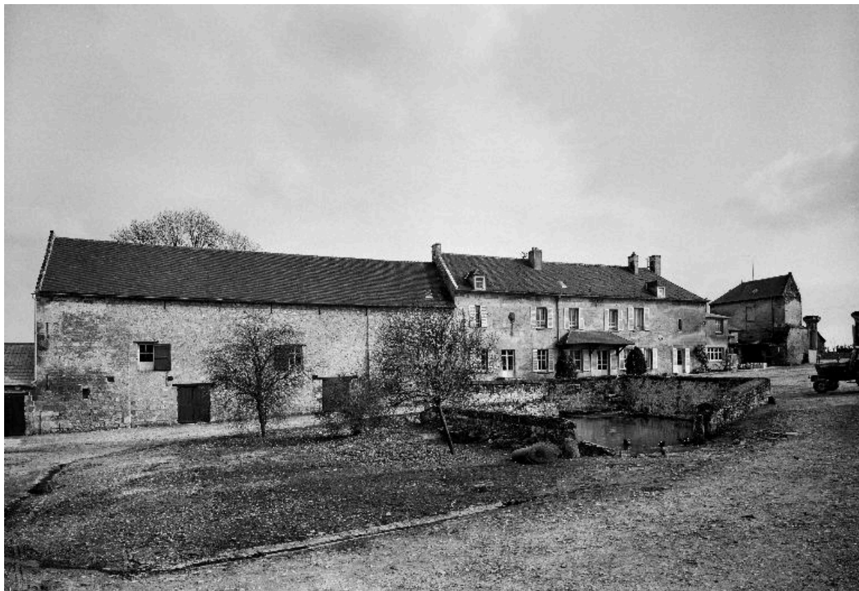
Ferme à Soucy : vue de l'élévation sur cour du logis et de l'étable attenante.