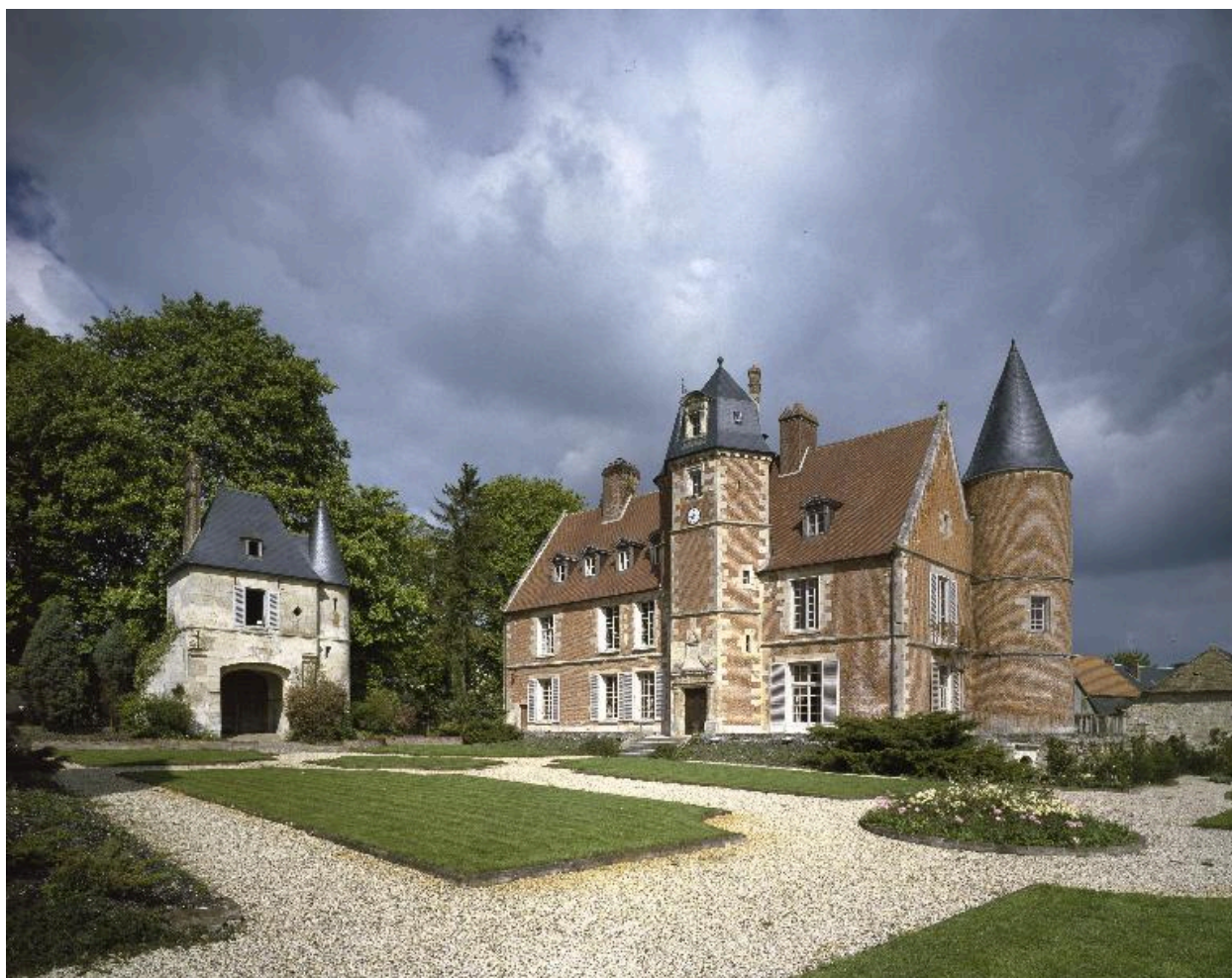
Vue du château d'Oigny-en-Valois et de l'ouvrage d'entrée, depuis la cour.