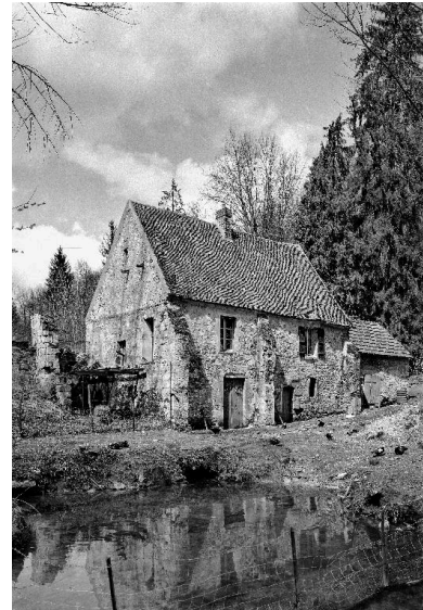
Vue du moulin de Fleury.