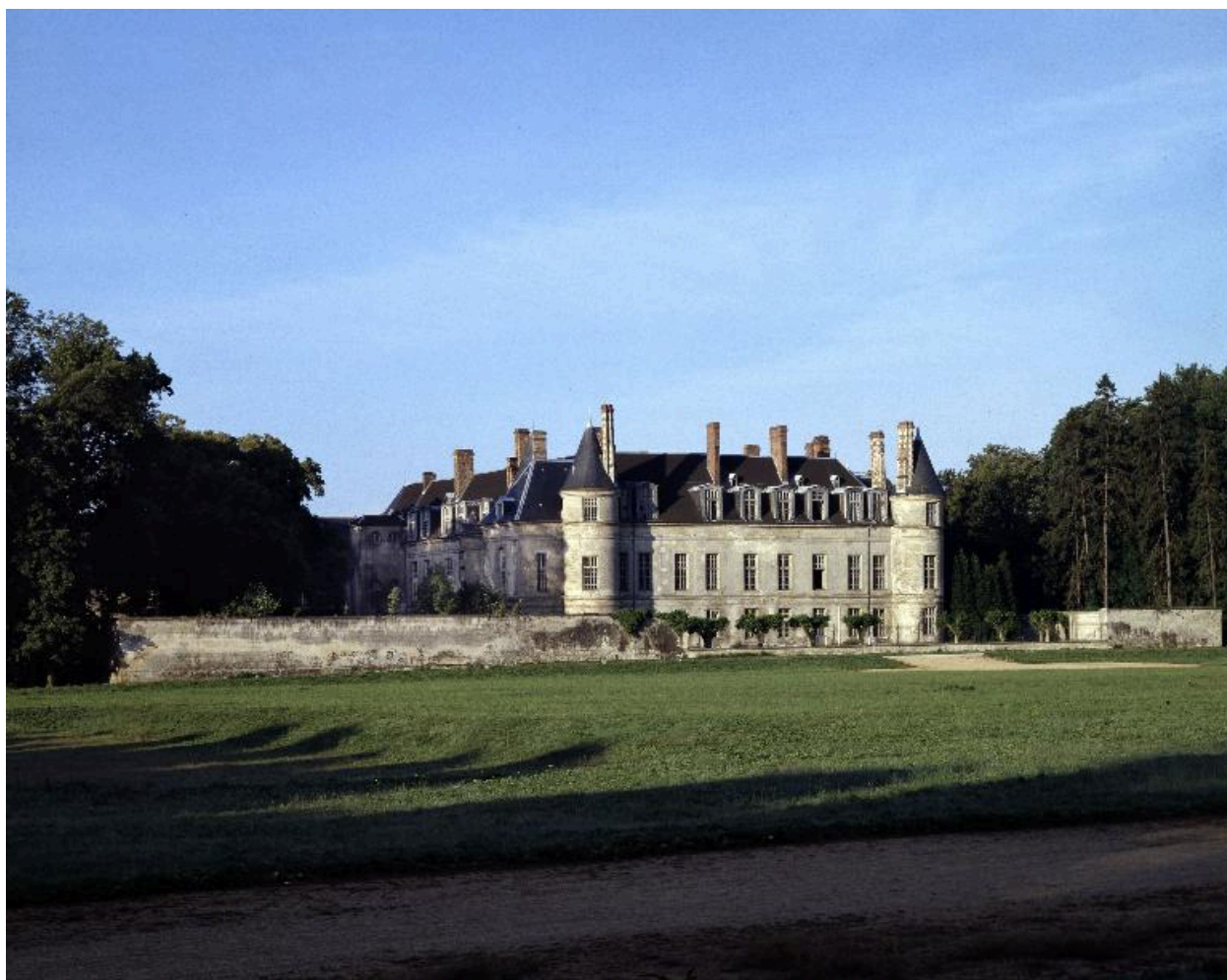
Vue du château de Villers-Cotterêts, depuis le Petit Parc.