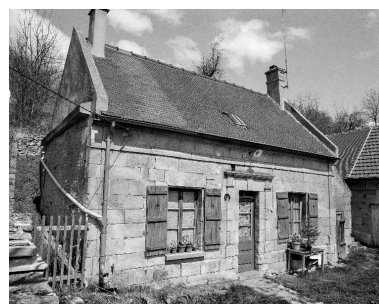
Façade d'une maison à Retheuil (25 rue de la Rouillée). IVR22_19860200324X