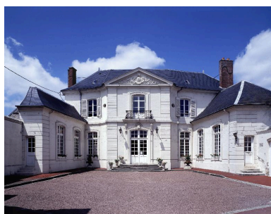
Façade de l'ancien logis abbatial prémontré de Villers-Cotterêts, servant actuellement d'hôtel de ville.