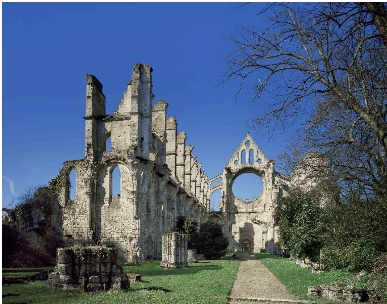
Vue intérieure des ruines de l'église de l'abbaye cistercienne de Longpont.