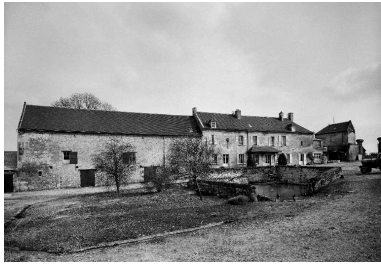
Ferme à Soucy : vue de l'élévation sur cour du logis et de l'étable attenante.

IVR22_19860200369V