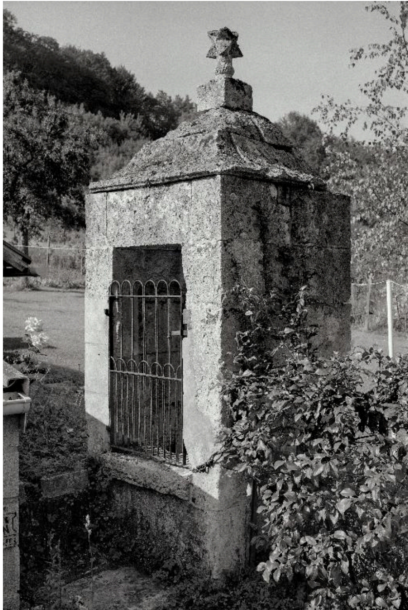
Vue d'un puits à Vivières (7 rue de la Vallée).