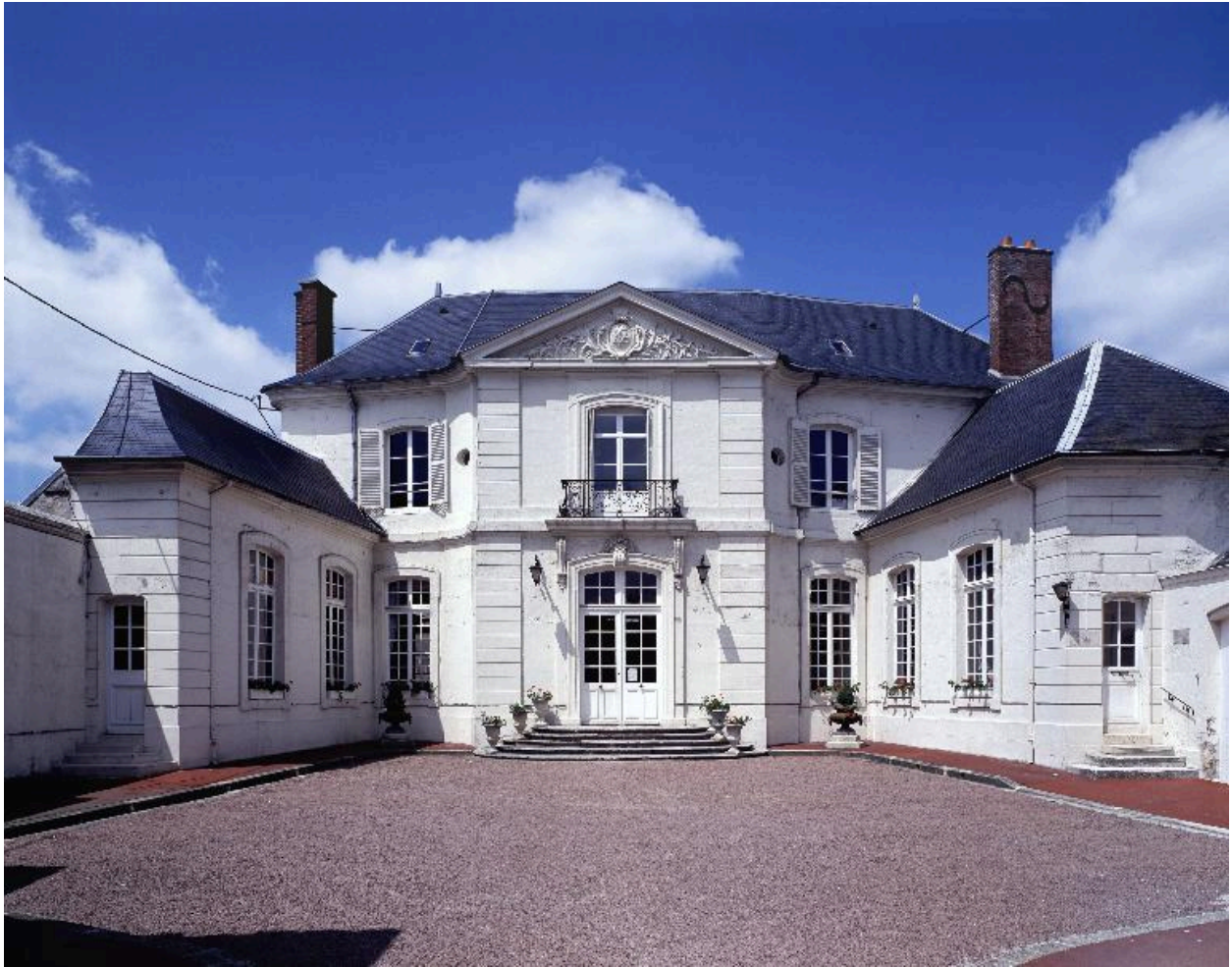
Façade de l'ancien logis abbatial prémontré de Villers-Cotterêts, servant actuellement d'hôtel de ville.