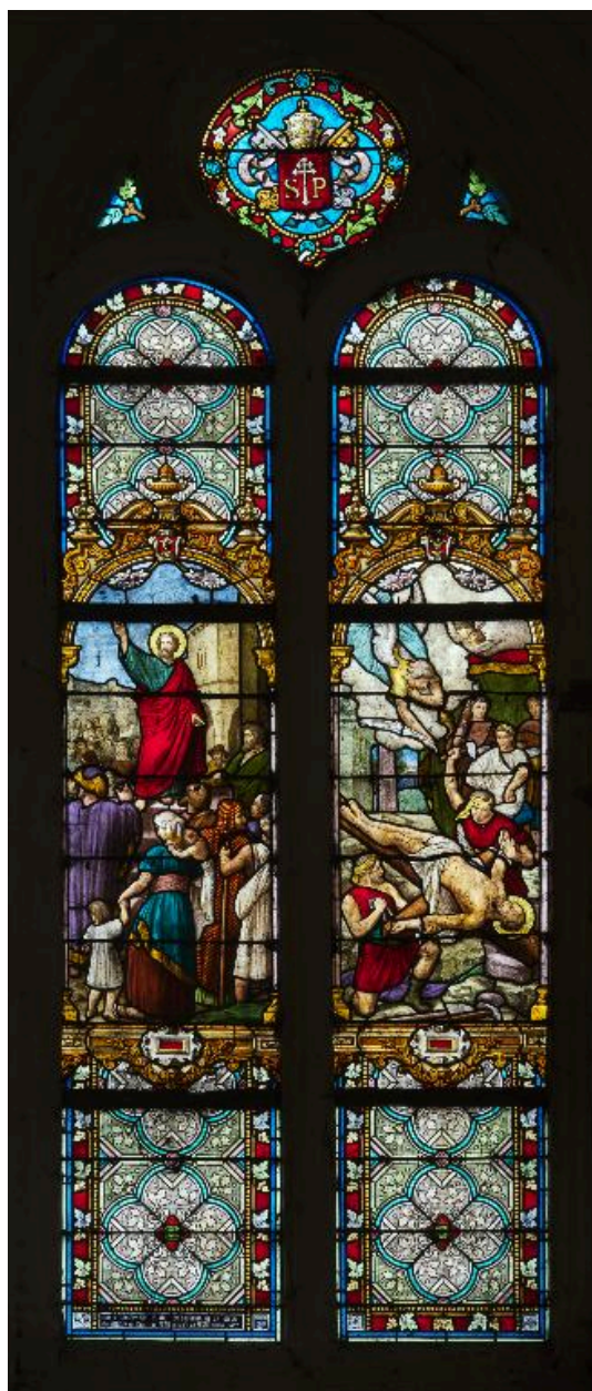
Baie 1 : Prédication de saint Paul ; Crucifiement de saint Pierre.