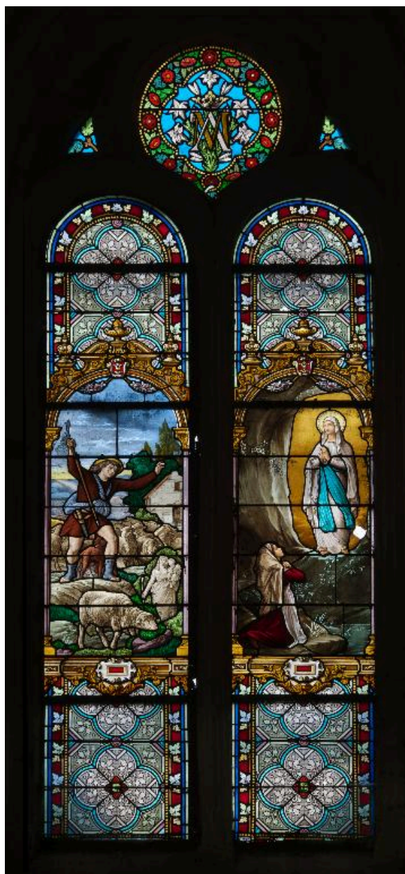
Baie 2 : Invention de la statue de Notre-Dame de Brébières (Albert) ; Apparition de la Vierge à Bernadette Soubirous.