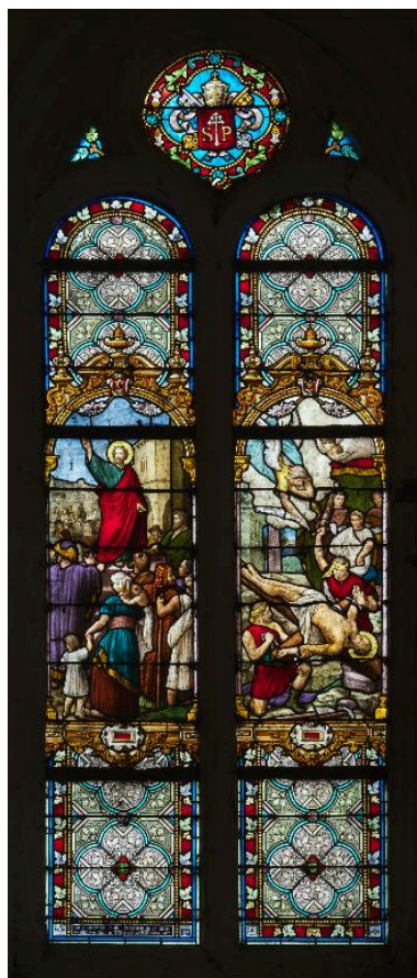
Baie 1 : Prédication de saint Paul ; Crucifiement de saint Pierre.