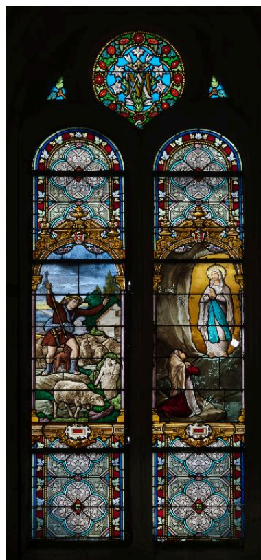
Baie 2 : Invention de la statue de Notre-Dame de Brébières (Albert) ; Apparition de la Vierge à Bernadette Soubirous. IVR22_20128001353NUC2A