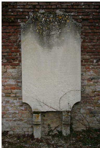
Stèle funéraire d'applique (gauche) IVR22_20068000674NUCA