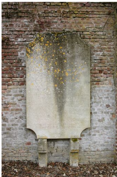
Stèle funéraire d'applique (droite).