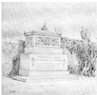
Le tombeau de M. Morgan de Belloy au cimetière de la Madeleine. Dessin des Duthoit, vers 1850 (Amiens, Musée de Picardie ; MP Duthoit VI-91).

IVR22_20078000775NUCA