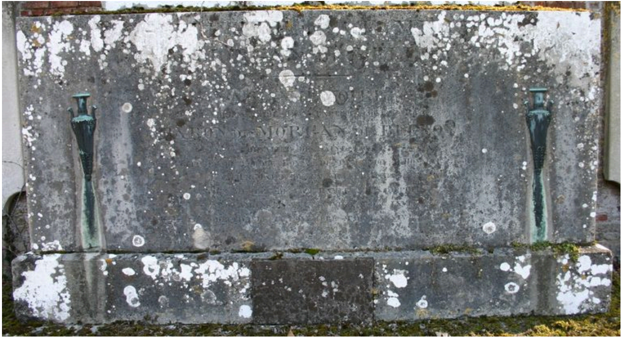
Monument sépulcral de Morgan de Belloy. Partie inférieure.