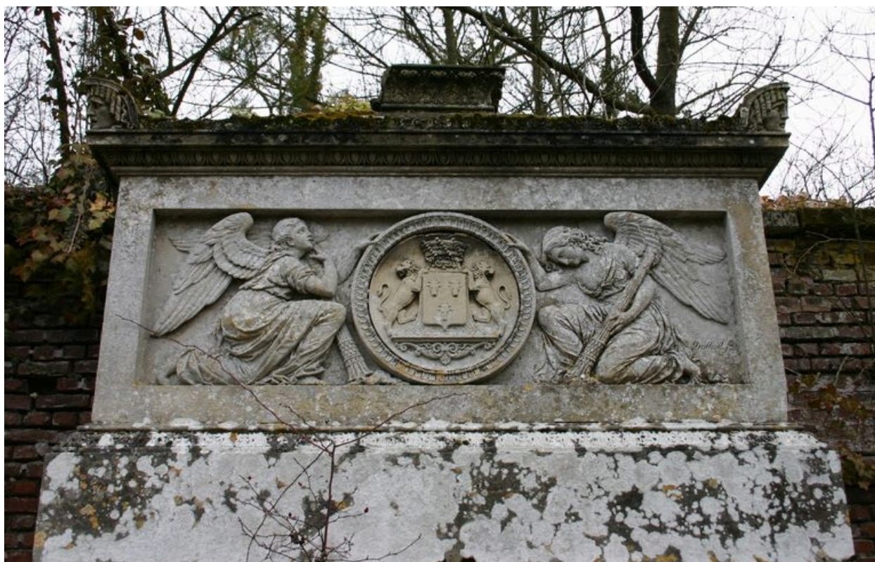
Monument sépulcral de Morgan de Belloy. Partie supérieure.