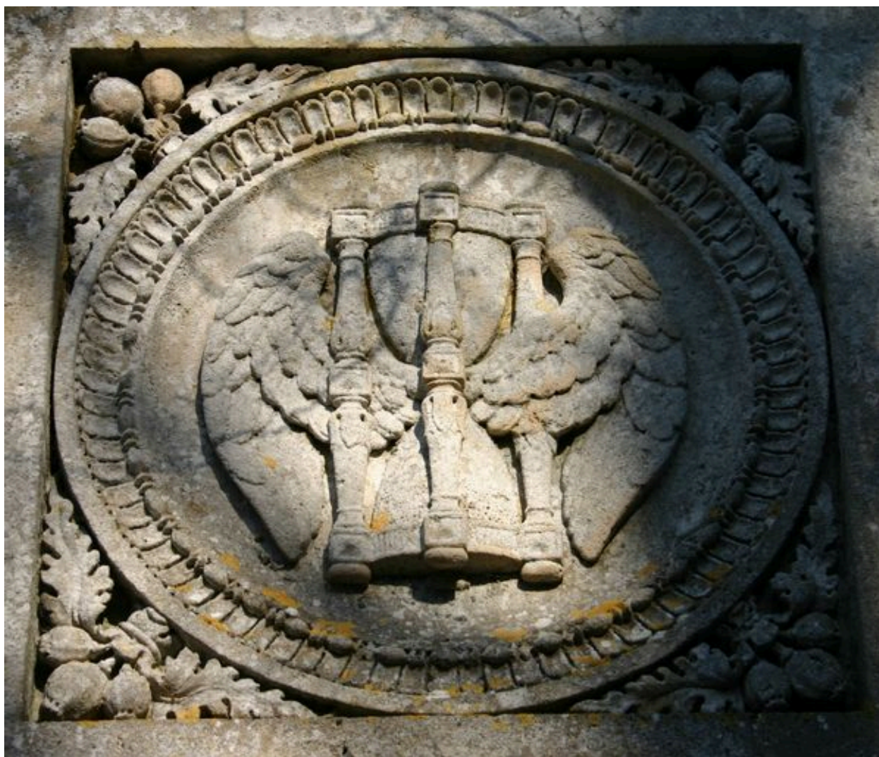
Monument sépulcral de Morgan de Belloy. Vue de détail sur le décor sculpté, ornant les faces latérales de l'élévation supérieure.