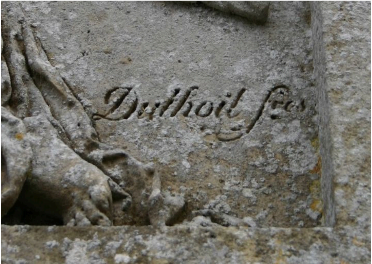
Monument sépulcral de Morgan de Belloy. Vue de détail sur la signature.