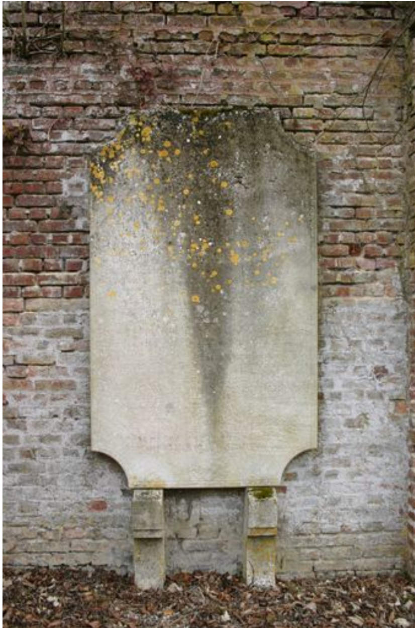
Stèle funéraire d'applique (droite).