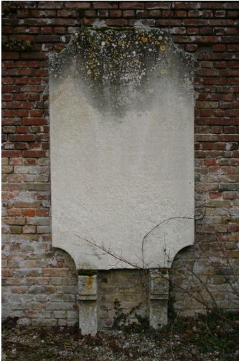
Stèle funéraire d'applique (gauche)