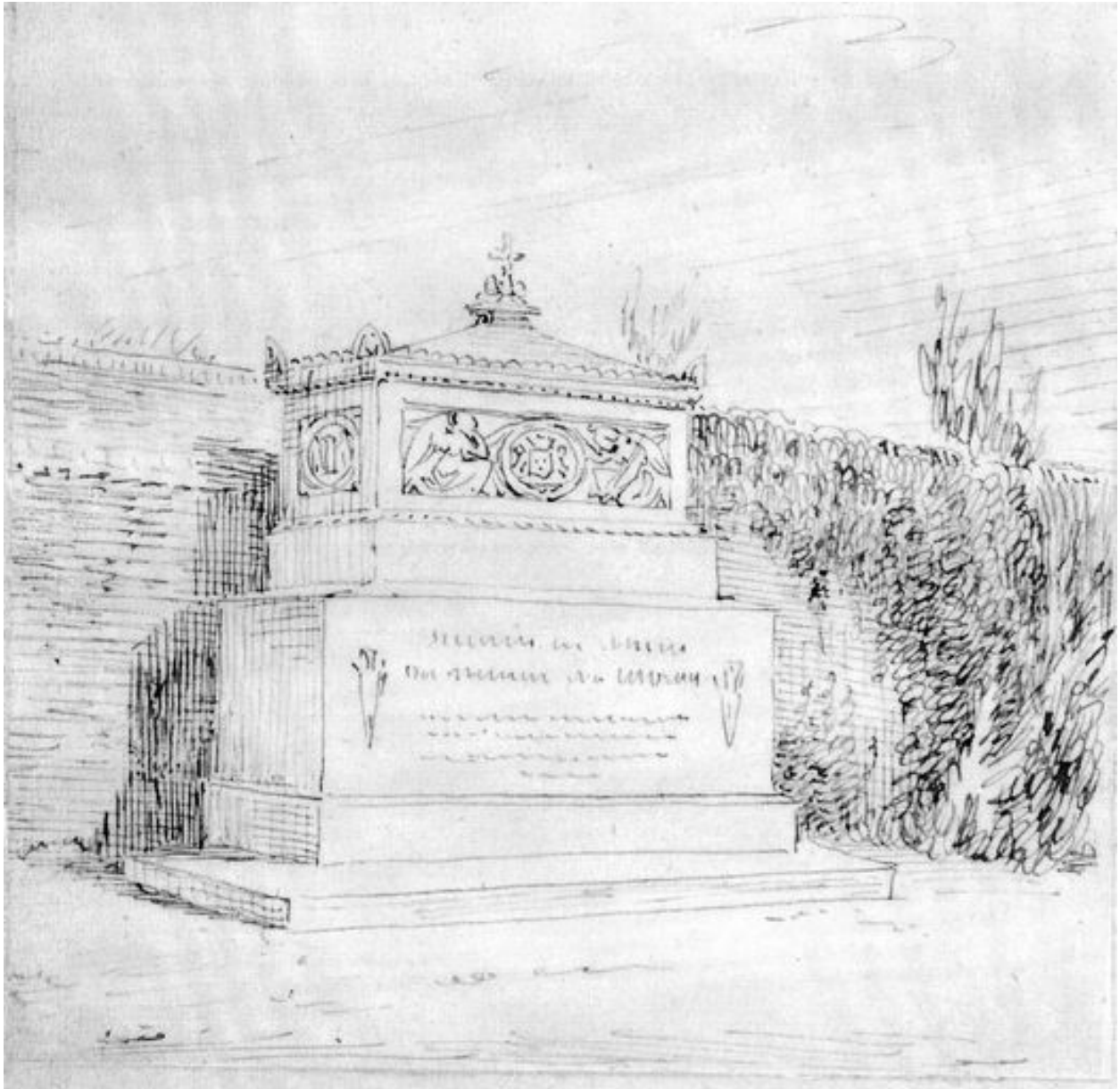
Le tombeau de M. Morgan de Belloy au cimetière de la Madeleine. Dessin des Duthoit, vers 1850 (Amiens, Musée de Picardie ; MP Duthoit VI-91).