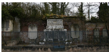
Vue générale. IVR22_20068000670NUCA

(reproduction) IVR22_20078000775NUCA