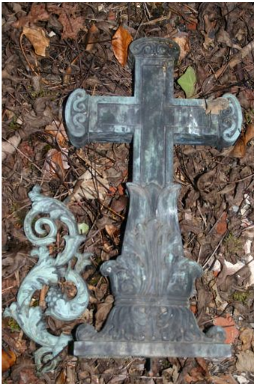
Croix en bronze déposée, surmontant initialement le monument sépulcral de Morgan de Belloy.