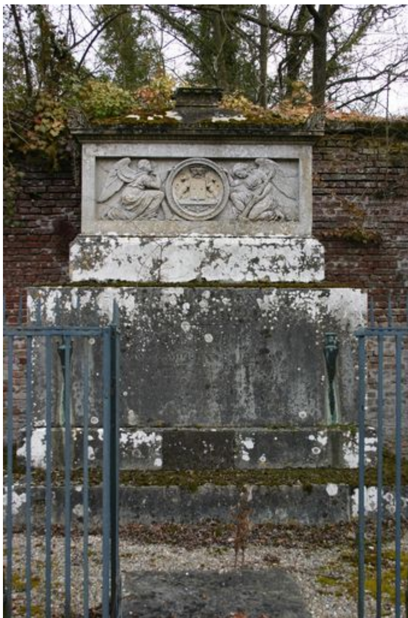
Monument sépulcral de Morgan de Belloy. Vue générale.