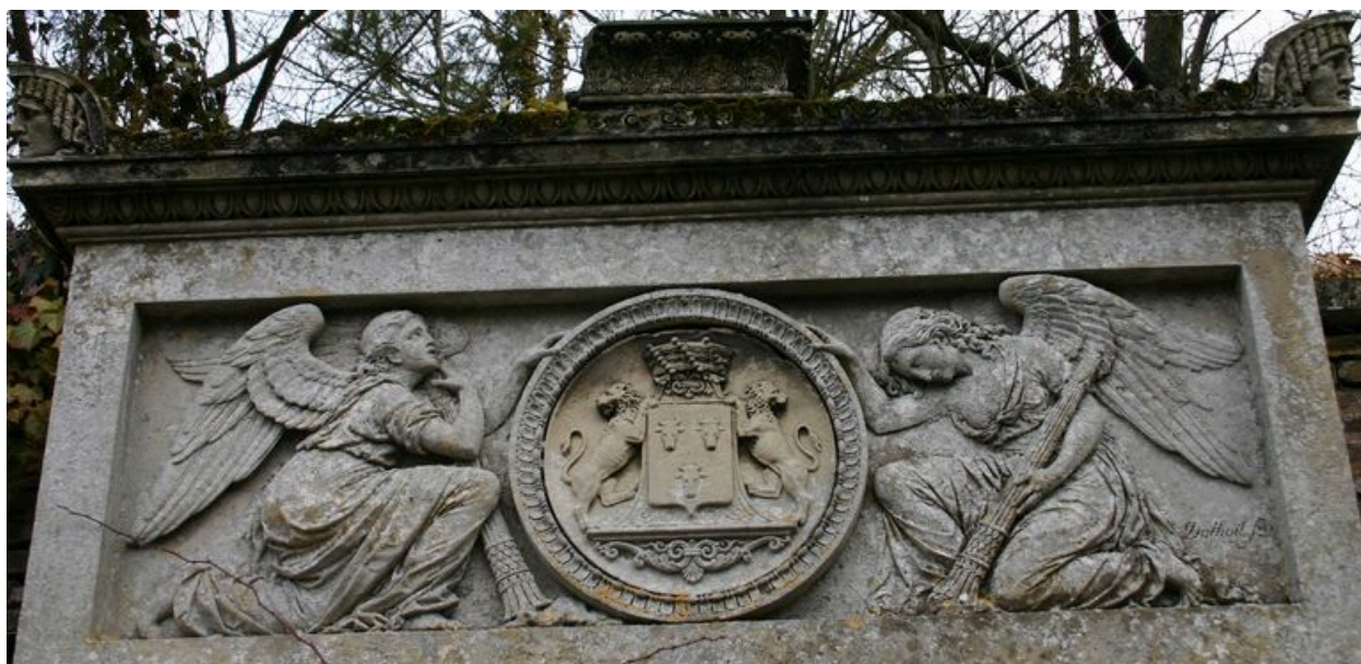
Monument sépulcral de Morgan de Belloy. Vue de détail sur le bas-relief ornant la partie supérieure.