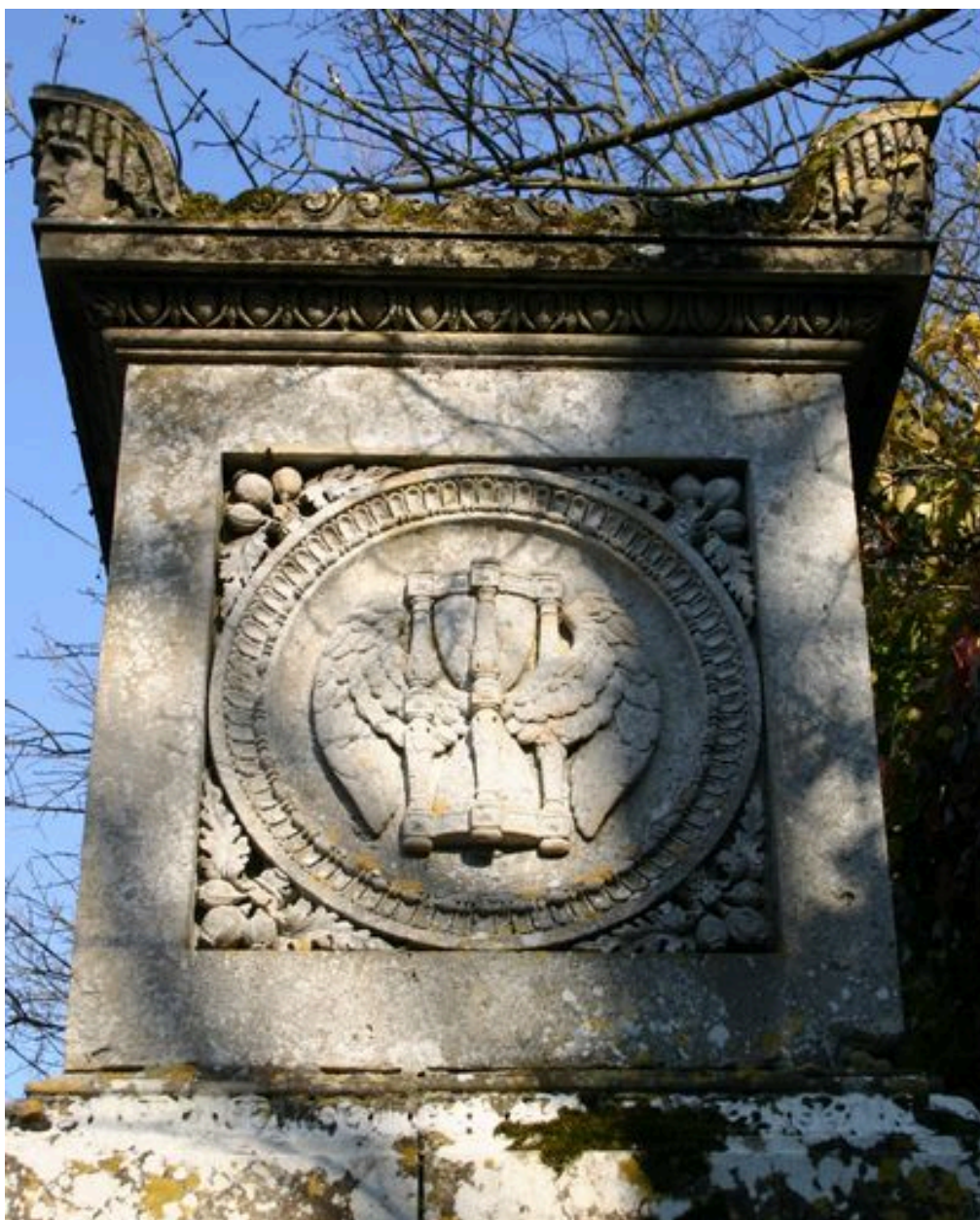
Monument sépulcral de Morgan de Belloy. Face latérale de la partie supérieure.