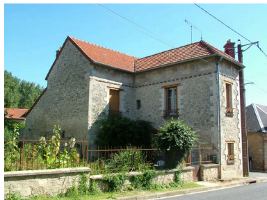
Vue générale. IVR22_20030202492NUCA